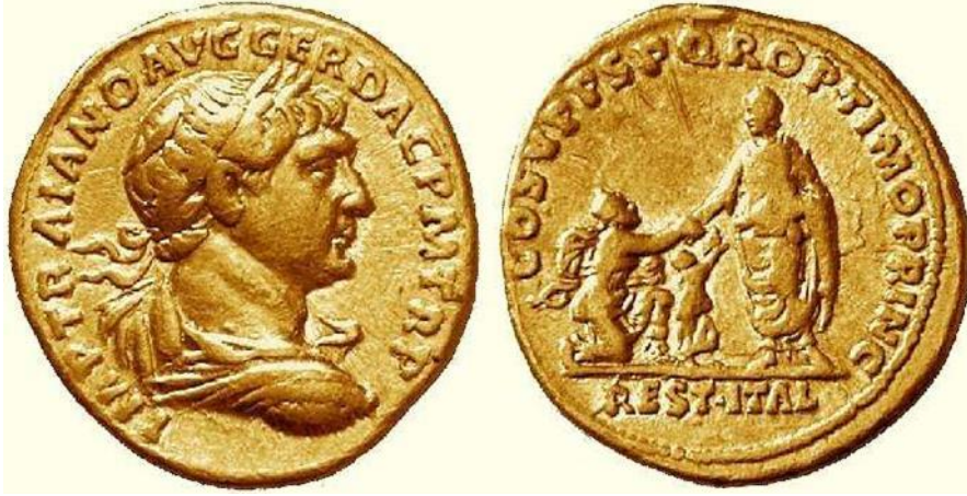
Resim 3: Traianus Sikkesi 2

Öz yüzünde imparator Traianus'un tasvirinin yer aldığı, arka yüzünde yine Traianus'un diz çöken Italia figürünün kaldırırken aralarında bulunan iki çocuğun ve Rest Ital lejantının yer aldığı sikke.