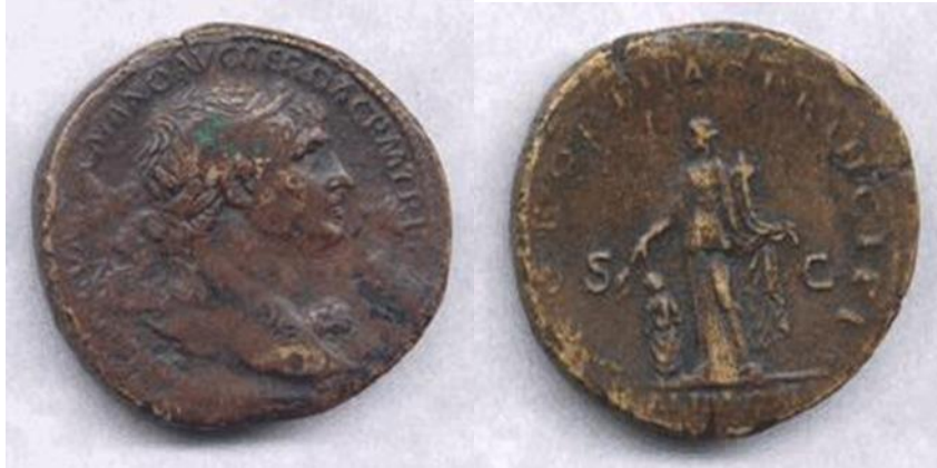
Öz yüzünde imparator Traianus'un tasvirinin yer aldığı, arka yüzünde sol elinde mısır başağı (Cornucopia) tutan tanrıçanın ayaklarının önünde bir çocuğun tasvir edildiği ve Alim Ital lejantının olduğu sikke.

https://www.wildwinds.com/coins/sear5/s3177.html#RIC_0459,Sestertius%20%202 02.02.2023.