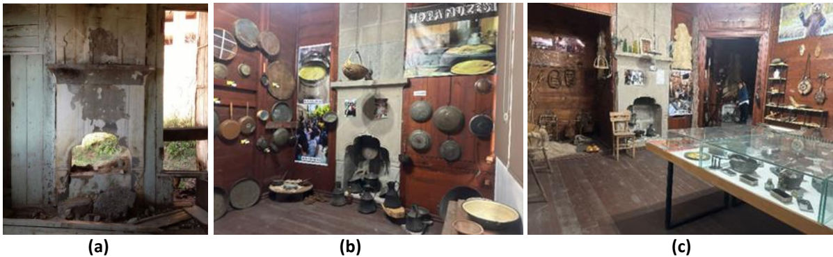
Şekil 6. Ocak (a) Ocağın restorasyon öncesi görünümü; (b), (c) günümüzde oda içindeki ocağın dokusu ve kullanımı.

Yapının iç mekân duvarları, döşeme ve tavanlar ahşap olarak yenilenmiş ve geleneksel yapıdaki etkisi sürdürülmüştür. Hopa Kültür Evi'nde, odalarda bulunan ocaklarda (ocaklık) doğal taş, yığma tekniği ile uygulanarak aslına uygun siva yapılmıştır. Siva kaplı ocakların genel görünümü mekânın genel atmosferi ile ters bir ilişki kurmasına karşın orijinal uygulama ile uyumlu olduğu görülmektedir (Şekil 6).