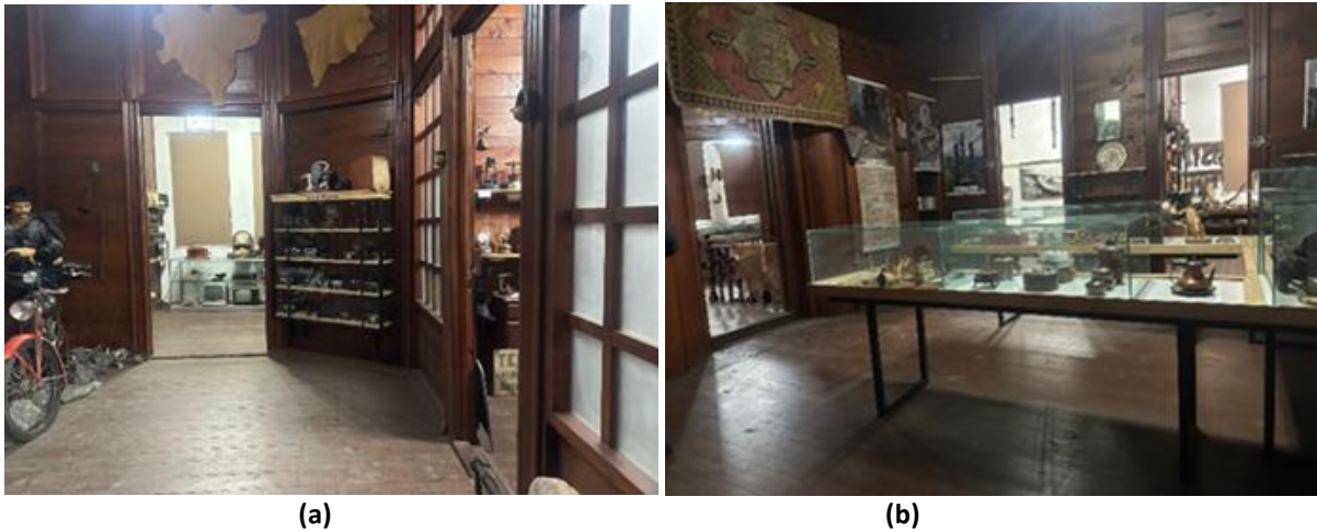
Şekil 4. Ahşap ve eserlerin birlikteliği ile oluşan mekân atmosferi (a) 1. Katta küçük sofada sergi mekânı; (b) 1. Katta büyük sofada sergi mekânı.

Bu bölümde, yenilenerek Hopa Kültür Evi adıyla müze olarak kullanılan geleneksel konutun, görsel algı ve mekânsal okunabilirliğe ilişkin tasarım bileşenleri değerlendirilmektedir. Yapıldığı dönemde konut yapısı olarak tasarlanan Hopa Kültür Evi, mekânsal kurguda fazla değişik yapılmadan aslında uygun restore edilmiştir. Yeni kullanımda yapının iç mekân bölücüleri, döşeme ve tavan, aslına uygun ahşap olarak yapılmıştır. Mekânın eleman ve bileşenlerinin sergilenen etnografik eserlerle uyum sağlaması, mekân kurgusu bağlamında yapının bütüncül bir yaklaşımla ele alındığını göstermektedir. Yapı yeniden işlevlendirilirken, mekânsal kurgu, plan şeması, mekânı oluşturan elemanlar (duvar, döşeme ve tavan), sabit donatı elemanlarının sürekliliği ile yaşam pratiğinde iç mekân oluşumlarının ifade etmek istediği fiziksel ve psikolojik koşullar sağlanmaktadır. Görsel algı açısından mekânın genel atmosferi ve tasarımı, sergilenen eserler ile uyumlu bir mekân kalitesi sunmaktadır (Şekil 4).