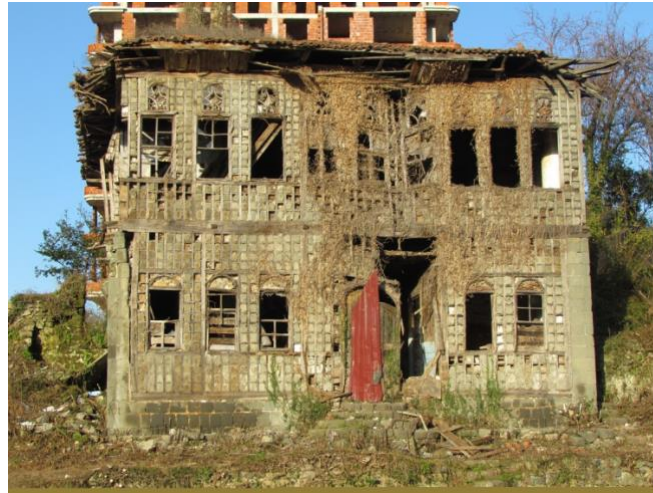
Şekil 1. Yenilenme çalışması öncesinde Hopa Kültür Evi.

Çalışmanın bu bölümünde, yeniden işlevlendirilerek müze olarak faaliyete geçirilen geleneksel konut yapısının görsel algı bileşenleri dikkate alınarak, mekânsal okunabilirliği değerlendirilmiştir. Bölgenin mimari karakterini yansıtan geleneksel yapı, 19. yüzyıl yöre sivil mimarisinin örneklerinden birisidir. Artvin'in Hopa ilçesinde korunması gerekli tescilli taşınmaz sivil mimarlık örneklerinden olan bu yapı, bölge halkından Osmanoğulları'na ait bir konut yapısı iken 2015 yılında Hopa Belediyesi tarafından mülkiyeti satın alınmıştır. Yörenin mimari özelliklerini yansıtan yapı, 20. yüzyıl başlarında inşa edilmiş tescilli bir konaktır. Rus işgali döneminde hastane olarak da kullanılmıştır. Söz konusu yapı, uzun yıllar metruk kalmış, 2016 yılında Doğu Karadeniz Kalkınma Ajansı (DOKA)'nın desteğiyle restore edilmiştir (Şekil 1).