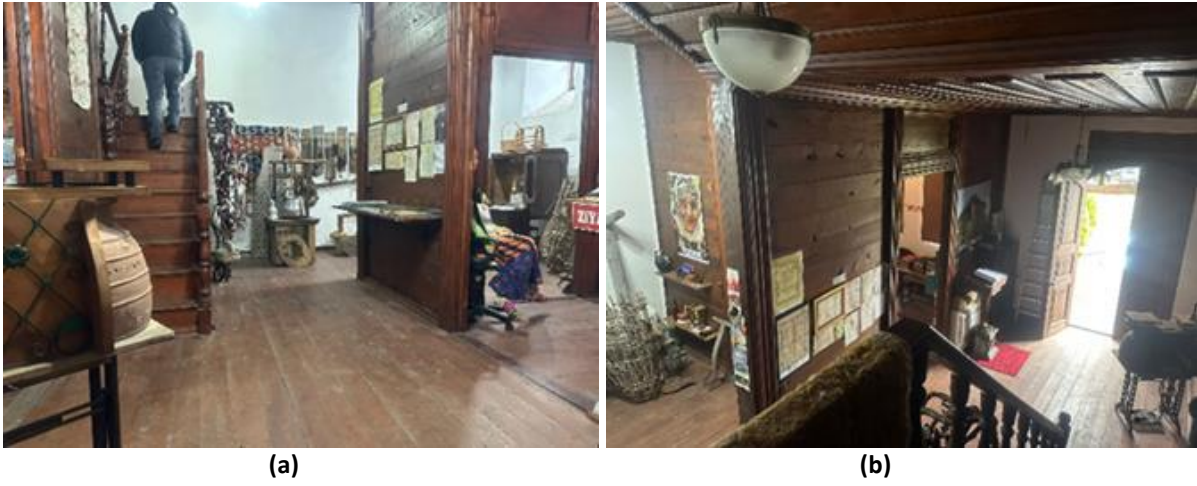
Şekil 5. Zemin kat giriş mekânı (a) Zemin Kat merdiven sofası, ziyaretçi karşılama mekanı; (b) Zemin kat girişi, ziyaretçi karşılama mekanı (Kaynak: (a),(b) Çıldır ve Eminağaoğlu kişisel arşivleri, 2023).

Müze yapılarında yön bulma, mekânın kalitesini doğrudan etkilemektedir. Mekânın içindeki hareket sağlanırken, yani serginin sıkılmadan, yorulmadan merak uyandırarak gezilmesinde mekânın düzenleniş biçimi ve mekânlar arasında ilişki kurulması önemlidir. “Müzelerde sirkülasyona yön veren ve görsel, fiziksel hareketi sağlayan sergi mekânlarındaki sergileme düzeninin amaçsız boşluklar ile kesilmesi veya anlamsız boyutsal / biçimsel ilişkiler ile biçimlenmesi, bireyin mekânsal algısında tanımsız kesitler oluşturacaktır” (Uslu ve Yalçın, 2020, s. 236). Hopa Kültür Evi müzesinde sergi mekânları arasındaki geçişlerle sirkülasyonda süreklilik yaratılarak tüm noktalara tekrar edilmeksizin ulaşılması sağlanmıştır. Bunun için odalar arası geçişi sağlayan kapılar kaldırılarak geçiş noktaları sergi mekânına uygun düzenlenmiştir. Odalar arasındaki sofa (hayat) hem sergi mekânı olarak kullanılmakta hem de tüm sergi mekânlarının algılandığı ve dağılımın sağlandığı merkezi mekân konumundadır (Şekil 5).