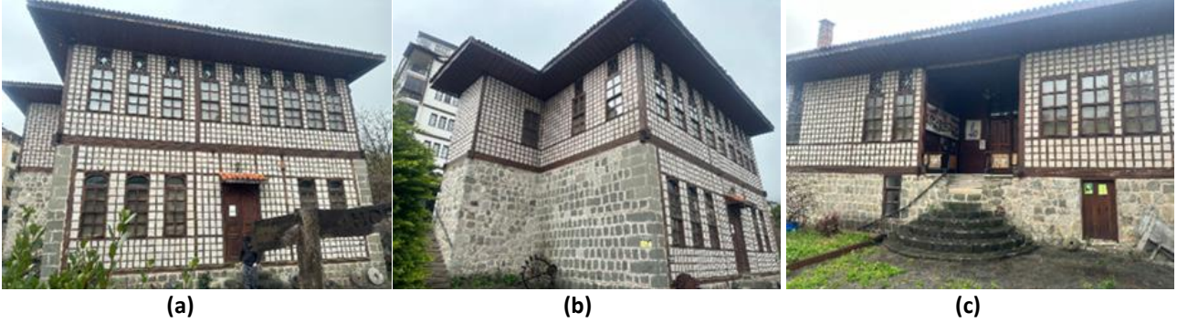
Şekil 2. Hopa Kültür Evinin cephe görüntüleri (a) Güney Cephesi; (b) Batı Cephesi; (c) Doğu Cephesi.

Hopa Kültür Evi iki kattan oluşmaktadır. Dört cepheli ve iç sofalıdır. Yapının dış duvarlarında kaba yontu taş ve göz dolma sistem görülmektedir. Cephedeki pencere dizilimleri, ahşap kayıtlar ve pencere üstü ahşap motifler geleneksel yapıya uygun olarak yenilenmiştir. Geniş saçaklı kırma çatıda aslına uygun olarak Marsilya kiremit malzemesi kullanılmıştır (Şekil 2).