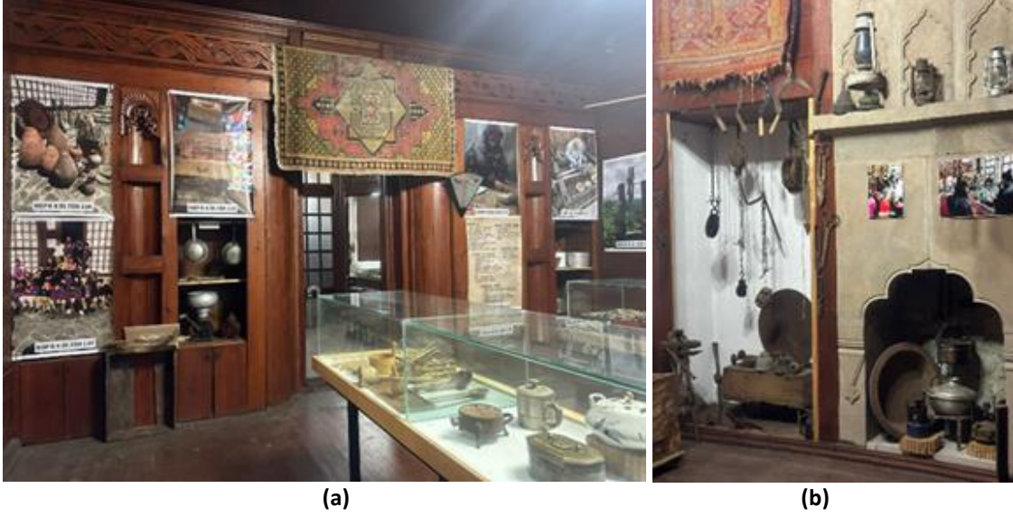
Şekil 8. Sofayı (hayat) ayıran dolap ve oda içindeki dolap şeklindeki yıkanma yeri (a) 1. Kata iç sofayı bölen dolap; (b) Ocak yanında kapısı sökülmüş yıkanma dolabı ( Kaynak: (a),(b) Çıldır ve Eminağaoğlu kişisel arşivi, 2023).

Sergi vitrinleri arasında malzeme ve biçim olarak bir uyum görülmemektedir. Farklı dönemlerde ihtiyaca göre oluşmuş donatılar biçimindedir. Bazı vitrinlerde ise kapasitesinin üstünde ürün sergilenmekte, bu durum da algıyı zayıflatmaktadır. Vitrinlerin konum, biçim ve büyüklük olarak mekânın kurgusuna uygun düzenlenmesi gerekmektedir.