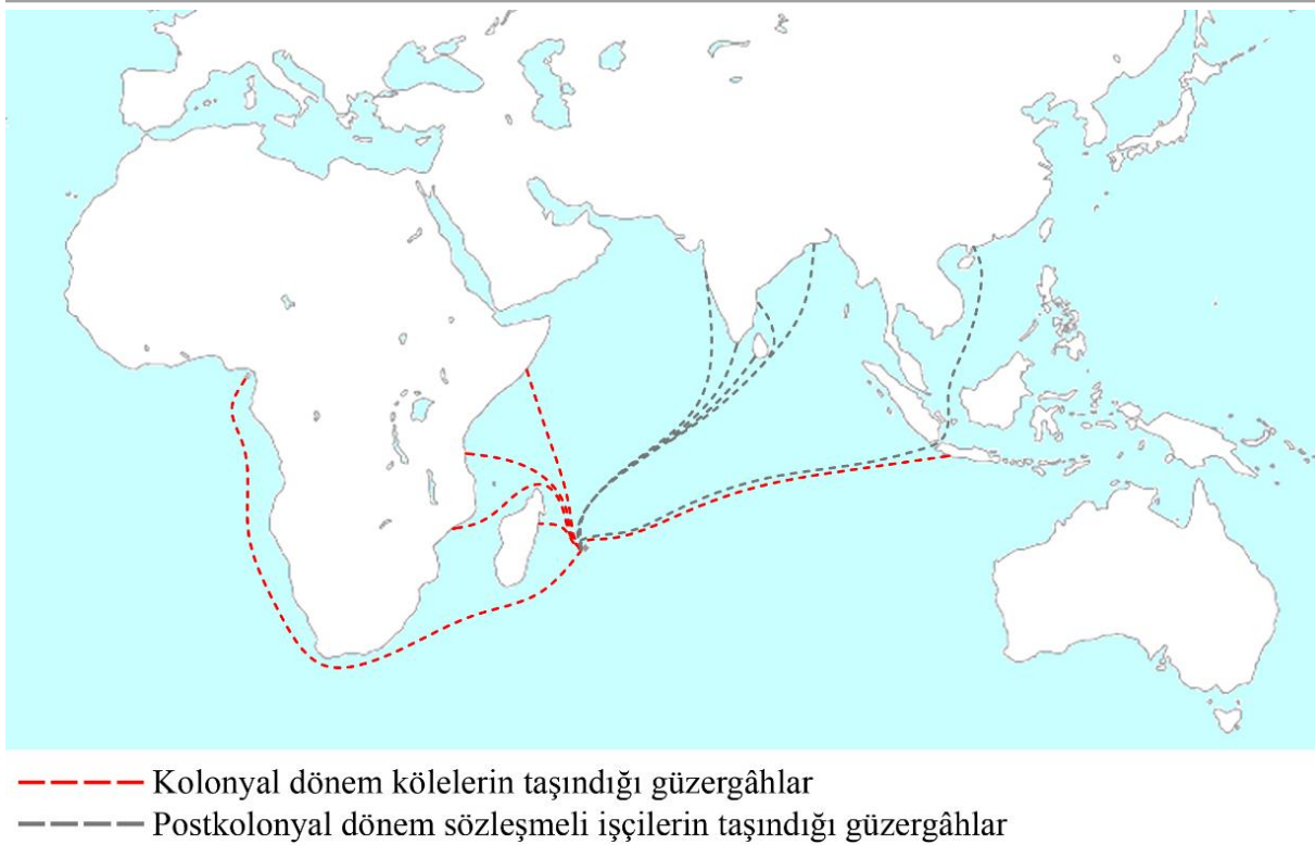
Şekil 2. Mauritius Adası'nda çalıştırılmak üzere getirilen köle ve sözleşmeli işçilerin taşındıkları güzergâhlar (kaynak: Seetah vd., 2011, veriler derlenerek)