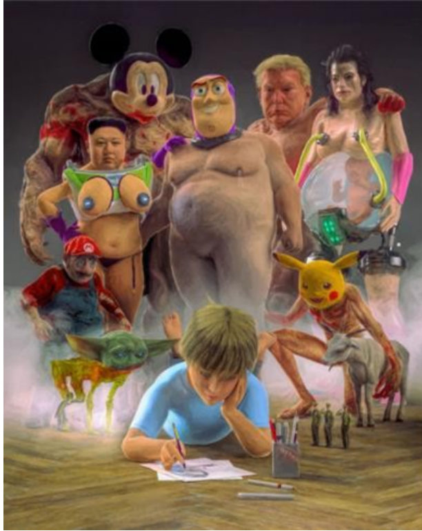
Görsel 6. Beeple, HER GÜN: İLK 5000 GÜN resminin bölümlerinden biri, 2021: URL 1

Beeple, bu eseri (Görsel 5) ABD Başkan Yardımcısı Mike Pence'in beklenmedik bir şekilde başının üzerine düştüğü 2020 Başkan Yardımcılığı tartışmasından yaklaşık bir saat sonra yapmıştır (Christie, 2022).