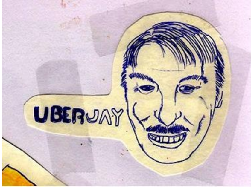
Görsel 2. Beeple, “Uber Adamı”, “HER GÜN: İLK 5000 GÜN” resminin bölümlerinden biri, 2021: URL 1

Beş temel görüntüde EveryDay’s sanat eserinin evrimi ise şu şekildedir: