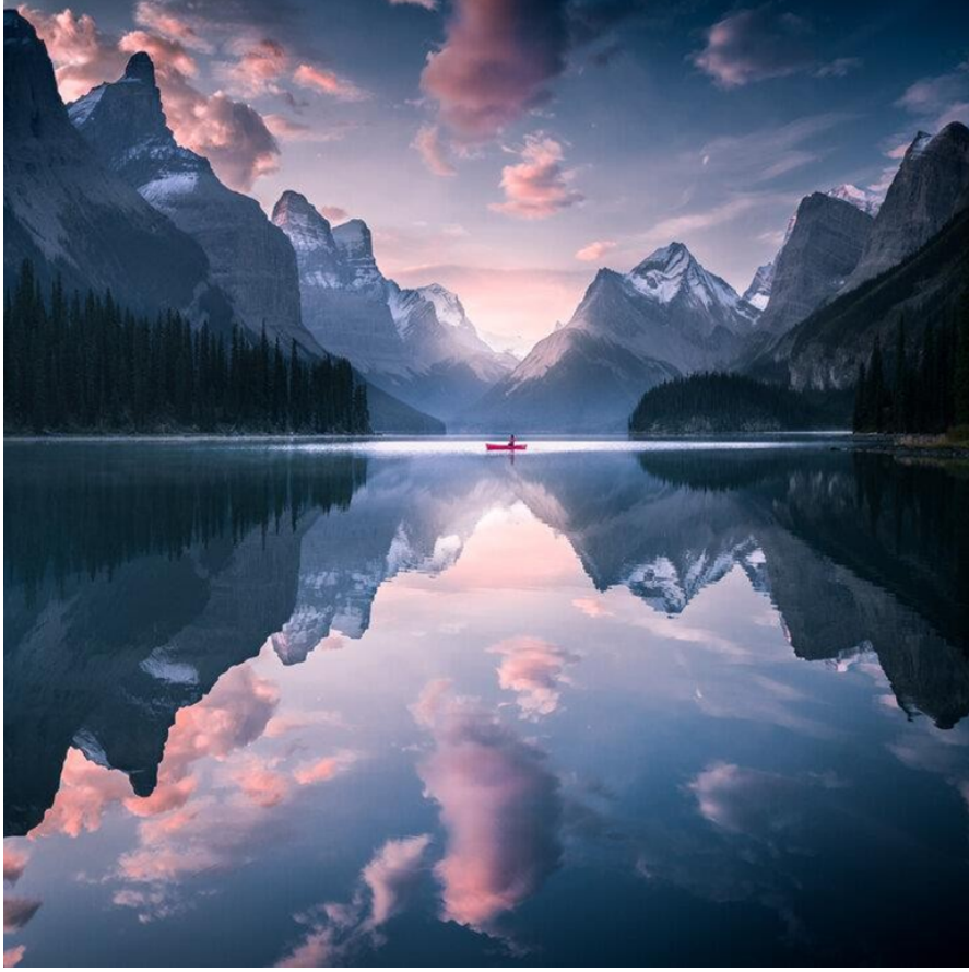
Görsel 9. Cath Simard, LE DÉPART, 2021. NFT (jpg): URL 4

Cath Simard'ın Genesis koleksiyonunun bir parçası olan LE DÉPART, tek bir görüntü ve ışığın içindeki bir yerden kişisel bir deneyim içermektedir; Spirit Island, Kanada Kayalık Dağları'nın kalbinde yer alan uzak bir mistik adadır. Bu çalışma, sosyal medyada on milyonlarca kez görüntülendi, paylaşıldı ve en büyük fotoğraf sayfalarından bazılarında yer aldı. Burası sanatçının kendi rahatlık alanının dışına çıktığı ve bilinmeyen korkusunu yenmeye başladığı yerlerden biridir. Sanatçı bu çalışmasıyla bir kişiye rahatlık alanından çıkması için ilham vermek istemiştir (Simard, 2021).