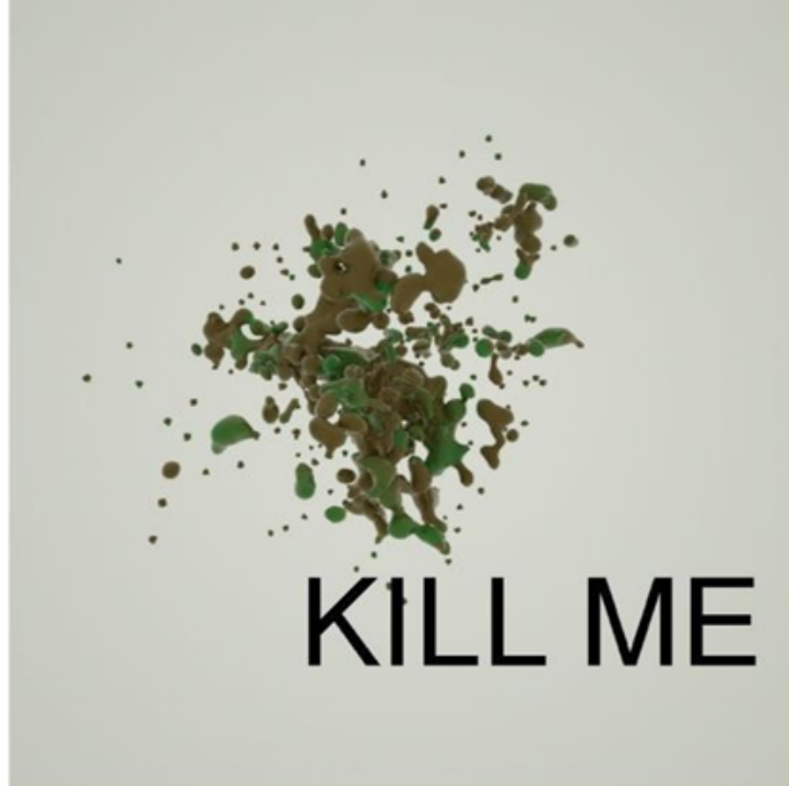
Görsel 4. Beeple, HER GÜN: İLK 5000 GÜN resminin bölümlerinden biri, 2021: URL 1

Beeple, karısını ilk çocuklarını doğurması için hastaneye götürmeden hemen önce çizdiği bu resmi sabahın beşinde çizdiğini dile getirmiştir (Görsel 3) (Christie, 2022).