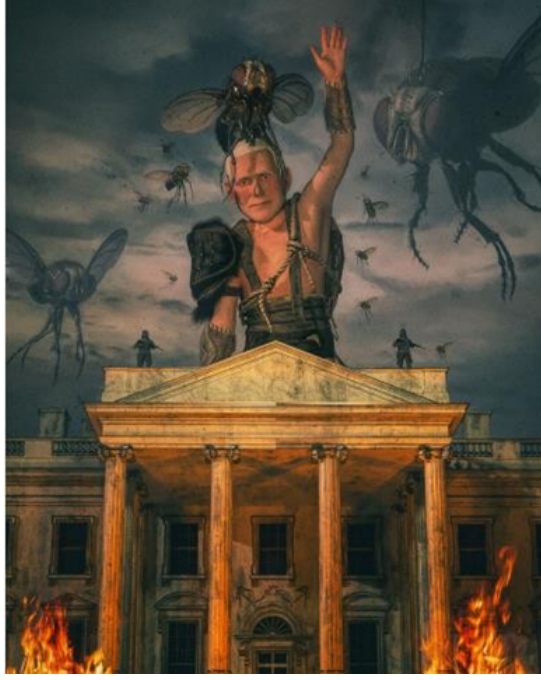
Görsel 5. Beeple, HER GÜN: İLK 5000 GÜN resminin bölümlerinden biri, 2021: URL 1

Beeple, bu eseri, gıda zehirlenmesi yaşarken çizmiştir (Görsel 4) (Christie, 2022).