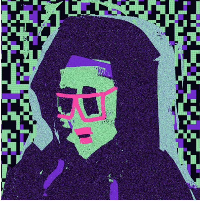
Görsel 7. XCOPY, “Sağ Tıklayın ve Adam Olarak Kaydedin”, 2018. NFT gif: URL 2

“Sağ Tıklayın ve Adam Olarak Kaydedin” isimli bu eser (Görsel 7), NFT sanat resimlerini adil bir fiyat ödemek yerine kelimenin tam anlamıyla sağ tıklayarak kaydetmeyi seçen insanları eleştiren animasyonlu bir GIF'dir. XCOPY'de alıştığımız tipik distopik tarzdan uzaklaşmasına rağmen, arka planda yanıp sönen bir yeşil ve mavi okyanusu ile farklı parlak renkli temalara sahip cesur bir kişiliğe sahiptir ve sanatçı burada temel tasarım ilkelerine sadık kalmaktadır (Barker, 2023).