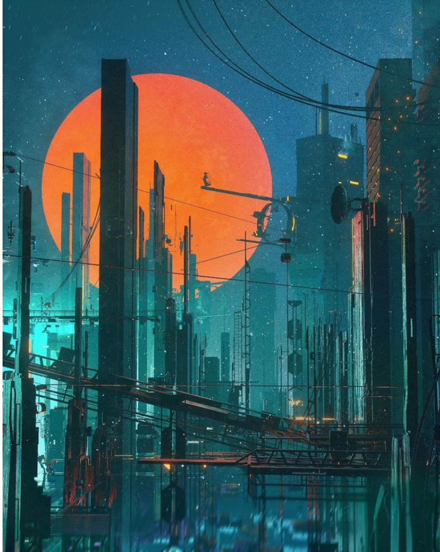
Görsel 10. Leopoldo D'Angelo, Büyük Meydan Okuma, 2021. NFT (jpg): URL 5