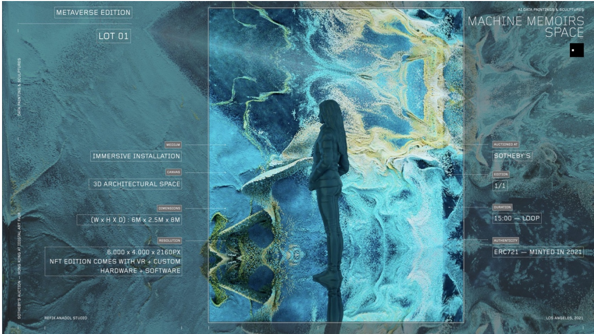
Görsel 8. Refik Anadol, Makine Halüsinasyonları – Uzay: Metaverse, 2021, Sürükleyici Nft Kurulumu, 15:00 Döngü, 6.000 X 4.000 X 2160 Px, Boyutlar (G X Y X D): 6m X 2.5m X 8m: Url 3