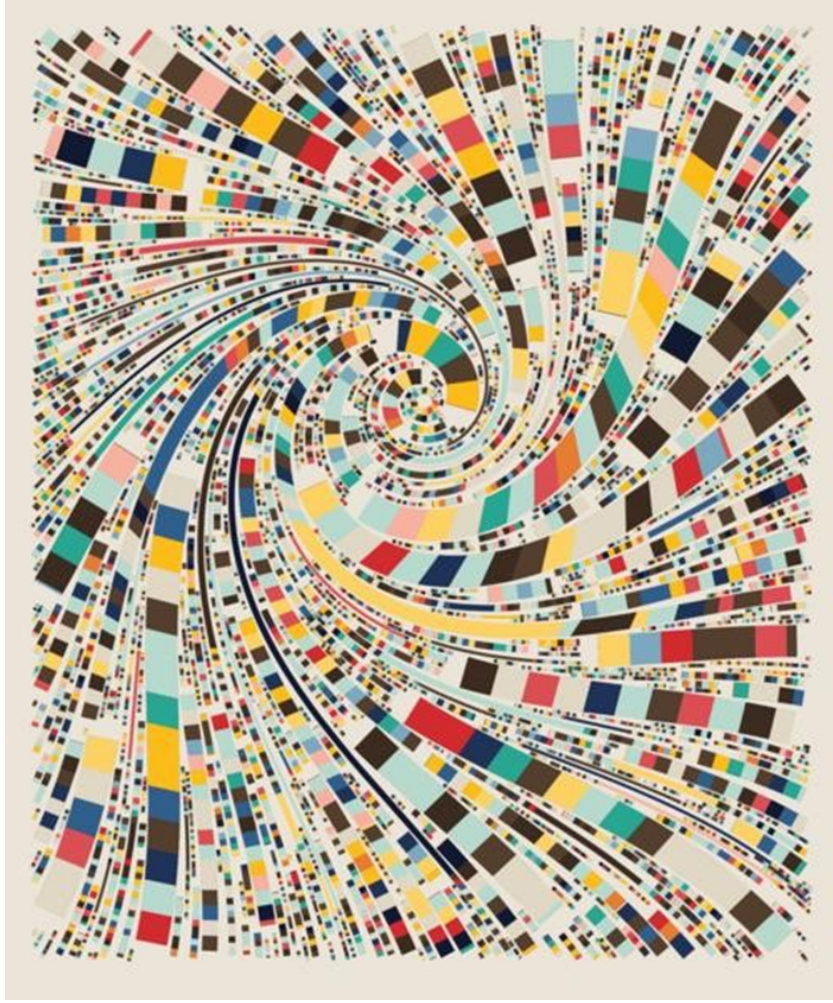
Görsel 11. Tyler Hobbs, Fidenza, 2021. NFT (jpg): URL 6

Fidenza, tam zamanlı bir sanatçı olarak çalışmak için bilgisayar mühendisliği işini bırakan 34 yaşındaki Tyler Hobbs'un beynidir. Üretken sanata dayalı NFT'ler yaratan bir sanat platformu olan Art Blocks'u keşfettiğinde başladı. "Fidenza" (Görsel 11) isimli bu çalışma, Hobbs'un Google Haritalar aracılığıyla rastladığı kuzey İtalya'daki bir kasabanın adını taşımaktadır. Soyut dışavurumcu ressam Francis Klein'dan ilham alan Hobbs, eserlerinde kesin anlam taşıdıkları için yer adlarını kullanmayı sevmektedir (Ahonen, 2021).