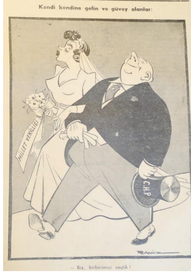
Karikatür 2: Mizah, 4 Nisan 1947

Mizah dergisinin 1947 ara seçimlerini konu ettiği karikatüründe bir gelin ve damat göze çarpmaktadır.