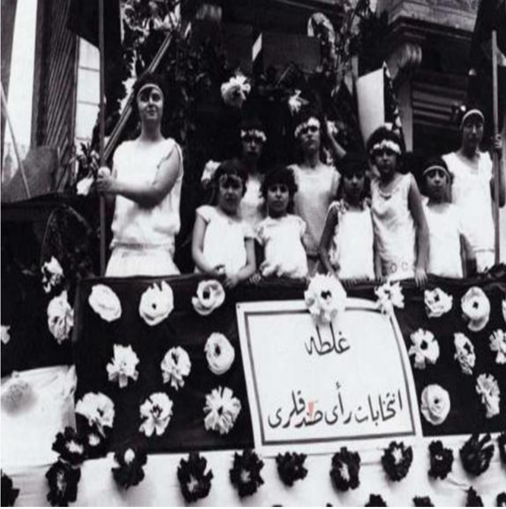
Cumhuriyet Ansiklopedisi (1923-1940), C: 1. İstanbul, Yapı Kredi Yay., 2002, 94.