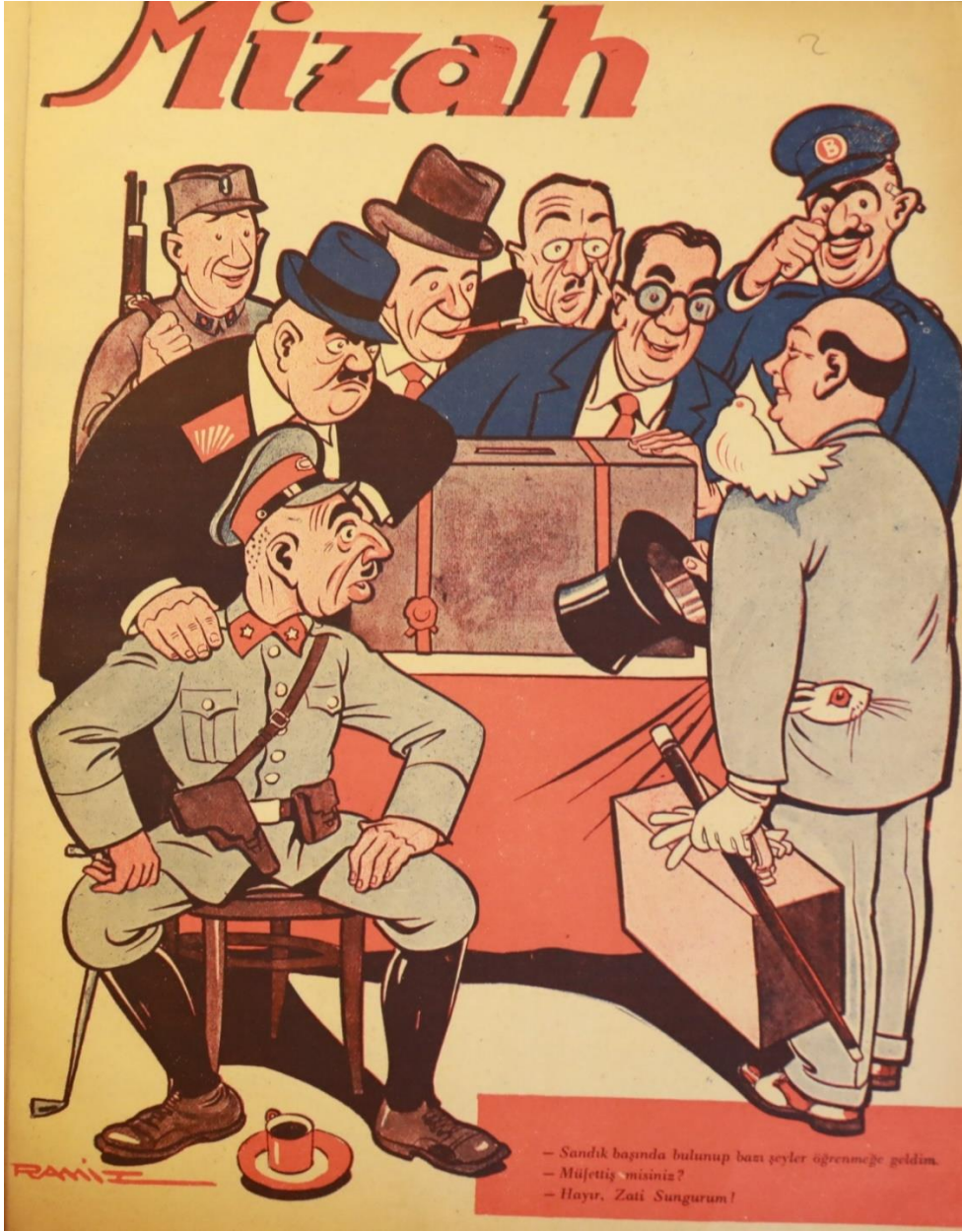
Mizah, 19 Temmuz 1946.