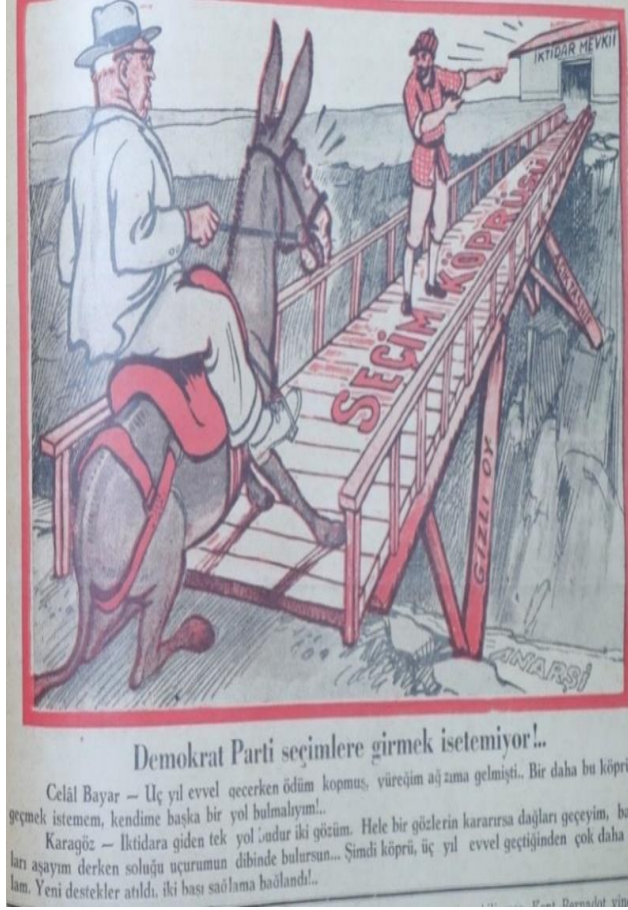
Karikatür 3: Karagöz, 22 Temmuz 1948

Karagöz dergisinin DP'nin girmeme kararı aldığı ara seçimlere dair resmettiği karikatüründe eşeğin üzerinde yer alan bir erkeğin köprüden geçmemek için direndiği gözlemlenmektedir.