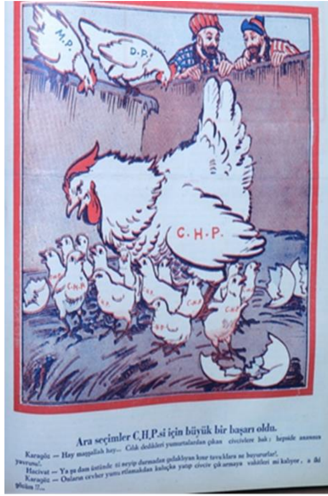
Karikatür 5: Karagöz, 20 Ekim 1949

İktidar-muhalefet ilişkilerinin bir hayli gerginleştiği bu evrede gerçekleşen 16 Ekim 1949'da ara seçimlerinde 105 iktidarın bitip tükenmeyen baskın kimyası, muhalefetin kararlı ve istikrarlı protest tavrı halka da tesir etmiş ve bu nedenle seçimlere katılım bir hayli düşük olmuştur. 106