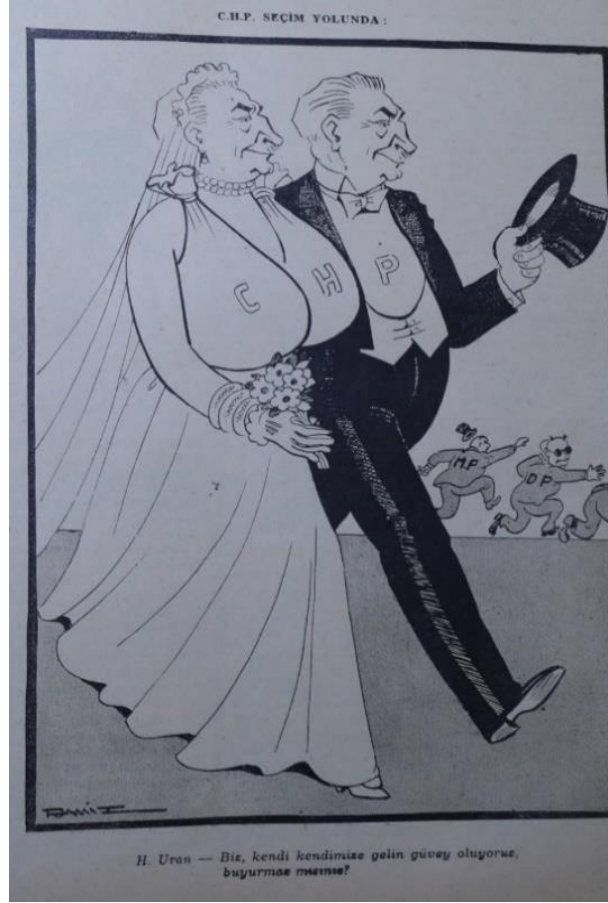
Karikatür 6: Mizah, 23 Eylül 1949

Mizah dergisinin 1949 milletvekilliği ara seçimlerine dair resmettiği karikatürüne bakıldığında gelinin ve damadın yer aldığı bir evlilik merasiminden hızlıca kaçan üç şahıs dikkat çekmektedir.