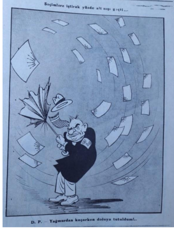
Karikatür 1: Akbaba, 16 Nisan 1947

Akbaba dergisinin 1947 milletvekilliği ara seçimlerine dair manşetine taşıdığı karikatürüne bakıldığında fırtınayla mücadele eden bir erkek görülmektedir.