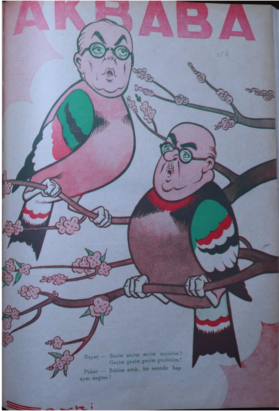
Akbaba, 19 Mart 1947.