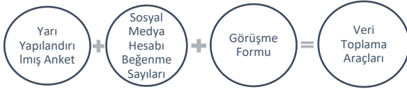
Şekil 1. Veri Toplama Araçları

Yarı Yapılandırılmış Anket: 18-24 Temmuz 2022 tarihleri arasında gerçekleştirilen "Ehrama Dokunuşlar" isimli fiziki sergiyi ziyaret eden ve "Ehrama Modern Dokunuşlar" isimli sanal defileyi izleyenlerin sergi ve defileye ilişkin görüşlerini belirlemek amacıyla araştırmacılar tarafından geliştirilmiştir. Anket, serginin açık kaldığı günlerde ziyaret saatlerinde anketi cevaplamayı gönüllü olarak kabul eden bireylere uygulanmıştır. Anket, iki bölümden oluşmaktadır. Birinci bölümde ziyaretçilerin demografik özelliklerini belirlemeye yönelik sorulara, ikinci bölümde ise ziyaret edenlerin, hem fiziki sergi hem de sanal defile çalışması hakkındaki görüşlerini belirlemeye yönelik 8 adet açık uçlu soruya yer verilmiştir.