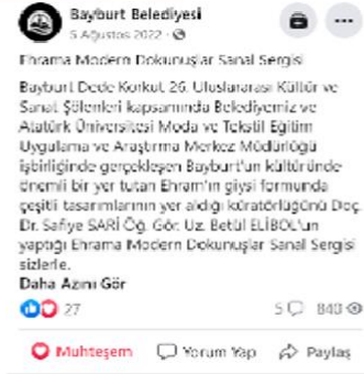
Görsel 3: Google Arama motoru üzerinden Bayburt Belediyesi Resmi Sosyal Medya Hesabında yayımlanan Afiş ve Sanat Serginin Beğenilme Sayıları

Bulgular, kültürel, sanatsal ve tasarım nitelikli faaliyetlerin yerel resmi kurum siteleri üzerinden yayımlanmasının ziyaretçilere hızlı ulaşım hatta katılımın özendirilmesi açısından faydalı olduğuna işaret etmektedir. Buna ilave olarak yapılacak etkinliklerin kurumsal sosyal medya üzerinden yayılmasının güvenli bilgiye ulaşımı açısından da önemine dikkat çekmektedir.