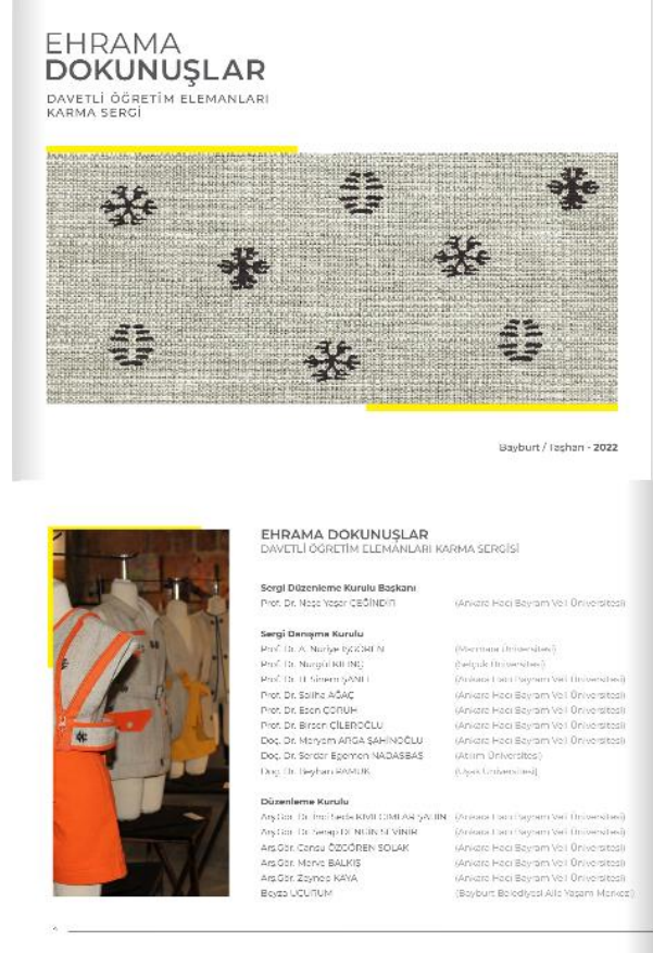
Görsel 2. Ehrama Dokunuşlar Karma Sergi Kataloğu (2022)

dokuma ustalarının emekleriyle iki aylık bir sürede dokunmuştur. Sergi koleksiyonunda de yer alan tasarımlarda hem geleneksel hem de endüstriyel yöntemle hazırlanan, çoğunlukla açık renkli Ehram dokumaları ana malzeme olarak kullanılmıştır. Böylece farklı ekonomik düzeydeki genç ve orta yaşta farklı tüketici/pazar gruplarına hitap edilmiştir. Ürünler, gündülden özel gün giyim türleri ve aksesuarlarına doğru farklı çeşitliliktedir.