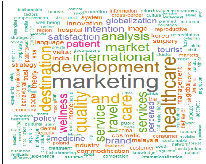
Şekil 1: Tüm Gözlem Dönemi Kelime Bulutu Analizi (Tekil Kelime)

Araştırmada, “marketing”, “healthcare” ve “development” anahtar kelimeleri en sık kullanılan anahtar kelimeler olduğu görülmüştür (Tablo.1).