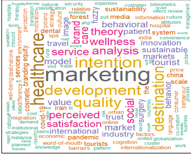
Şekil 2: Covid-19 Sonrası Kelime Bulutu Analizi (Tekil Kelime)

2020 yılı ve sonrasında yayınlanan akademik çalışmalarda en sık kullanılan anahtar kelimeler belirli oranda değişiklik göstermezken “Perceived”, “Social”, “Model”, “Behavioral” ve “Value” kavramları çalışmalarda sıklıkla kullanılan kelimeler olarak tabloya eklenmiştir.