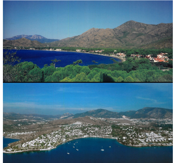
Şekil 4. Datça ve Bodrum Ak-Tur Yerleşmelerinin Tasarımında Gözetilen Bölgesel Doğal Çevre Değerleri

Gürsel’in belirttiği gibi, Datça ve Bodrum Tatil Siteleri’nin planlama aşamasında öngörülen turizm tesislerinin tümü ne yazık ki inşa edilmiştir. Her iki tatil sitesi de, özgün kullanım ve programlarında olan turizm ve konaklama işlevleriyle faaliyetlerini halen sürdürmektedir (Şekil 6). Şahıslara ait tekil mülklerde mekânsal ve mal-