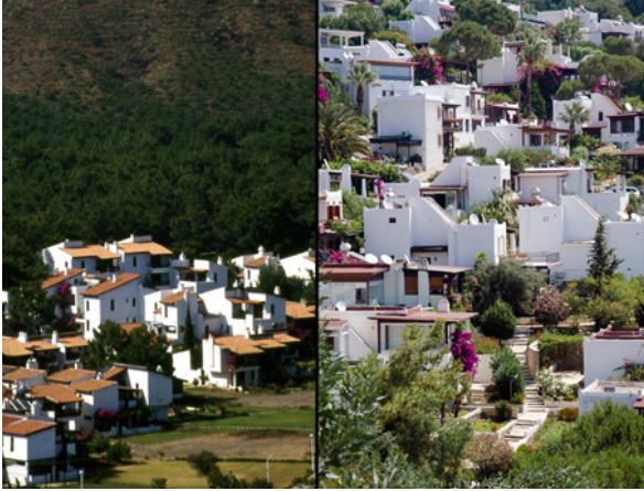
Şekil 5. Datça ve Bodrum Ak-Tur Yerleşmelerinde Topografyayla Bütünleşen ve Yerel Yapı Kültürünün Mekânsal ve Yapısal Öğelerinden İzler Taşıyan Konut Birimleri

zeme değişiklikleri yapılmış; ortak kullanıma ait bazı tesislere fiziksel müdahaleler yapılarak farklı işlevler yüklenmiş olsa da, iki tatil sitesinin özgün programlama, tasarım ve işletim prensipleri yerleşmeler bazında korunmaktadır (kişisel iletişim, 19 Ekim 2015).