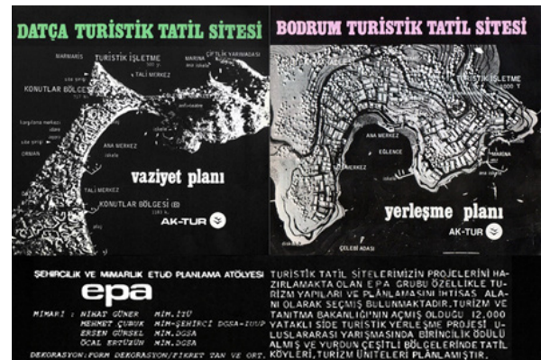
Şekil 3. Datça ve Bodrum Ak-Tur Turistik Tatil Sitesi Yerleşme Kararları ve Açıklamalarının Sunulduğu Broşürlerin Ön ve Arka Kapakları (Kaynak: EPA Mimarlık Arşivi 2021).

yaklaşımı sunan EPA Mimarlık Grubu kazanmıştır (Şekil 3). Tatil konutları yerleşme grupları ile otel, motel ve kampinglerden oluşan turistik işletmeler ve ortak hizmet (yönetim, ticaret, eğlence, bakım ve teknik hizmetler) tesislerinden oluşan iki yerleşmenin program, planlama ve organizasyon çalışmaları 1973 yılında tamamlanmıştır. Datça'da 75 hektarlık ve Bodrum'da 41 hektarlık arsa alanlarında, sırasıyla 187.500 m 2 'lik ve 82.000 m 2 'lik inşaat alanlarında, toplam 1825 tatil konutu ile 9500 yatak kapasiteli tasarlanan yerleşmelerin şantiye-genel inşaat çalışmaları-işletme tasarımları eşzamanlı geliştirilmiş ve yapımları 1976 yılında sona ermiştir.