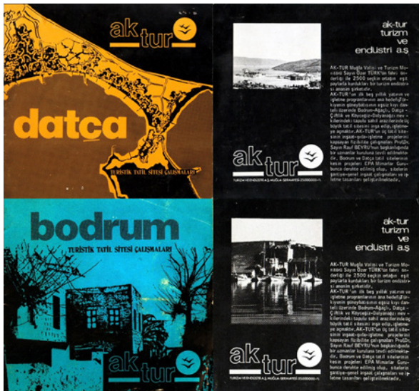
Şekil 1. Ak-Tur, Datça ve Bodrum Turistik Tatil Siteleri İçin Hazırlanan Katalogların Ön ve Arka Kapakları

Datça ve Bodrum'da planlanacak iki ayrı turizm-tatil yerleşmesi için düzenlenen davetli mimari proje yarışmasını, bütüncül bir tasarım