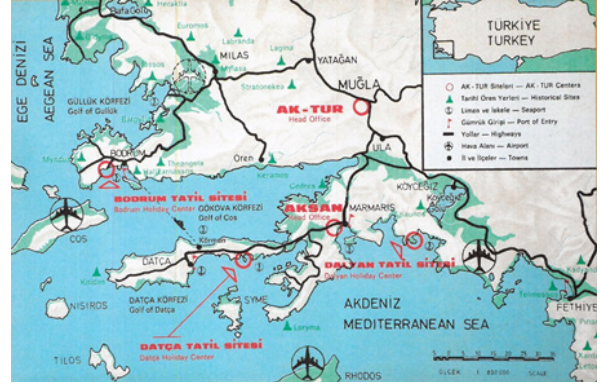
Şekil 2. AKSAN İşletmeleri'ni Tanıtan Broşürde Yer Alan, Bodrum ve Datça Ak-Tur Tatil Sitelerinin Konumunu Gösteren Harita

yaklaşımı sunan EPA Mimarlık Grubu kazanmıştır (Şekil 3). Tatil konutları yerleşme grupları ile otel, motel ve kampinglerden oluşan turistik işletmeler ve ortak hizmet (yönetim, ticaret, eğlence, bakım ve teknik hizmetler) tesislerinden oluşan iki yerleşmenin program, planlama ve organizasyon çalışmaları 1973 yılında tamamlanmıştır. Datça'da 75 hektarlık ve Bodrum'da 41 hektarlık arsa alanlarında, sırasıyla 187.500 m 2 'lik ve 82.000 m 2 'lik inşaat alanlarında, toplam 1825 tatil konutu ile 9500 yatak kapasiteli tasarlanan yerleşmelerin şantiye-genel inşaat çalışmaları-işletme tasarımları eşzamanlı geliştirilmiş ve yapımları 1976 yılında sona ermiştir.