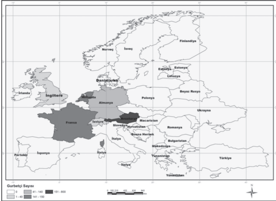
Harita 2. Niğde Akçaören Köyü'nden yurtdışına olan göçlerin ülkelere göre dağılımı

Akçaören Köyü'nden yurtdışına olan göçlerin hemen hemen tamamı Avrupa'ya olmuştur (Harita 2). Yurtdışına olan bu göçlerde Avusturya, yaklaşık 750-800 kişiyle ilk sırayı almaktadır. Bu ülkeyi sırasıyla Almanya (100-150 kişi), Hollanda (150 kişi), Fransa (150 kişi), İngiltere (25-40 kişi) ve İsviçre (35 kişi) izlemektedir (Tablo 5). Toplamda köyün 1210-1325 civarı bir nüfusunun Avrupa'da yaşadığı belirlenmiştir. Ancak köyden dışarıya olan göçler bunlarla sınırlı olmayıp, ülkemiz içerisine de köyden bazı göçler olmuştur. Yurtiçi bu göçlerde, İstanbul ilk sırada gelmektedir. Bu büyükşehri sırasıyla Bor, Niğde, İzmir, Ankara, Aksaray ve Bursa şehirleri izlemektedir. İstanbul'da yaklaşık 800 kişi, Bor ve Niğde şehirlerinde yaklaşık 100 kişi; İzmir'de 8 hane, Ankara'da 4-5 hane, Bursa'da 2 hane olduğu mülakatlarca belirlenmiştir.