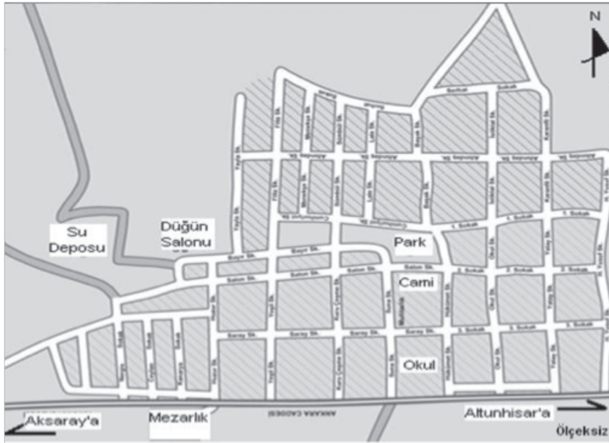
Şekil 1. Kırsal kesim için herhangi bir planlama kararı olmamasına rağmen, Akçaören sakinleri köy konutlarını da şehirselleştirilmiş bir düzen içerisinde inşa etmeyi başarmıştır.

Akçaören Köyü'nün sürekli göç vermesi, yerleşmenin idari bakımdan halen köy statüsünde kalmasına neden olmuştur; fakat köyün etrafındaki belediye örgütlü yerleşmelerde gurbetçi köyünde görülen modern konutlar, asfalt ve parke taşlı yollar ve düzgün peyzajlı sokaklar görülememektedir. Başka bir ifadeyle, çevre yerleşmeler nüfus ve idari anlamda öne çıksa da gurbetçi köyü, modern görünümü ve planlılığı ile (Şekil 1) geri kalmışlığını kapatmaya çalışmaktadır (Fotoğraf 3).