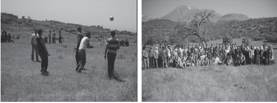
Fotoğraf 4. Akçaören Köyü Yaylası'nda temmuz ayında gurbetçiler geleneksel piknik etkinliği ile yazın bir araya gelmektedir

Yaz aylarında özel araçları ile köye gelen gurbetçi aileler, köy havasını solumakta; akrabalarını, komşularını, köyün geride kalmış yaşlılarını ziyaret etmekte, ayrıca mayıs-temmuz ayları arasında köyün yaylasına çıkarak piknik, gezi, dağ yürüyüşü gibi Avrupa'da favori olan rekreasyon faaliyetlerde bulunmaktadır. Yapılan bu aktiviteler sonucu Avrupa'dan ve ülkemizin diğer şehirlerinden gelen köyün gurbetçi gençleri bir araya gelmekte; gençler bu aktivitelerle kültürel kaynaşma fırsatı elde edebilmektedir (Fotoğraf 4).