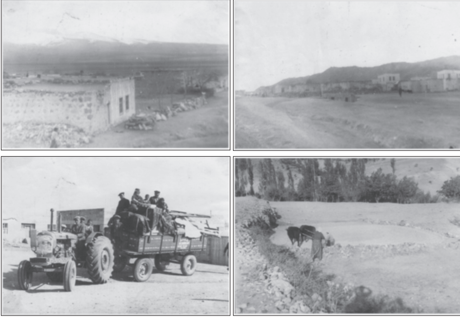
Fotoğraf 2: Avrupa'ya 1962 yılında göç vermeye başlayan Akçaören Köyü'nün 1969 Yılı Görünümleri

Akçaören Köyü muhtarı başta olmak üzere, yaptığımız mülakat sonuçlarına göre, köyde toplam 440-445 konut bulunmaktadır (Tablo 6). Bu konutların 140-145 kadarı yılın tamamında kullanılmakta, 175 tanesi dönemlik olarak yaz aylarında Avrupa'dan gelen gurbetçiler tarafından kullanılmakta, 125 kadarı ise yılın tamamında boş kalmaktadır. Yılın tamamında boş kalan bu konutların sahiplerini Bor, Niğde ve diğer şehirlere göç etmiş aileler oluşturmaktadır.