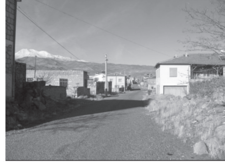
Fotoğraf 3. Eski meskenler ile çok katlı modern konutlar tezat oluşturacak şekilde köy içerisinde bir arada görülebilmektedir. Ayrıca birçok ilçede bile rastlayamadığımız parke taşı ve asfalt yollar, düzgün peyzajlı yeşil alanlar Akçaören Köyü'nde görülmektedir.