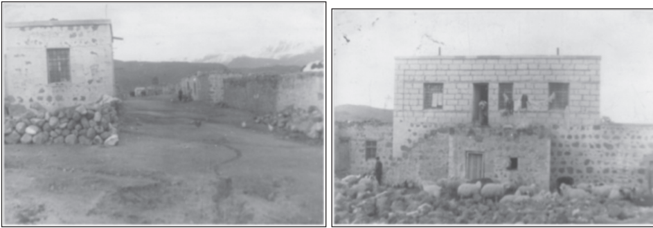
Fotoğraf 2: Avrupa’ya 1962 yılında göç vermeye başlayan Akçaören Köyü’nün 1969 Yılı Görünümleri

Akçaören Köyü’nün çevreden toplanan taş malzemeler ile yapılmış, toprak örtülü düz damlı geleneksel mesken tipleri ve zirai geçim tarzı (Fotoğraf 2), bugün yerini büyük ölçüde modern konutlara ve döviz kaynaklı ekonomiye bırakmış bir durumdadır. Yapılan bu konutlar, modern yapı malzemeleri ile günümüz mesken planları tarzında genelde iki katlı olarak inşa edilmiştir. Modern meskenlerin iç mimarisinin alafranga klozet, jakuzili banyo tarzında yaptırılmış olması, Avrupa kültürünün kırsal yerleşme üzerindeki bir yansıması olarak karşımıza çıkmaktadır. Meskenlerin dış mimarisine baktığımızda ise, çatıların kırmızı kiremit ile genelde dört yana meyilli olduğu, yaz gecelerinde oturmak için teras şeklinde geniş balkonların yapılmış olduğu görülmektedir. Alt kat; garaj, depo, erzak odası gibi farklı amaçlar için kullanılmaya, üst katın ise genelde oturmaya ayrıldığı görülmektedir.