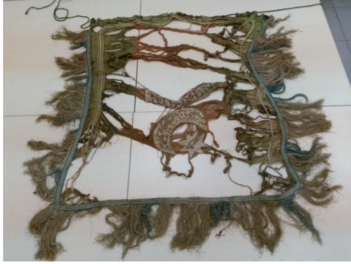
Görsel 6. Onarım Öncesi Alemlı Sancağı

Sancağın yazılı işlemelerinden Ay-yıldız içindeki kitabe ve Kelime-i Tevhid tam kalmış, diğerlerinden birçok harfi dağılmıştır. Ayrıca Ay-yıldız kumaşı ve atkı ipliklerinde lekeler oluşmuştur. Kenar süslemesi olarak tutturulan, çarpana dokumanın atkısı olan saçakların bir kısmı kesilerek yok edilmiştir. Kir katmanları nem ve ısınnın etkisiyle liflerin derinliklerine nüfuz etmiştir.