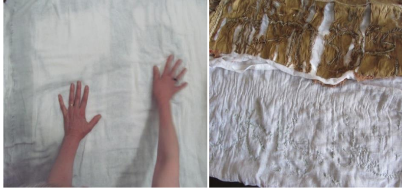
Görsel 10. Kurutma İşlemleri