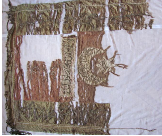
Grsel 8. Sancakın Tlbent Astar zerine Geici Teyel Dikişle Tutturulması ve Temizlik İřlemlerine Hazırlanmış Hali

Islak temizlik uygulamaları; kuru temizlik işlemleri yeterli olmadığından dolayı hassas bir ıslak temizlik yapılmasının uygun olduğu düşünlmştr. Naylondan bir yıkama teknesi kurulmuştur. Eser naylonun zerine yerleřtirilmiř ve eserin zerini geecek řekilde 30°C saf su doldurulmuştur. Sancak ok kirli durumda olduėundan dolayı % 3 oranında noniyonik deterjan kullanımına gerek duyulmuştur. Eser banyoda 15 dakika bekletildi ve yumuřak ulu fıralar ile derinliklerdeki kiri ıkartmak iin hafife tampon yapılmıřtır. İkinici ve nc banyolarda sadece durulama iřlemi yapılmıř deterjan kullanılmamıřtır. Her banyoda eser 10 dakika bekletilmiřtir. Islak temizlik iřlemi ile eserin elastikiyet oranı arttırıldı, asit kusturuldu, kırıřıklık giderilmeye alıřıldı ve renkler parlaklařtırılmıřtır.