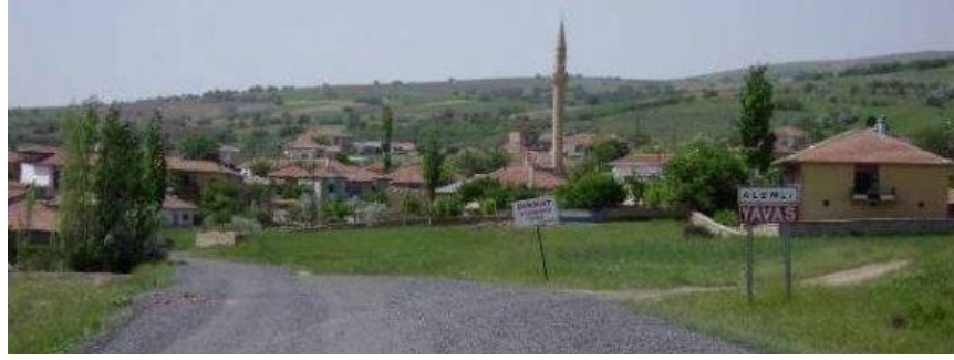
Grsel 1. Alemlı Köy Manzarası

Nevşehir merkezine 33 km ve Glşehir ilçe merkezine 17 km mesafede olan Alemlı köyü 76 hane olup, nüfusu kışın azalsa da yazın köye dönmektedir. Yıllar önce yurt dışına göç etmiş ve gurbetçi olarak orada iş imkânı bulmuş olan oldukça fazla sayıda insan olduğundan da bahsetmek gerekir. Köyde kalan insanlar tarım ve hayvancılıkla uğraşır. Köyde buęday ve arpanın yanı sıra, şeker pancarı, bakla, nohut, çavdar, fasulye ve mercimek gibi ürünler yetiştięi bilinmektedir. Nevşehir'in pek çok yöresinde olduğu gibi, patates ve üzüm de Alemlı köyü ve çevresinde yetişen önemli ürünlerdendir (URL 3).