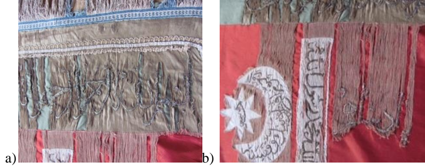
Grsel 12. a) Kalıcı Destek Kumařa Tutturulan Sancaktan Detay Grnt b)Dađılıř Haldeki İřlemelerin Sađlamlařtırılması

Rekonstrksiyon iřlemi tamamlanan sancak Vali huzurunda Nevřehir Mzesi'ne teslim edilmiřtir.