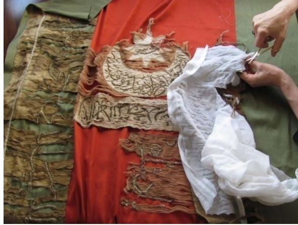
Görsel 11. Geçici Astardan Kesilerek Alınan Yazılı İşlemelerin Kalıcı Destek Kumaşa Tuturulması

Sancağın ipek atlas kumaşına en yakın kumaş türü araştırılarak yerel dokuma İpek Canfes kumaşı destek kumaş olarak tercih edilmiştir. Eserin orijinal renk tonları net olarak belirlenemediğinden dolayı destek kumaş boyanmamış, tespit edilen orijinal al-kırmızı ve yeşil renkleri uygun görülmüştür.