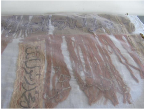
Görsel 3.Sancağın tülbent astar üzerine, geçici teyel dikişle tutturularak tümelenmesi

Belgeleme süreci sancağa ilişkin kimlik bilgilerin tespiti ile başlamıştır. Yazılı işlemler dağıldığından dolayı dağılan detayların yerine konulması ve okunması için geçici bir tülbent astara, yine geçici bir tutturma tekniği ile eserin elde kalan kısımları görünür hale getirildi. (Görsel 3). Bu aşamadan sonra eserdeki yazılı bezeme ve kitabenin en küçük detayına dikkat ederek yekpare bir şeffaf naylon üzerine tükenmez kalemle kopyası alındı. Bu kopya üzerinden, yine yekpare aydınlar üzerine, temiz çizimi yapıldı (Görsel 4).