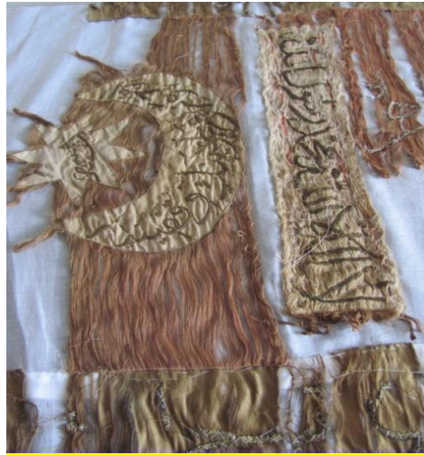
Görsel 7. Eserin Detay Görüntüleri ve Temizleme Öncesi Geçici Astar Tülbent Kumaşa Tuturulması

Mekanik temizlik uygulamaları; kuru temizlik işlemleridir. Eser pamuklu bez (tülbent astar) üzerine serilmiş, kopmuş atkı iplikleri düz konuma getirilmiş ve geçici teyel dikişle tutturularak tümlenmiştir. İlk müdahale eserin tozlardan arındırılmasıdır. Yumuşak uçlu fırçalar ile eser üzerindeki tozlar giderilmeye çalışılmıştır. Fırçalar sık sık yıkanmış ve pamuklu bez üzerinde tozlar biriktikçe kirden arındırılmıştır. Eser kopmuş halde olduğu için vakumlama işlemi uygun görülmemiştir.