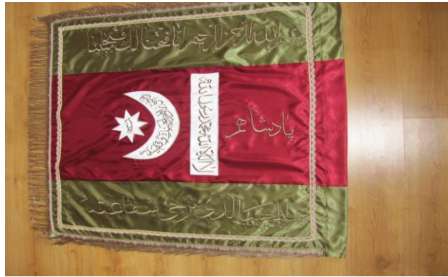
Grsel 14. Alemlı Ky Muhtarlıđına Teslim Edilen Reprodksiyon alıřması