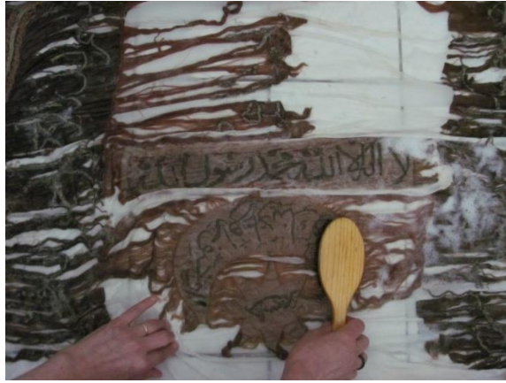
Grsel 9. Islak Temizlik Sreci

Islak temizlik uygulamaları; kuru temizlik işlemleri yeterli olmadığından dolayı hassas bir ıslak temizlik yapılmasının uygun olduğu düşünlmştr. Naylondan bir yıkama teknesi kurulmuştur. Eser naylonun zerine yerleřtirilmiř ve eserin zerini geecek řekilde 30°C saf su doldurulmuştur. Sancak ok kirli durumda olduėundan dolayı % 3 oranında noniyonik deterjan kullanımına gerek duyulmuştur. Eser banyoda 15 dakika bekletildi ve yumuřak ulu fıralar ile derinliklerdeki kiri ıkartmak iin hafife tampon yapılmıřtır. İkinici ve nc banyolarda sadece durulama iřlemi yapılmıř deterjan kullanılmamıřtır. Her banyoda eser 10 dakika bekletilmiřtir. Islak temizlik iřlemi ile eserin elastikiyet oranı arttırıldı, asit kusturuldu, kırıřıklık giderilmeye alıřıldı ve renkler parlaklařtırılmıřtır.