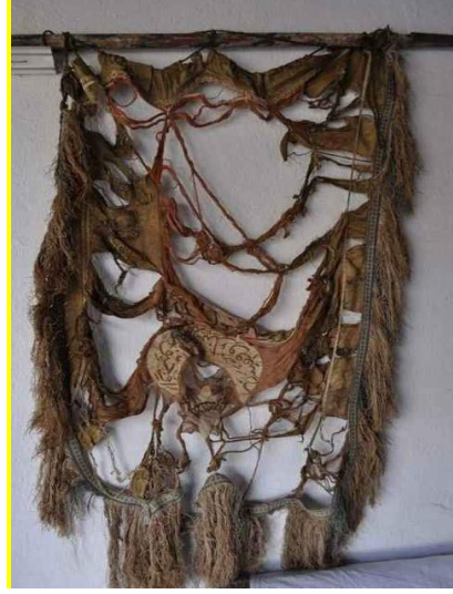
Görsel 2. Sancağın Onarım Öncesi Hali (URL 4)

Çalışmanın konusu Nevşehir ili Gülşehir ilçesi Alemlî köyüne bağlı Alemlî sancağının kimlik/dönem bilgilerinin tespit edilmesi ve esere müze statüsü kazandırılmasıdır. Çalışma kapsamında ağır hasarlı sancağa ilişkin bilgiler, esere yönelik uygulanan tekstil koruma, onarım yaklaşım ve süreçleri ile görsel belgeleme çalışmaları ele alınmıştır. Eserde tespit edilen bozulmalar doğrultusunda kullanılacak malzeme ve müdahale yöntemine karar verilmiştir.