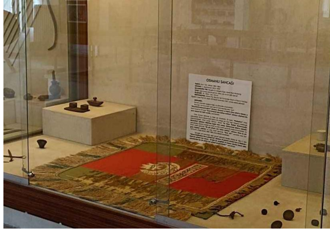
Grsel 13. Rekonstrksiyon iřlemi tamamlanan ve Nevřehir Mzesi'nde sergilenen Alemlı Sancađı Tıpkı retim (reprodksiyon) alıřması da yapılarak Alemlı Ky Muhtarlıđına verilmiřtir.

Rekonstrksiyon iřlemi tamamlanan sancak Vali huzurunda Nevřehir Mzesi'ne teslim edilmiřtir.