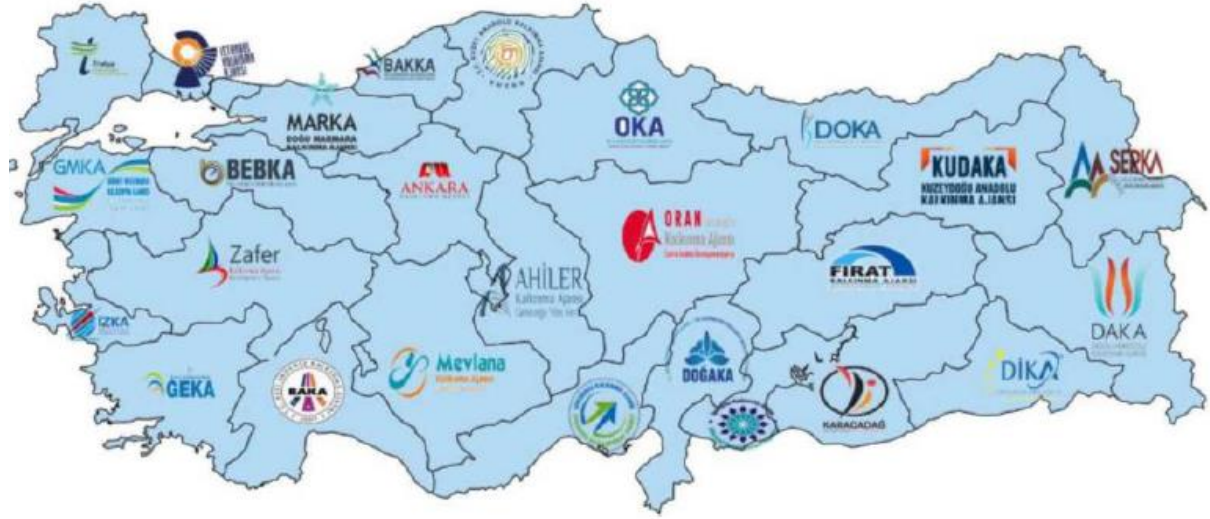
Şekil 1: Türkiye’de Kalkınma Ajansları