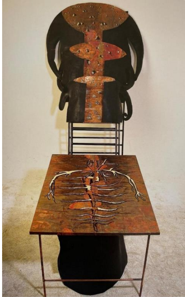
Görsel 1. İnci Eviner, Derisiz (Skinless), Bakır, Deri, Akrilik, Deđişebilir Boyutlarda, 1996. Kaynak: (Raza, 2016, s. 180)

simgeleri, saf doğayı ifade etmek için kullanılmıştır. Orta da yer alan bölümde ise insan portrelerine yer verilmiştir. Portrelerin arkasında gölge şeklinde hayvan betimlemeleri yer almaktadır. Dađınık bir düzenlemeye sahip olan bu betimlemeler, insanın doğada var olma çabalarını ve bu çabalarında barındırdıkları hayvan içgüdüsünün bir yansımasıdır. Yerleştirmenin önde bulunan bölümünde bu defa bakır üzerine çeşitli yapılar resmedilmiştir. Bu yapıların bir bölümü kırsal kesimlerde yer alan konutların, bir bölümünde ise kentlerde yer alan çok katlı yapıların göstergeleridir. Bu eserde her iki yaşam alanındaki insanların buldukları yerlerde maruz kaldıkları sınırlandırmaları temsil eden imgeler kullanılmıştır. Bu imgelerden bazıları, konutların bacasından çıkan aslında duman gibi görünen fakat detayda portre barındıran, bir kısmında da yapılarda özgürlüğü çağrıştıran kanat betimlemelerine yer verilmiştir. Ayrıca çalışmadaki bazı konutlar, sıkışmışlıktan kurtulamayan insanları temsilen resmedilmiştir. Sanatçı çalışmasında, yapıların dışında, herhangi bir yere çıkmayan merdiven ve yol gibi imgelere de yer vermiştir. Kompozisyonun ön bölümünde yer alan dört ayak üzerine yatay şekilde yerleştirilmiş bakır levhaya, akrilik boya ile insan iskeletini andıran betimlemeler yapılmıştır. Özellikle omurga ve midenin ön planda olduđu bu betimlemede bedeni kaplayan ten yer almamaktadır. Bu durum bireyin kimliksiz kalmış izlenimini vermektedir.