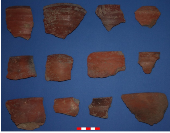
Resim 19: Çakıcı Köyü Harmanyeri Höyük çanak-çömlek parçaları