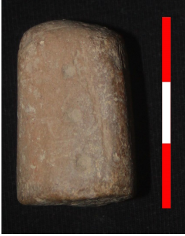
Resim 39: Dikici Köyü Hüyük Mevkii oyun taşı 2013 Env. No.10