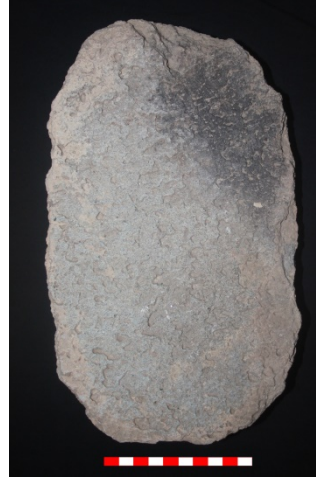
Resim 40: Dikici Köyü Hüyük Mevkii ezgi taşı 2013 Env. No.11