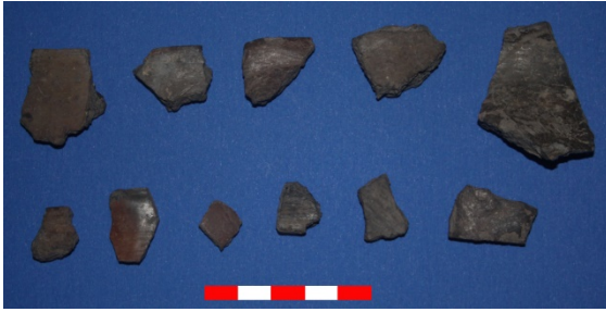
Resim 11: Yüksel Köyü Hüyük Mevkii çanak- çömlek parçaları