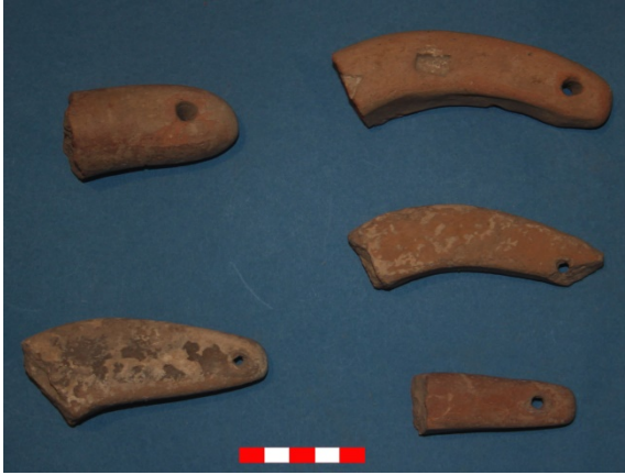
Resim 27: Dikici Köyü Hüyük Mevkii ağırşak parçaları