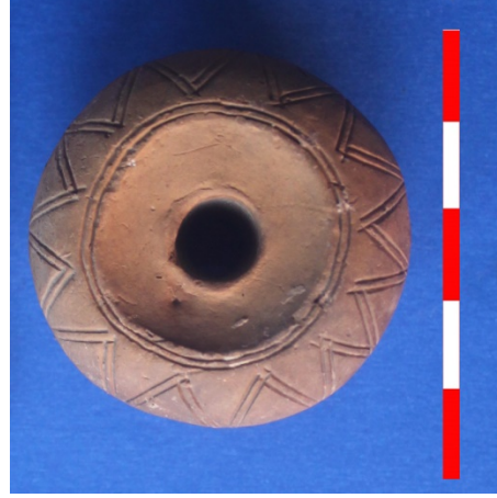
Resim 34: Dikici Köyü Hüyük Mevkii ip iği ağırlığı 2013 Env. No.5