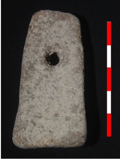
Resim 33: Tuğaylı Köyü Köyaltı Hüyük Mevkii ağırşak 2013 Env. No.4