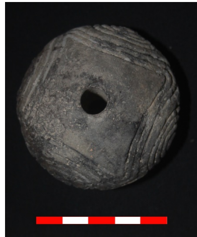
Resim 30: Sütlaç Köyü Kuyubaşı Hüyük ip iği ağırlığı 2013 Env. No.1