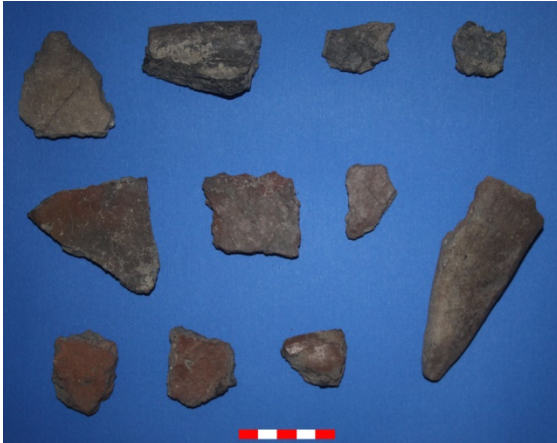
Resim 15: Yüksel Köyü Hüyük Mevkii çanak-çömlek parçaları