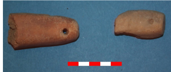
Resim 28: Kabaklı Köyü Hüyük Mevkii ağırşak parçaları