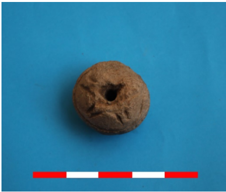
Resim 47: Tugaylı Köyü Köyaltı Mevkii ip iği 2016 Env. No.20