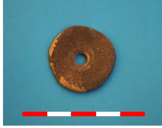
Resim 44: Sütlaç Köyü Kuyubaşı Hüyük buluntusu 2016 Env. No.17