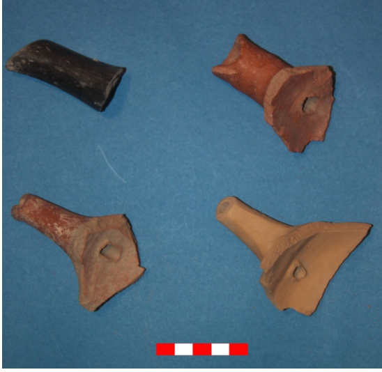
Resim 25: Dikici Köyü Hüyük Mevkii akıtacak parçaları