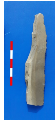
Resim 49: Tugaylı Köyü Köyaltı Mevkii sileks bıçak 2016 Env. No.21