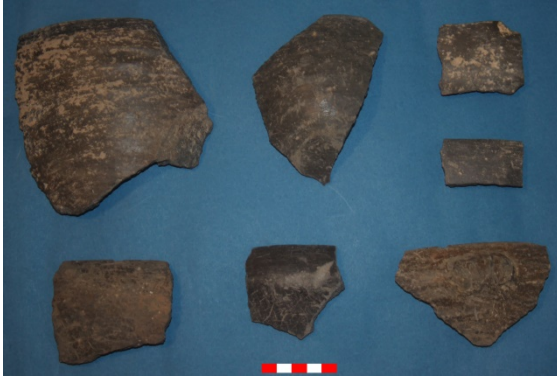
Resim 13: Sütlaç Köyü Kuyubaşı Hüyük çanak-çömlek parçaları