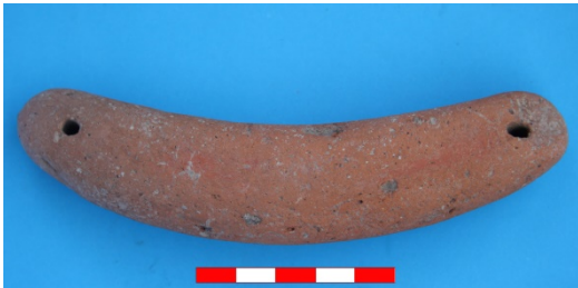
Resim 41: Dikici Köyü Hüyük Mevkii ağırşak 2016 Env. No.12