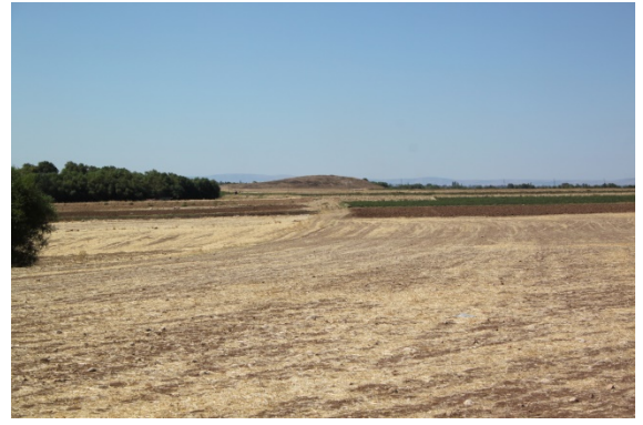
Resim 6: Kabaklı Köyü Hüyük Mevkii