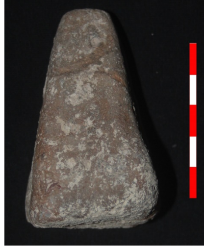
Resim 32: Yüksel Köyü Hüyük Mevkii ağırşak 2013 Env. No.3