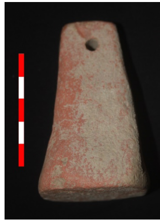
Resim 36: Dikici Köyü Hüyük Mevkii ağırşak 2013 Env. No.7