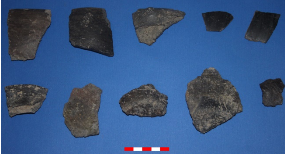
Resim 21: Yeşilhöyük Köyü Bozhöyük (Yeşilhöyük) çanak-çömlek parçaları