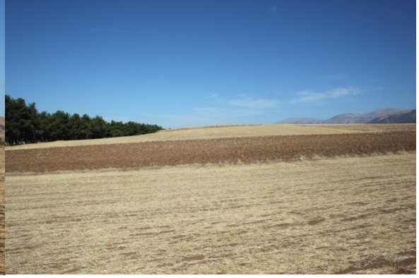
Resim 8: Kabaklı Köyü Kocakır Mevkii