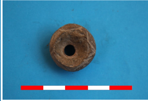
Resim 46: Duman Köyü Safiye Mevkii ip iği ağırlığı 2016 Env. No.19