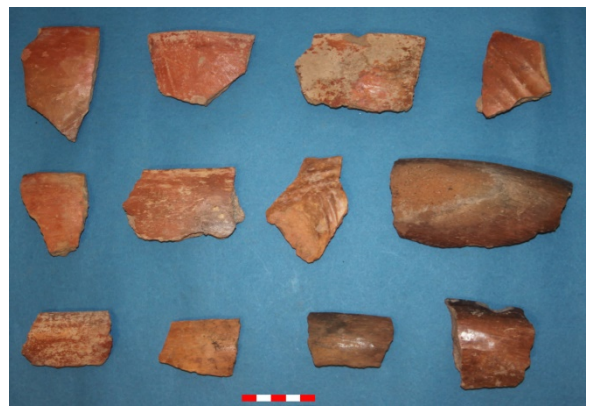
Resim 18: Tugaylı Köyü Köyaltı Hüyük Mevkii çanak-çömlek parçaları