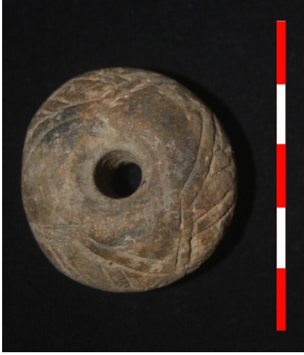
Resim 31: Kabaklı Köyü Hüyük Mevkii ip iği ağırlığı 2013 Env. No.2