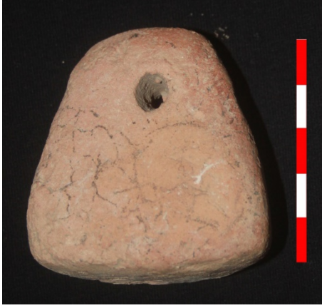
Resim 37: Dikici Köyü Hüyük Mevkii ağırşak 2013 Env. No.8