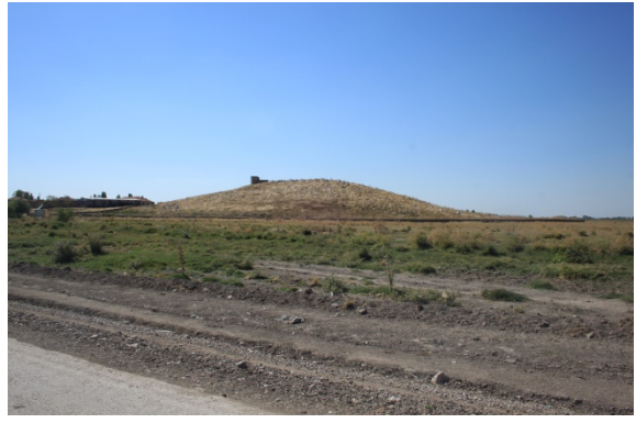
Resim 10: Yeşilhöyük Köyü Bozhöyük (Yeşilhöyük)