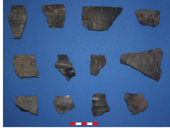
Resim 20: Yeşilhöyük Köyü Bozhöyük (Yeşilhöyük) çanak-çömlek parçaları