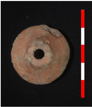
Resim 35: Dikici Köyü Hüyük Mevkii ip iği ağırlığı 2013 Env. No.6