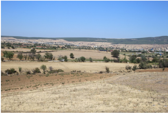
Resim 5: Dikici Köyü Hüyük Mevkii