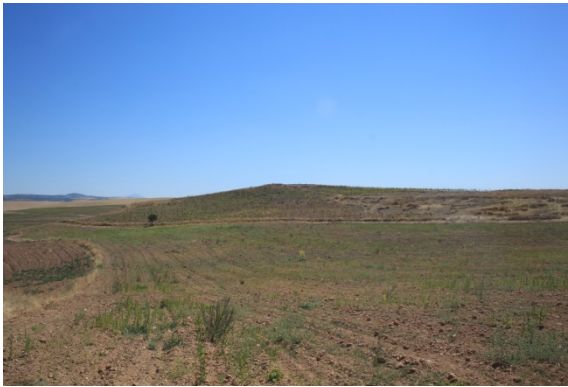
Resim 3: Sütlaç Köyü Kuyubaşı Hüyük