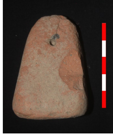
Resim 38: Dikici Köyü Hüyük Mevkii ağırşak 2013 Env. No.9