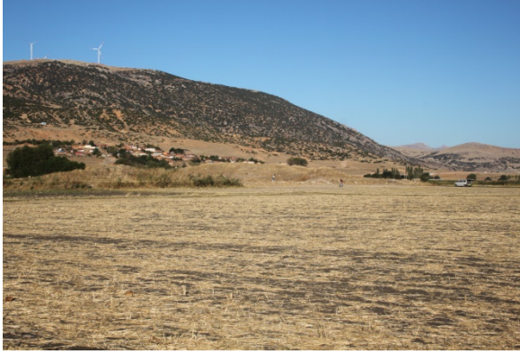
Resim 7: Tugaylı Köyü Köyaltı Hüyük Mevkii