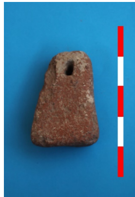
Resim 48: Tugaylı Köyü Köyaltı Mevkii ağırşak 2016 Env. No.21