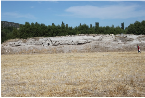
Resim 9: Çakıcı Köyü Harmanyeri Höyük