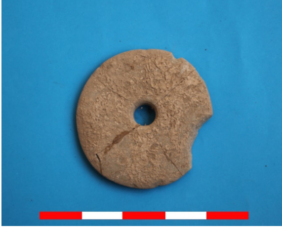
Resim 45: Sütlaç Köyü Kuyubaşı Hüyük buluntusu 2016 Env. No.18