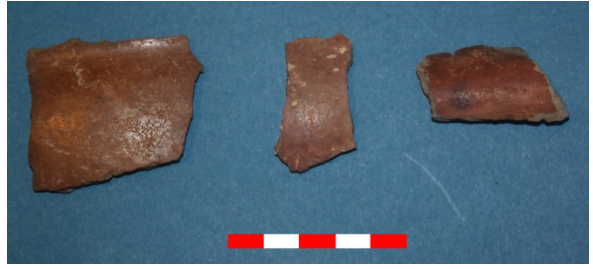
Resim 12: Sütlaç Köyü Kuyubaşı Hüyük çanak-çömlek parçaları