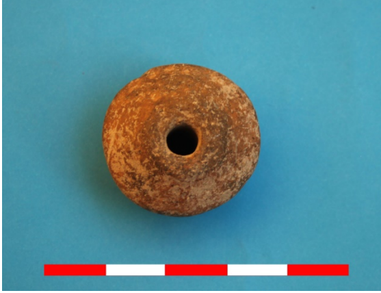
Resim 43: Sütlaç Köyü Kuyubaşı Hüyük ip iği ağırlığı 2016 Env. No.16