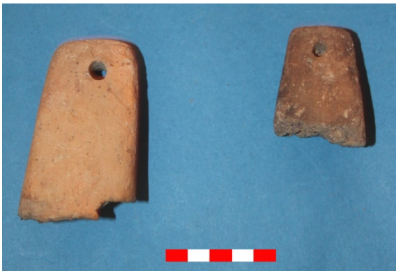
Resim 29: Kabaklı Köyü Hüyük Mevkii ağırşakları