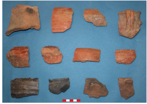
Resim 16: Dikici Köyü Hüyük Mevkii çanak-çömlek parçaları