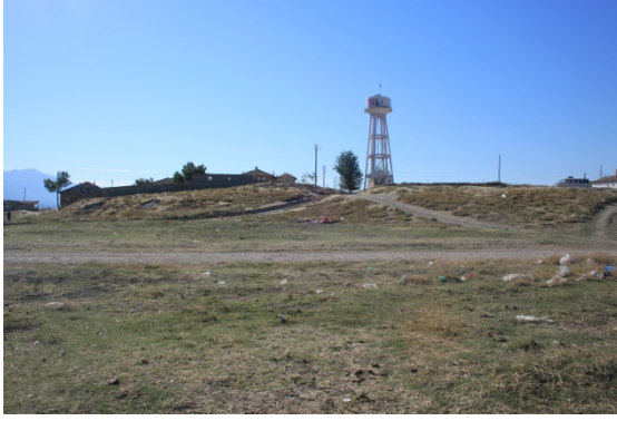
Resim 1: Duman Köyü Yokuş Mahallesi yerleşmesi