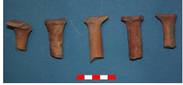
Resim 26: Dikici Köyü Hüyük Mevkii yüksek kaide parçaları