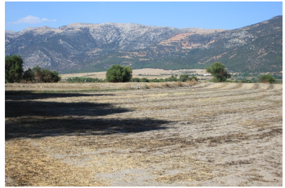
Resim 4: Yüksel Köyü Hüyük Mevkii