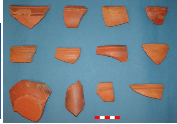
Resim 22: Kabaklı Köyü Hüyük Mevkii çanak-çömlek parçaları