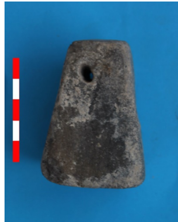
Resim 42: Yüksel Hüyük Mevkii ağırşak 2016 Env. No.15