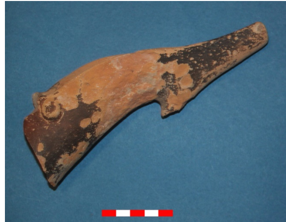
Resim 24: Dikici Köyü Hüyük Mevkii gaga ağızlı testi parçası