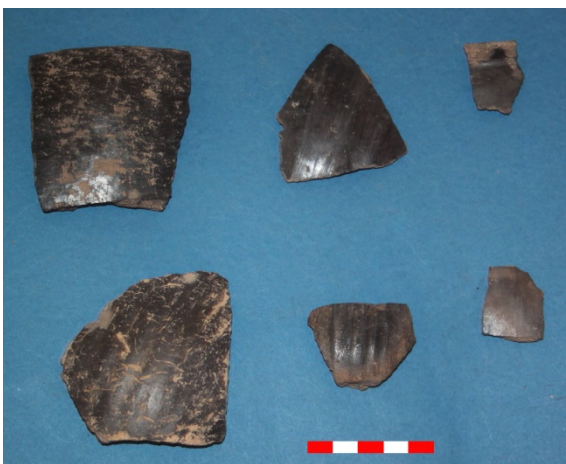
Resim 17: Tugaylı Köyü Köyaltı Hüyük Mevkii çanak-çömlek parçaları