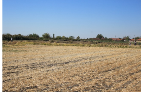
Resim 2: Duman Köyü Safiye Mevkii