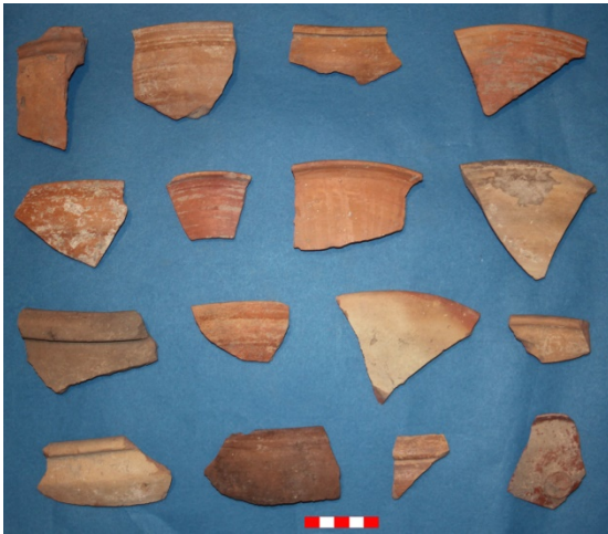
Resim 23: Dikici Köyü Hüyük Mevkii çanak-çömlek parçaları