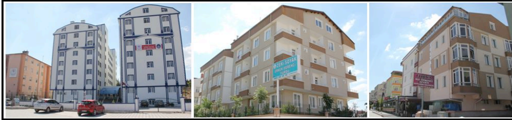
Foto 1. Nevşehir'de öğrencilerin barındığı kamu ve özel sektöre ait yurtlar ile apartlardan görünümeler.

Nevşehir Hacı Bektaş Veli Üniversitesi hızla büyüyen bir üniversitedir. Aynı zamanda öğrenci sayısı da hızla artmaktadır. Dolayısıyla barınma, üniversite öğrencilerinin karşılaştığı temel sorunların başında gelmektedir. Öğrenciler kamu ve özel sektöre ait yurtlarda, apartlarda, öğrenci evlerinde, ailesinin yada akrabalarının yanında kalmaktadır (Foto 1). Filiz ve Çemrek, (2007)'ye göre barınma biçimlerinin seçilmesinde, öğrencinin kendisinin ve ailesinin sosyo-ekonomik durumu, üniversite öğrenimi için bulunduğu şehirde barınma amacıyla yapılan konut veya binaların kapasitesi, ulaşım ve sosyal imkanlar gibi birçok faktör etkili olmaktadır (Filiz ve Çemrek, 2007). Nevşehir'de ise ikâmet eden öğrencilerin büyük bir bölümü kiraladıkları öğrenci evlerinde kalmaktadır. Apartlarda, özel yurtlarda ve devlet yurtlarında kalan öğrencilerin sayısı da oldukça fazladır. Öğrencilerin en az tercih ettiği barınma şekli ise aile ve akrabalarının yanında yaşamaktır. Çalışmada elde edilen bu bulgular, Yavuzer ve Kahraman, (2014)'ün ulaştığı sonuçlar ile paralellik göstermektedir.