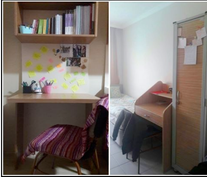
Foto 3. Öğrencilerin hayata bakışını ve ruh halini yansıtanobjelerin yer aldığı odalardan görünümeler.

“Dağınık biriyim. Nereye, ne koyduğumu bilmiyorum. O yüzden en iyisi hiç eşya olmaması” (Ahmet, İktisadi ve İdari Bilimler Fakültesi, 4. Sınıf).