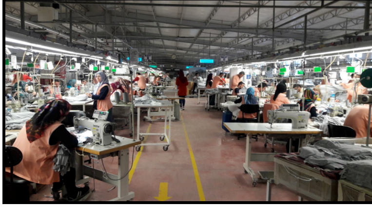
Foto 1. Aster Tekstil Fabrikası'nda çalışan kadın işçiler