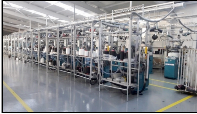
Foto 3. Çorap üretimi yapan Safa Tekstil'in Üretim Bantları