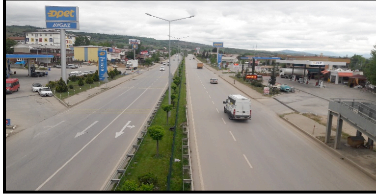
Foto 2. Yöredeki En Önemli Ulaşım Hattı Olan D-100 Karayolu