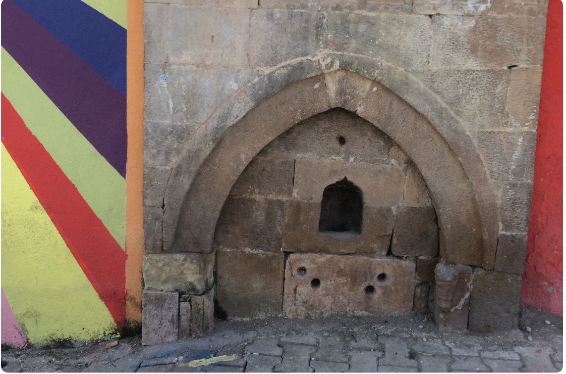
Resim 1. İskender Paşa Camii'nin Olduğu Sokaktaki Çeşme