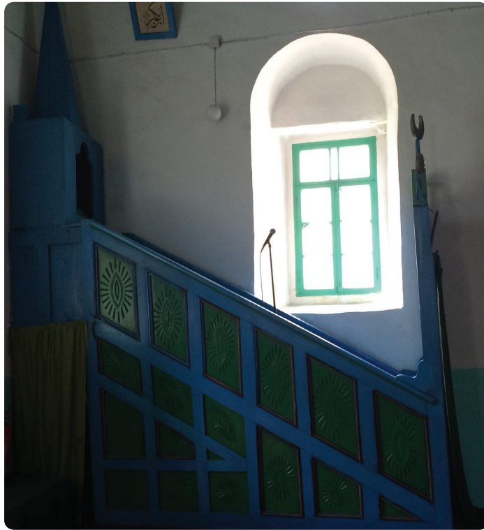
Resim 6. İskender Paşa Camii Minberi