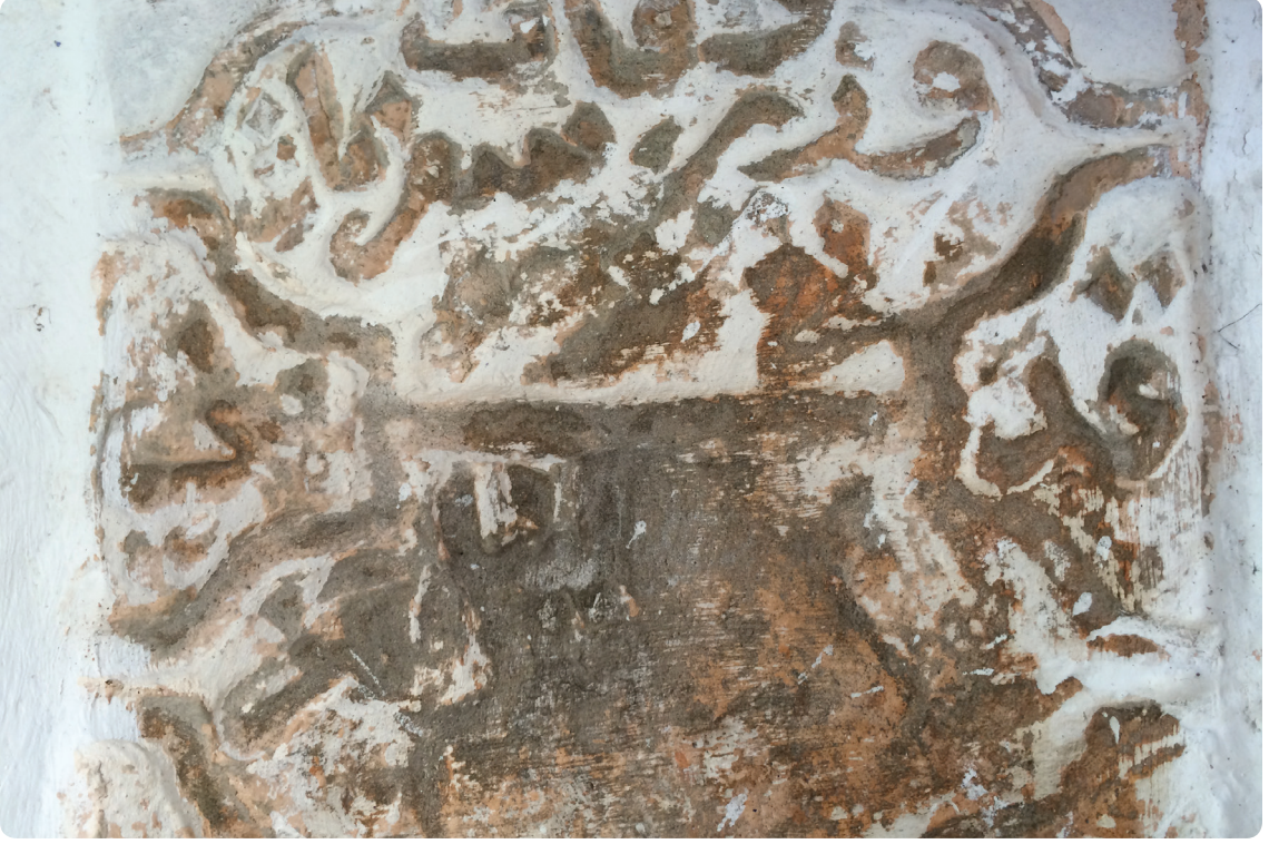
Resim 5. Vefat-ı Vezir Sefer Paşa Yazan Kitabı