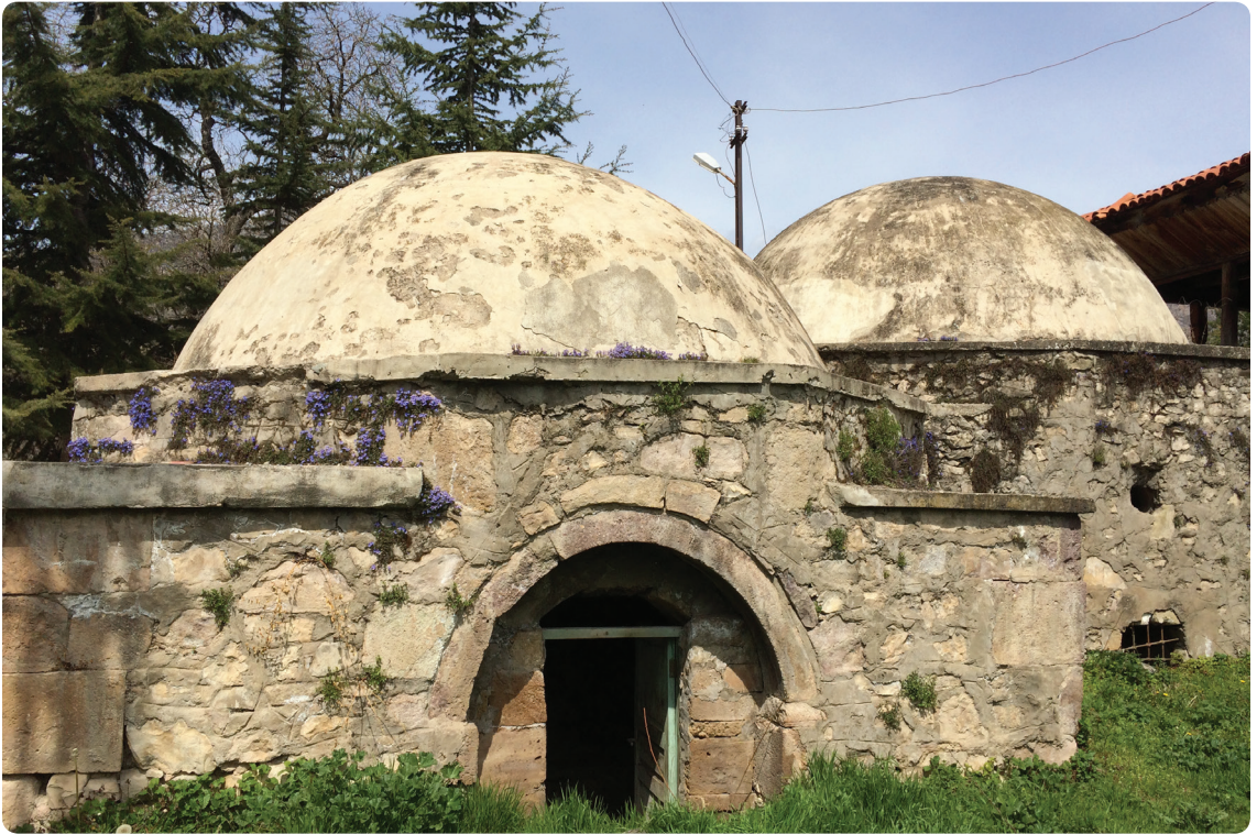
Resim 8. Sefer Paşa Türbesi ve Hatice Hanım Türbesi 31