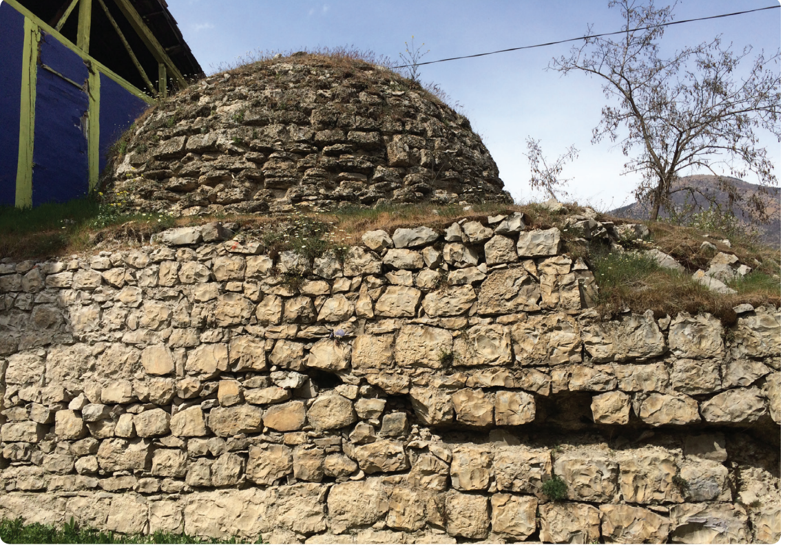
Resim 3. İskender Paşa Camii'nin Olduğu Sokaktaki Hamam