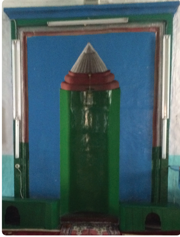
Resim 7. İskender Paşa Camii Mihrabı