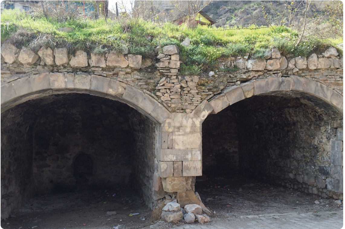
Resim 2. İskender Paşa Camii'nin Olduğu Sokaktaki Dükkanlar