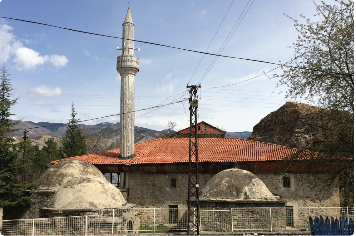
Resim 4. İskender Paşa Camii ve Türbeler