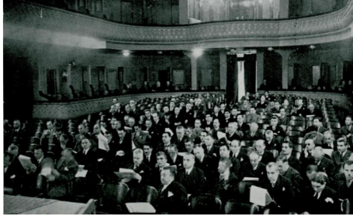
Belediyeler Dergisi , Yıl 1, Özel Sayı (1936), 13.

Ek-2 Kongre müzakereleri esnasında çekilmiş bir fotoğraf.