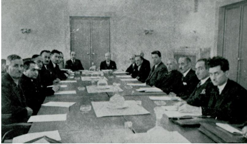
Belediyeler Dergisi, Yıl 1, Özel Sayı (1936), 24-25.