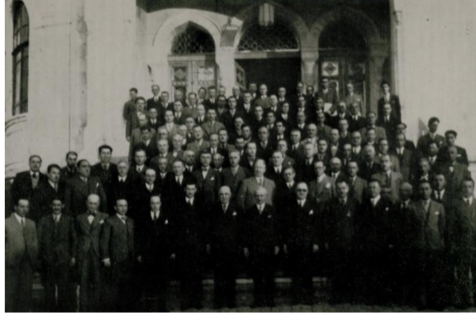
"Uraylar Kurultayı", Belediyeler Dergisi , Özel Sayı (1936), (kapak fotoğrafı).

Ek-1 Belediyeler Kongresi'nin aile fotoğrafı.