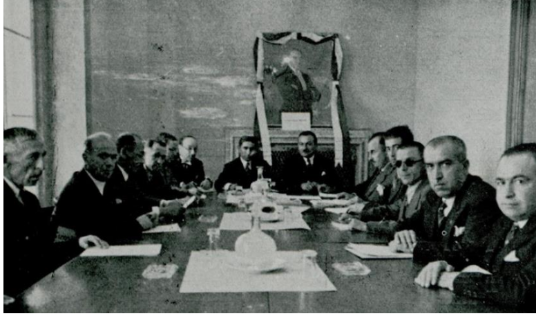
Ek-3 Komisyonlar toplantı halinde.