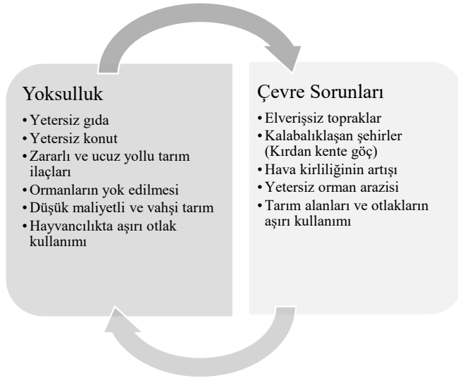
Şekil 3. Yoksulluk ve çevre sorunları çift yönlü ilişkisi

Görüldüğü üzere çevresel tehlikelerden orantısız bir şekilde zarar görenler en yoksullardır. Burada kastedilen yoksulluk ile çevre arasında birbirlerini etkileyen çift yönlü ve verimsiz bir ilişkiden bahsetmenin mümkün olduğudur. Yeşil sosyal politika, yoksulluk ve çevre sorunları arasındaki bağlantıyı