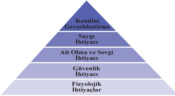
Tablo 1: Maslow'un İhtiyaçlar Hiyerarşisi Kuramı

halindeki bir piramit şeklinde ortaya koymuştur. Maslow bu basamaklara gereksinimleri yerleştirirken öncelik sırasına dikkate ederek bir ihtiyaçlar hiyerarşisi oluşturmuştur. İnsanın ihtiyaçlarını başta fizyolojik gereksinimler olmak üzere ele alan Maslow diğer ihtiyaçların da bunların öncelikli olarak giderilmesinden sonra eksikliklerinin hissedilmeye başladığını ve organizmayı etki altına aldıklarını görelî bir hiyerarşi sistemiyle açıklamaktadır. Bu basamakları oluşturan gereksinimler sırasıyla fizyolojik, güvenlik, ait olma ve sevgi, saygı ve kendini gerçekleştirme ihtiyaçlarından meydana gelmektedir. Maslow'un 1954 senesinde klinik gözlemlerinden yola çıkarak ortaya koymuş olduğu bu yaklaşım günümüze kadar yoğun bir ilgiyle gelmiştir. Maslow'un ihtiyaçları sınıflandırdığı piramit tablo 1'de görüldüğü gibidir. 22