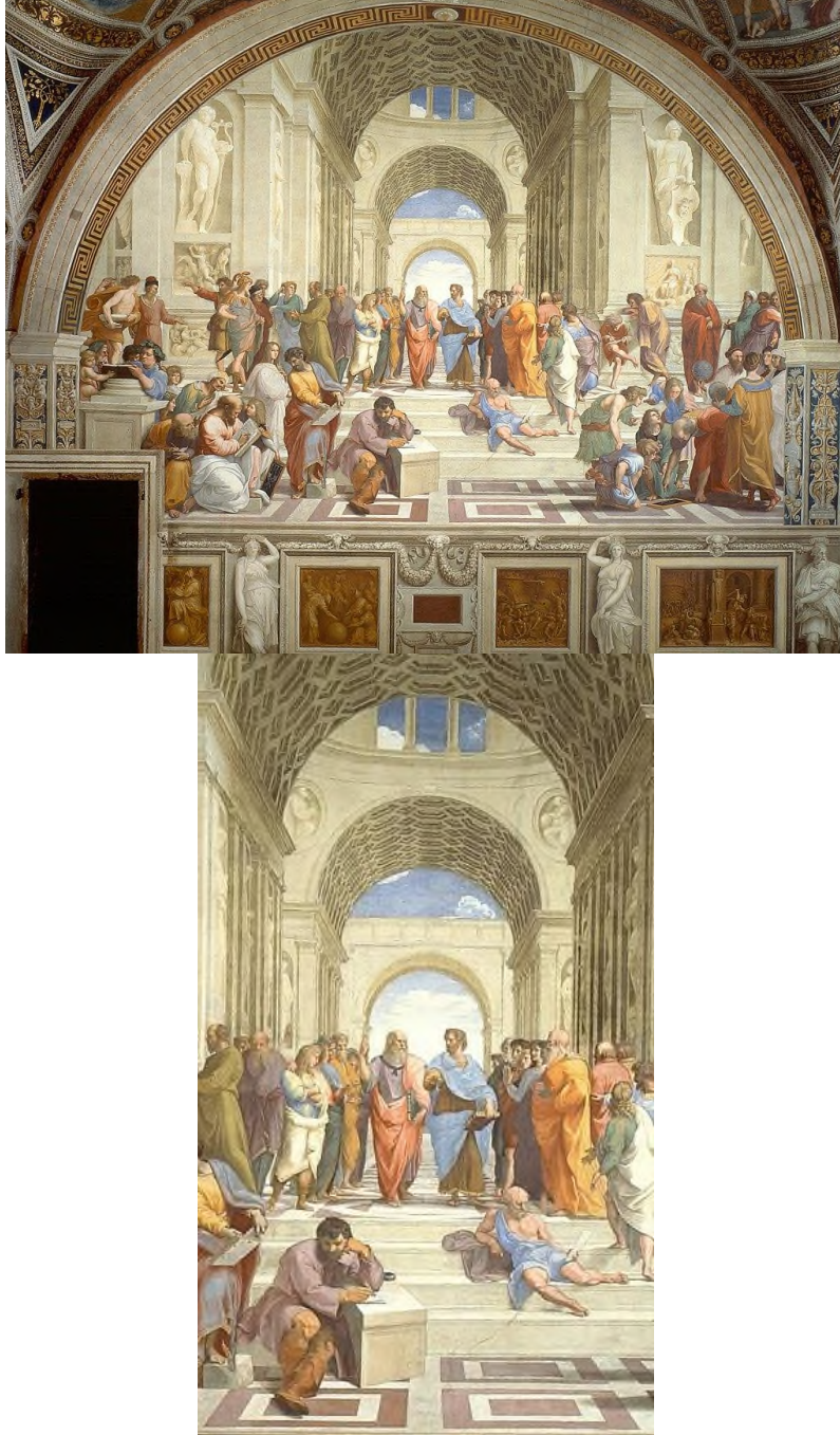
Şekil 3. Raffaello Sanzio, Atina Okulu, 1509, 772 cm, Fresk, Vatikan: Stanza della Segnatura.

“15. yüzyılda hümanistler, aristokratlar, dönemin politik aktörleri ama özellikle de Marsilio Ficino tarafından Floransa Yeni-Platoncu Akademi kurulmuştur. Floransa da kurulan oldukça etkili bu informal akademiden yaklaşık yüz yıl sonra iyiden iyiye Yeni-Platoncu felsefenin tartışıldığı, entelektüel bir yetkinlik alanı olarak takip edildiği doruk bir zamanda, Raffaello Santi tarafından da Atina Okulu adlı eser yapılmıştır” (Özyılmaz, 2022).