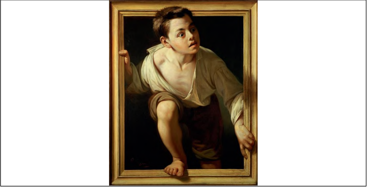
Şekil 12. Pere Borrell del Caso, 75,7 cm x 61 cm, 1874, Eleştiriden Kaçış, Collection Banco de España, Madrid.

Yanılsama kavramı ile ilişkili olarak trompe'l oeil tekniğine örnek oluşturan bir diğer eser, Perre Borrell del Caso'nun (ressam, 1835-1910, İspanya) Yergiden Kaçış adlı çalışmasıdır.