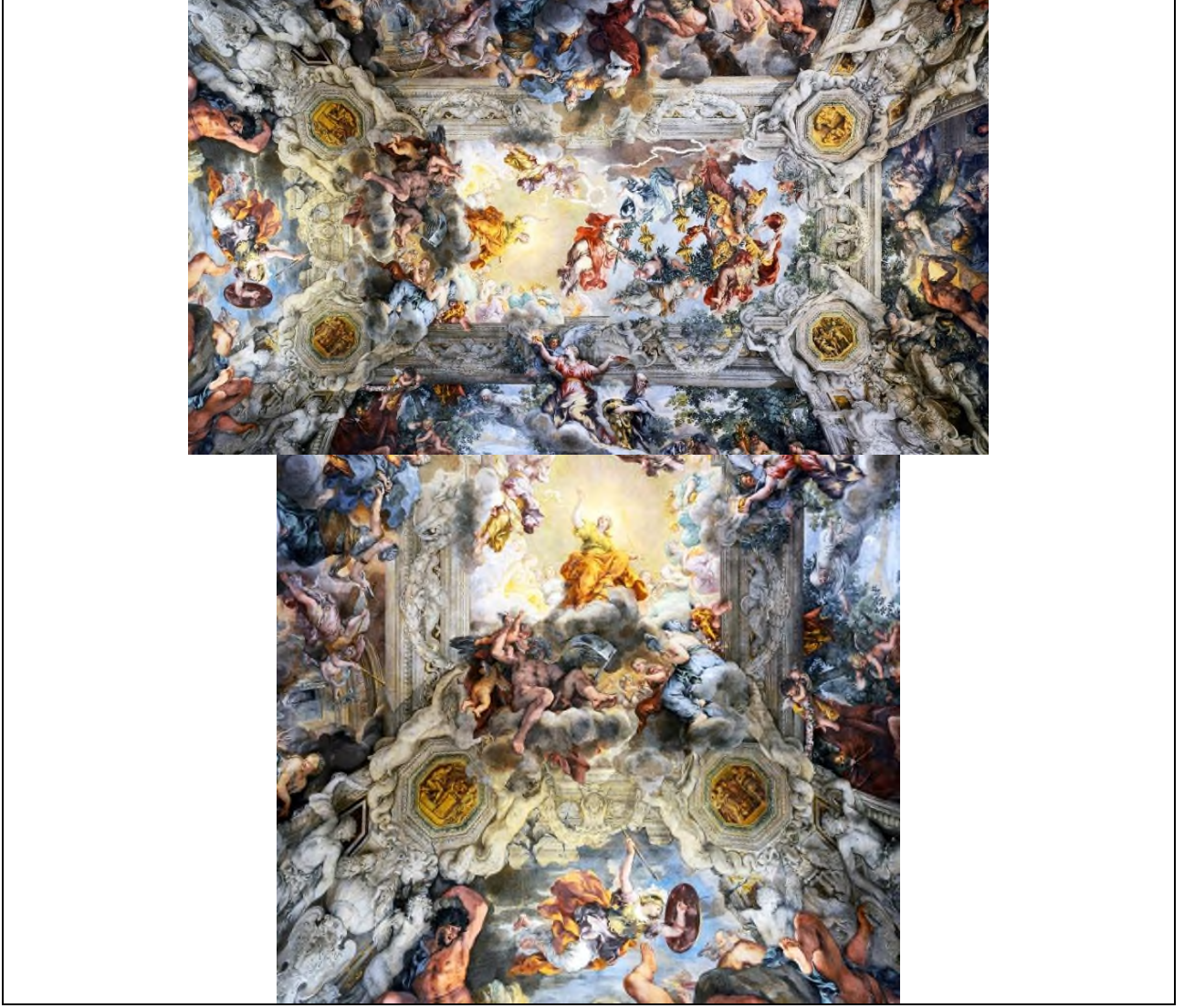
Şekil 9. Pietro da Cortona, İlâhi Takdir 1633-1639, Palazzo Barberini, Roma.

Kaynak: https://en.wikipedia.org/wiki/Allegory_of_Divine_Providence_and_Barberini_Power