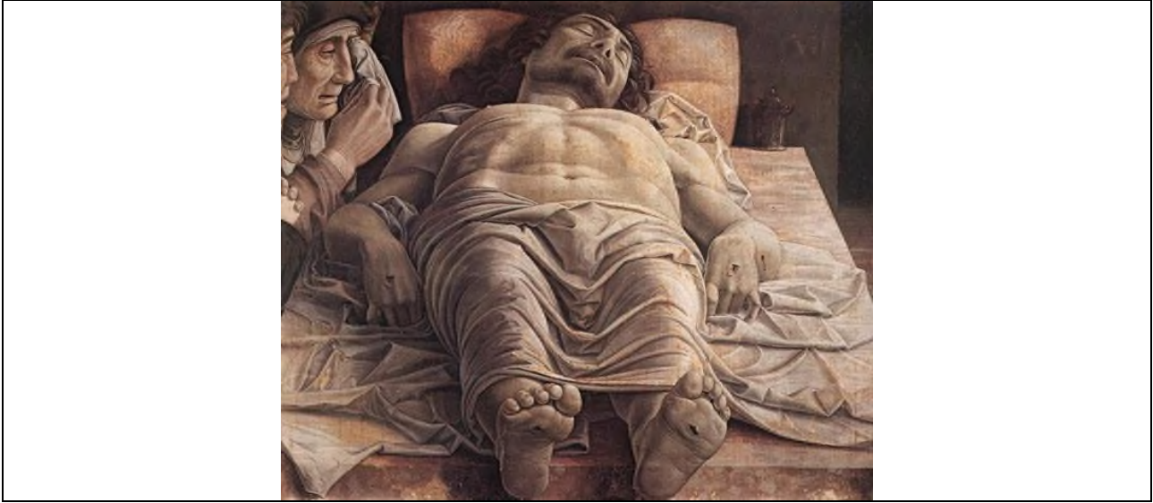
Şekil 1. Andrea Mantegna, Ölü İsa, 1480, 60x81 cm, tuval üzerine yağlıboya, Milano, Brera Sanat Galerisi

“Ölü İsa’ya Ağıt yapıtında (şekil 1) Mantegna, vücudun oranlarını deęiştirip ters yüz ederek rakursiyi uygulamış ve izleyicinin bakışlarını ilk önce İsa’nın başına yönlendirmiştir. Böylece izleyici sahnedeki acıya, Meryem’in yaşına dahil edilmiştir. Bu teknik aynı zamanda izleyicinin resim yüzeyinde basıklık etkisi yaratan (neredeyse rölyef etkisi uyandıran), sahnenin ön planında yer alan İsa’nın ayaklarına odaklanmasını önler. Öte yandan rakursinin yoğun dramatik etkisini azaltarak sanatçı izleyicinin -kendisine sessiz bir tefekkür sunan- resim yüzeyine yumuşak bir noktadan dahil olmasını sağlar” (Pankhurst & Hawksley, 2018, s. 161).