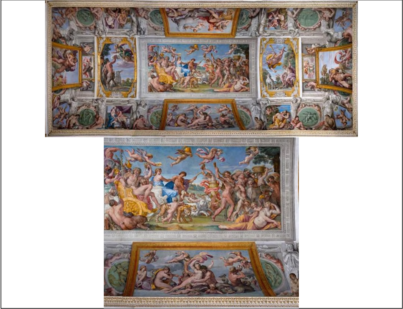
Şekil 7. Annibale Carracci, Galleria Farnese'nin Tavanı, 1600, Fresk, Palazzo Farnese, Roma

Annibale Carracci, Galleria Farnese'nin tavanına yapmış olduğu fresklerle quadratura tekniğinin başarılı örneklerini sunmuştur. Yapının devamı niteliğinde görünen freskler aynı zamanda mekâna derinlik hissi vererek yanılsamayı arttırmıştır.