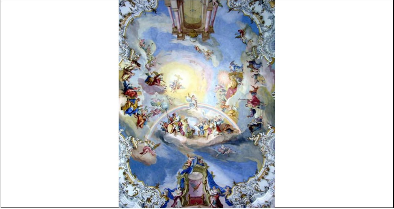
Şekil 5. Johann Baptist Zimmermann, Son Yargı, 1746-54, fresk ve alçı, Wies, Almanya.

Quadratura'nın başarılı örneklerinden bir diğeri ise Johann Baptist Zimmermann'ın Wies Kilisesi'ndeki tavan freski eseri olan "Son Yargı" adlı çalışması olmuştur. Ressamın mimari yapının tavanına gerçekleştirmiş olduğu resim, Andrea Mantegna'nın Camera degli Sposi (Şekil 2) ve Giambattista Tiepolo'nun eseri (Şekil 4) ile aynı etkiye sahip bir görünüştedir. Mimari yapının tavanına gerçekleştirilen eser quadratura adlı teknikle gerçekleştirildiğinde yanılsama etkisi kaçınılmaz olmuştur. Resim, yapının tavanında yukarı doğru yükseliyormuş izlenimi uyandırırken kutsal bir atmosfer yansıtmıştır.