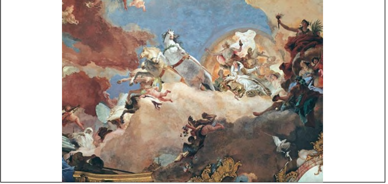
Şekil 4. Giambattista Tiepolo, güneş arabasındaki Apollon I. Beatrice'i I. Frederick Barbarossa'ya götürüyor. İmparatorluk odasının tavanından detay (fresk).