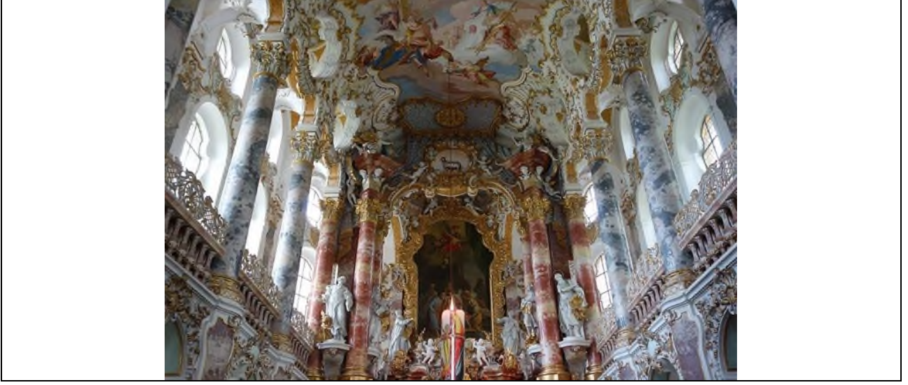
Şekil 11. Wies Kilisesi, Almanya.

Yanılsama kavramı ile ilişkili olarak trompe'l oeil tekniğine örnek oluşturan bir diğer eser, Perre Borrell del Caso'nun (ressam, 1835-1910, İspanya) Yergiden Kaçış adlı çalışmasıdır.