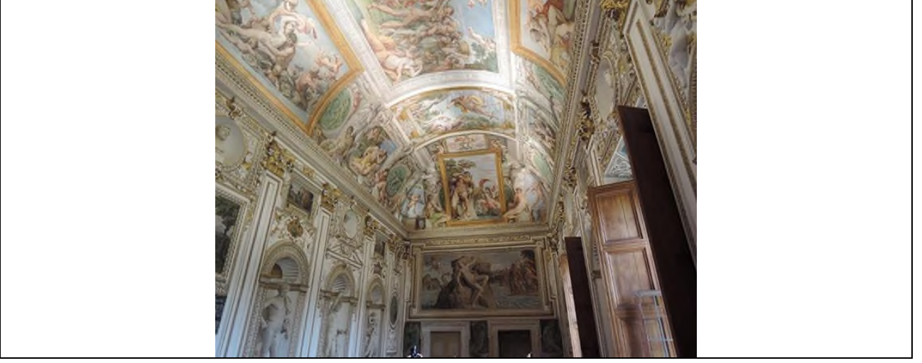
Şekil 6. Annibale Carracci, Galleria Farnese'nin tavanı, 1600, fresk, Palazzo Farnese, Roma.

ünitelere bölmüş, freskleri çerçeveler içine almış ve çerçevelerin etrafına da kabartma ve heykeller yerleştirmiştir” (Öndin, 2018, s. 34).