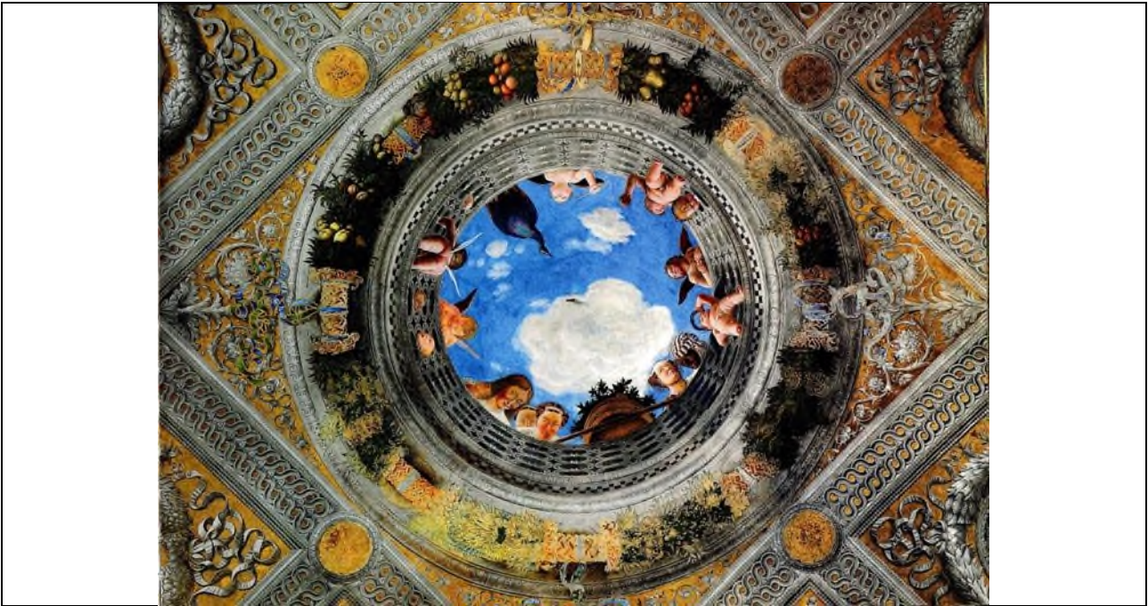
Şekil 2. Andrea Mantegna, Camera degli Sposi, Gonzaga Ailesi Düklük Sarayı, 1465-74.

Tavana bakıldığında resmin mimari yapının devamı gibi algılandığı ve sanatçının dışarıya açılan bir pencere izlenimi vererek yuvarlak yapının etrafında duran figürlerle söz konusu yanılsamayı daha da arttırdığı anlaşılmaktadır. Ressam aynı zamanda rakursi tekniğini de kullanarak figürlere yüksekte duruyor ve tepeden bakıyormuş izlenimini vermiştir.