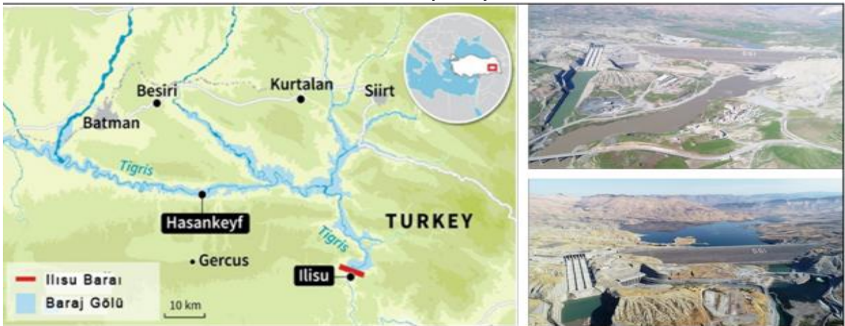
Resim 1: Hasankeyf Barajı ve Gölü