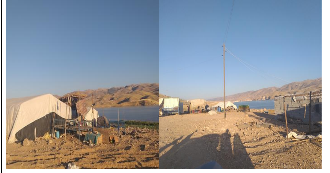
Resim 4: Çadırlarda kalan köylüler