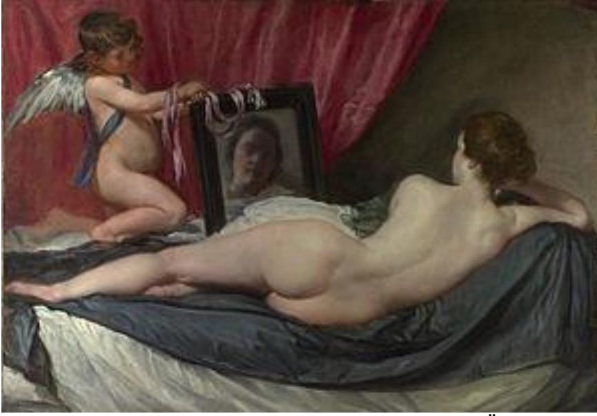
Görsel 2. Diego Velazquez, Aynadaki Venüs, 122 x 177 cm., T.Ü.Y.B., 1647, National Gallery, Londra

Bu dönemde çoğunlukla çıplak kadın bedenleri resmedilmekteydi. “Çünkü çıplak kadına bakmaktan zevk duyuluyordu” (Berger vd., 2005, s.51). Resmedilen kadının eline ise ayna verilmekteydi ya da karşısına konulan bir aynadan kendine bakması sağlanmaktaydı.