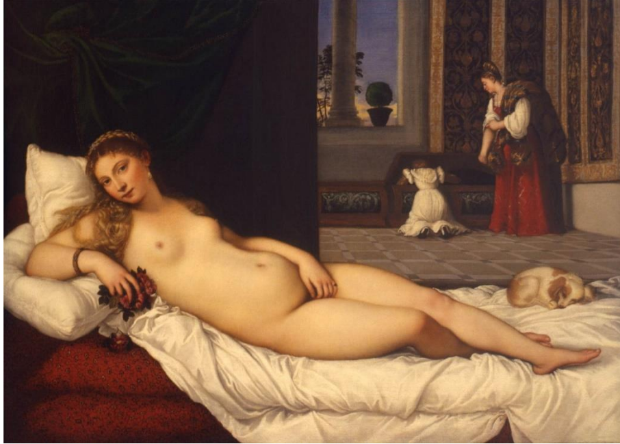
Görsel 1. Tiziano, Urbino Venüsü, 119x165 cm., T.Ü.Y.B., 1534, Floransa/ Uffizi Galerisi

Urbino Venüsü, İtalyan ressam Tiziano'nun 1534'te başlayıp 1538'de bitirdiği yağlıboya eseridir (Görsel 1). Sanatçı, sarayda bir oda olduğu anlaşılan mekânda çıplak halde uzanmış bir kadın figürü tasvir etmiştir. “Venüs dokunulmaz, yüce bir tanrıça olmaktan çok, cinsel çağrışımlar içeren ifadesiyle genç bir kadındır. Davetkâr bakışları izleyici ile doğrudan bir iletişim kurmakta ve böylece aradaki mesafeyi azaltmaktadır” (Kara, 2019, s.5). Resmedilen kadın, resmin ön-orta kısmına konumlandırılarak dikkati doğrudan üzerine çekmektedir. İzleyici ile göz teması kuran kadın, aslında izlenildiğinin farkında olduğunu göstermeye çalışmaktadır.