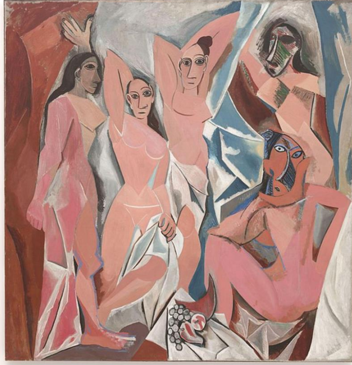
Görsel 5. Picasso, Avignonlu Kızlar, 243.9x233.7 cm., T.Ü.Y.B., 1907, Modern Sanatlar Müzesi, Newyork

Resim sanatında oldukça güçlü etki yaratan ve aynı zamanda bir o kadar tepki toplayan eser (Görsel 5) Pablo Picasso’nun 1907’de yaptığı Avignonlu Kızlar olmuştur.