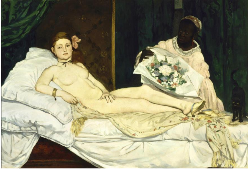
Görsel 4. Edouard Manet, Olympia, 130,5 x190 cm. T.Ü.Y.B., 1863, Orsay Müzesi, Paris.

Fransız ressam Edouard Manet 'Olympia' adlı eserini (Görsel 4) 1863 yılında tamamlamıştır.