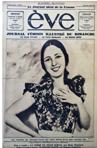
Görsel 1. Keriman Halis Avrupa Basınında (éve,1932).

Türkiye'de güzellik kraliçelerinin seçilmesi de bu yıllara rastlamaktadır. Kadınlar arasında bir güzellik yarışması düzenleme fikrini 1929 yılında Cumhuriyet gazetesi ortaya atmıştır. Fikir hemen benimsenmiş ve ülkede ilk güzellik yarışması düzenlenmiştir. 1932 yılında düzenlenen yarışmada Türkiye Güzellik Kraliçesi seçilen Keriman Halis Hanımın daha sonra Dünya Güzeli seçilmesi Avrupa basınında da büyük yankı uyandırmıştır (Görsel 1) (50 Yıllık Yaşantımız 1923-1933, Cilt:1 Milliyet Yayınları, 1975). Çarşıftan çıkarak Batılı giyim tarzını benimseyen Cumhuriyet kadını için güzellik yarışmaları ulusal bir görev olarak tanımlanmıştır (Alkan, 2004).