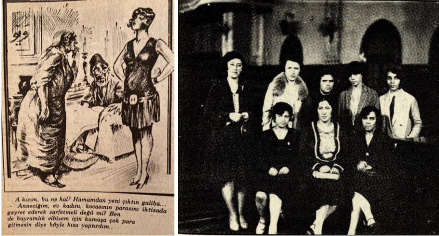
Görsel 2. Türk kadınının moda tutkusunu eleştiren bir karikatür örneği (Milliyet Yayınları, 1975).

Dönemin karikatür dergilerinde ve basında Batı modasını yakından takip eden Türk kadınının moda tutkusu eleştirilerek (Görsel 2) değişimin sadece görünüşte kaldığı iddia edilmiştir (Özkavruk Adanır, vd., 2016, s. 230). Türk kadını değişmeye devam etmiş, spor faaliyetleri de kadının yaşamında önemli bir rol oynamaya başlamıştır. Dergilerde spor yapmanın önemini vurgulayan çeşitli yazılar kaleme alınmıştır. "Çeviklik Temin Eden Hareketler" başlıklı bir yazıda "Kadın vücudunun adaleli, çevik ve güzel olması için Avrupa yeni bir ilim yaratmıştır. Enstitüleri, profesörleri olan bu ilmin sayısız talebesi vardır. Genç, evli her kadın vücuduna estetik bir güzellik verebilmek için muayyen bir metotla çok çetin vücut hareketleri yapar." denmektedir (7 Gün Dergisi, 1939). Ayrıca müfredata beden eğitimi dersleri ilave edilmiş, giysilerde spor giyim popülerleşmiştir.