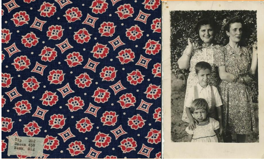
Görsel 7. Soyut çiçekler geometrik motifler ile kombine edilerek üretilmiş, iki renk ile basılmış pamuklu kumaş örneği. (İzmir Ekonomi Üniversitesi Güzel Sanatlar ve Tasarım Fakültesi, Tudita Arşivi, 1959 Mart ayı basma imalat albümü).

Pamuklu kumaşlar üzerine basılan desenler arasında soyut çiçek motifleri tek başlarına ya da geometrik motifler ile kombine edilerek yer almıştır (Görseller 7,8). Genellikle yün iplikleri ile farklı kalite ve gramajda dokumadan desenli kaz ayağı ya da “prince de gaulle” olarak adlandırılan kumaş (Özkavruk ve Yılmaz, 2007), tasarruf yıllarında bu örnekte görüldüğü gibi baskı tekniği ile üretilmiştir (Görsel 9). Sümerbank deyince ilk olarak akla küçük çiçek desenli kumaşlar gelse de bir diğer ikonik Sümerbank deseni de çizgili kumaşlar olmuştur. Bu kumaşların bir kısmı özellikle erkek pijamalarında kullanılmıştır (Görseller: 10,11). Klasik Sümerbank pijama renkleri bordo, mavi, lacivert ve kahverengi çizgili üretilmiştir. Sümerbank desen tasarımcılarından Necdet Ogan çizgili monokrom kumaşların basılmasında bir dönem bakır baskı silindirleri kullanıldığını, ancak bir süre sonra maliyet nedeni ile bakır rulo kullanımından vazgeçildiğini aktarmıştır. Maliyet nedeni ile çok ince çizgilerden vazgeçilerek daha kalın çizgili kumaşlar tasarlanmış, bu kumaşlar Türk erkeğinin domestik ev yaşamının bir parçası haline gelip sembolik bir forma dönüşmüştür (Özdemir, 2014; Himam, 2017).