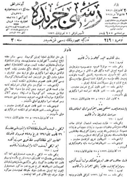
Görsel 4. 09 Aralık 1925’te Meclis Tarafından onaylanan ve 20 Aralık 1925 tarihli Resmî Gazete’de yayımlanan Yerli Kumaştan Elbise Giyilmesine Dâir Kânûn (T.C. Resmî Gazete Arşivi Online, 1925).

Görsel 4’te görülen 1925 Aralık ayında hükümetin meclise getirdiği yerli kumaştan elbise giyme tasarısı, ülkede birçok düzenleme yapılmasına sebep olmuştur (Alpan, 2003).