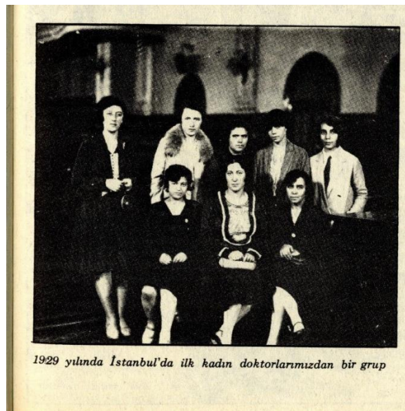
Görsel 3. 1929 yılında İstanbul'da ilk kadın doktorlarımızdan bir grup.

Türkiye Cumhuriyeti'nin 1923'te kurulması ile devlet öncülüğünde sadece kurumsal yapıları değil, aynı zamanda halkın dış görünüşünü, alışkanlıklarını, yaşam biçimlerini ve dünya görüşünü de dönüştürmeyi amaçlayan bir modernleşme süreci başlamıştır. Mustafa Kemal Atatürk'ün ülkenin eğitim, hukuk, sosyal yaşam, giyim, müzik, mimari ve sanat alanlarında Batı normlarını benimsemesine yönelik başlattığı reformlarla beraber Türkiye'de öncü modeller denenmiştir. Türk kadını iyi bir anne ve eş olmanın yanı sıra toplumsal hayatta farklı alanlarda çalışarak ülkenin gelişimine katkı sağlamak için var gücüyle çalışmıştır. Basında, çalışma hayatında yer alan Türk kadınlarının haberlerine sıklıkla yer verilmiştir (Özkavruk Adanır ve diğ.,2016). İlk Türk kadın doktorların yer aldığı fotoğraf kadınların kazandıkları hakların ve toplum içinde görünürlüklerinin artmasının bir kanıtıdır (Görsel 3).