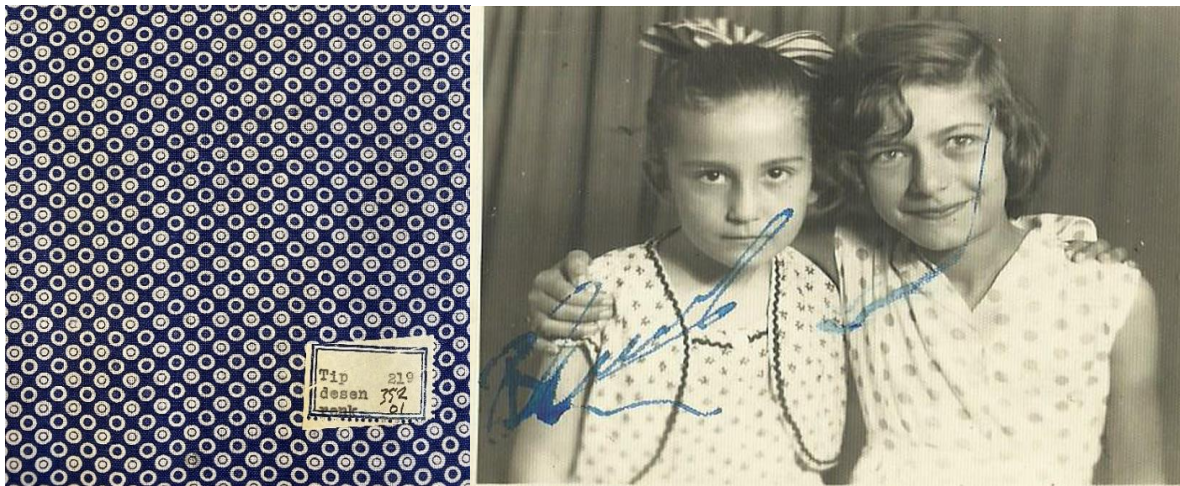
Görsel 5. Mart 1959 yılına ait puantiyeli kumaş örneği (İzmir Ekonomi Üniversitesi Güzel Sanatlar ve Tasarım Fakültesi, Tudita Arşivi, 1959 Mart ayı basma imalat albümü).

Sümerbank'ın 1930'lardan 1960'lara kadar ürettiği tekstiller, tasarıma analitik bir yaklaşım sergilerken modernlik, özgünlük ve yenilik üzerine kurulu bir tasarım diline sahiptir. Bu dönemde Sümerbank tasarımlarını şekillendiren önemli bir etken de malzeme ve teknolojik kısıtlamalar olmuştur. Örneğin baskılı tekstillerde kullanılan sınırlı renk paleti, fabrikaların boyadan tasarruf etmesini sağlarken, desenler de terzilikte kumaş israfını en aza indirecek şekilde tasarlanmıştır. Küçük desenler tercih edilmiştir. Dönemin tasarımcıları da "Anadolu kadınının sevdiği şeyleri çizmeye özen gösterdiklerini" belirtmişlerdir; zaman zaman çiçekleri soyutlamışlar zaman zaman da çiçek tomurcuklarının enine kesitlerini kullanmışlardır. Geometrik ve eğlenceli polka beneği (puantiye) desenleri de genç kuşağın kullandığı desenler arasındadır (Görseller 5, 6).