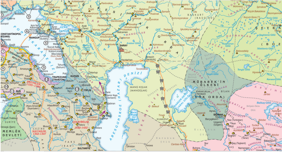
Harita 2: Karadeniz'in Kuzeyinden Geçen Ticaret Yolları 46

Altın Orda'nın ticaret ve üretim bakımından önemli kentleri ve yerleşimleri arasında iki Saray (genelde Tsarevskoe Gorodişçe ve Selitrennoe Gorodişçe denen kazı alanlarıyla özdeşleştirilir), Belcimen ( Vodyanskoe Gorodişçe ile özdeşleştirilir), Ügek (Saratov'un güneyinde), yine aşağı Volga'da Şareny Bugor arkeolojik alanı (genelde Altın Orda Devri'ndeki Hacı Tarhan kentiyle eşleştirilir), Volgograd'daki Mecyotnoe Gorodişçe (Tortanlı?), Don kıyısındaki yerleşimler, Ural kıyısındaki özellikle Sarayçık kenti, Batı Sibiry'a'da İrtiş'teki İsker, Kuzey Kafkasya'daki büyük merkez Macar, Yukarı Volga'daki Bulgar, Harezm'deki Ürgenç, Kırım'daki Tana sayılabilir 47 . Dolayısıyla Kırım'daki Tana ve Kefe limanlarına giden İpek Yolu rotaları ve Ceneviz ile Venedik'in Karadeniz'den gelip geçtiği özellikle nehir rotaları Altın Orda'nın bu kentlerine bağlanmaktaydı. Altın Orda'nın ithal ettiği kumaş türlerine bakıldığında ise tafta , kamokat , damask , İtalyan damask türlerinden kişter , atlas , saten ve sendal olarak isimlendirilen ve genel itibarıyla ipekten imâl edilen kumaşlar ile samit , baldakin , nesic ve nak denen altın veya gümüş örgülü ipek kumaşların oldukça pahalı olduğu göze çarpmaktadır 48 .