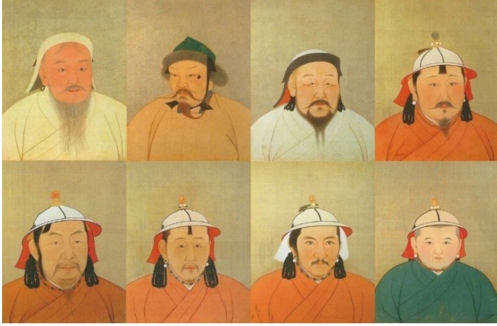
Ek 1: Taipei Ulusal Saray Müzesi'nde Yuan-Moğol İmparatorlarının (Cengiz Han'dan başlayarak) İpek Portreleri ( Kesi )