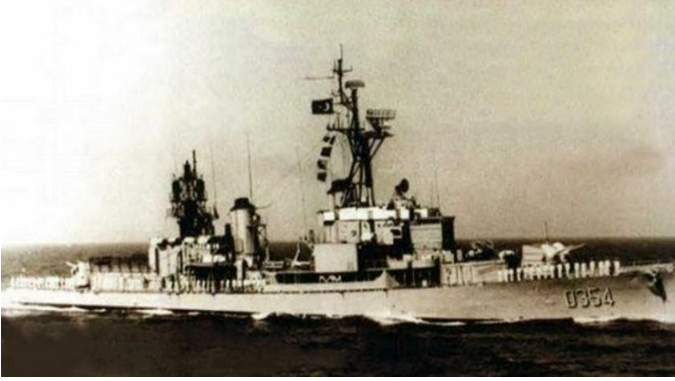
Görsel 1. TCG Kocatepe, (URL-1).