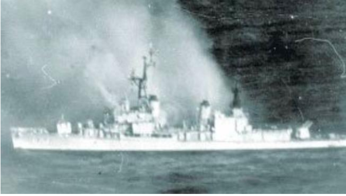
Görsel 2. Hava saldırısı sonrasında yanan TCG Kocatepe, (URL-2).