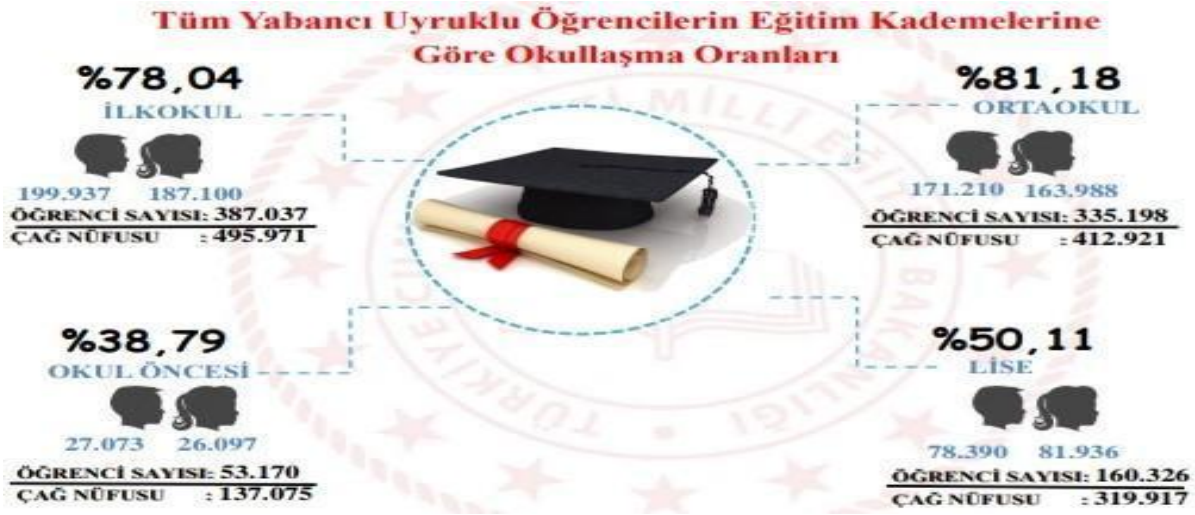
Şekil 1. Tüm Yabancı Uyruklu Öğrenci Dağılımı