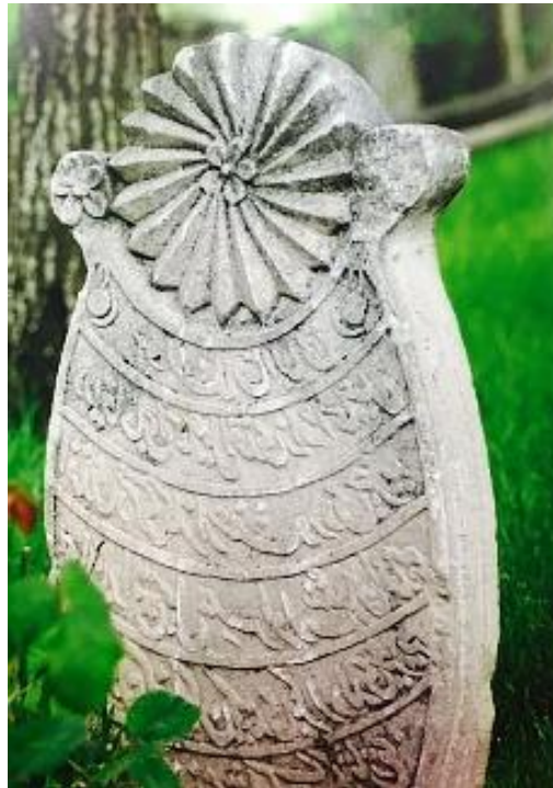
Şekil 15. Kayseri, Seyyid Burhaneddin Türbesinde Güneş İşlemeli Gelin Mezar Taşı (Arslan, 2017, s. 1936).