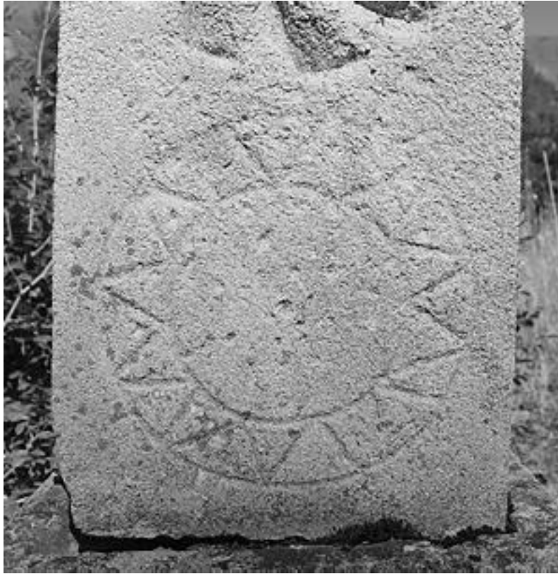
Şekil 9. Sivas, Güneş Motifli Mezar Taşı (Kaya & Uzungöz, 2019, s. 172).