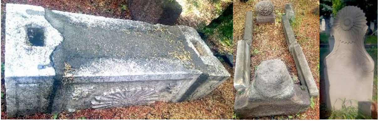
Şekil 6. Ankara, Taceddin Camii ve Dergâhı Bahçesi Lahit ve Mezar Taşları Üzerinde Güneş Sembolleri.