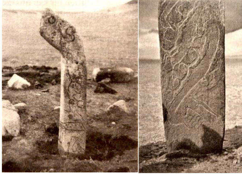
Şekil 2. Proto-Türk veya Hun Devrine Ait Geyik Taşı, (Çoruhlu, 2017, s. 168).

bulunan geyikli taşlar da yer almaktadır (Şekil 2) (Turan, 2017, s. 447). Güneş sembolizmi bu süre zarfında istikrarlı bir şekilde gelişmiştir (Şekil 3); sembollerin ifade biçimi değişmiş, bronz levhalardan oluşan bu semboller (Şekil 4), güneşin farklı yönlerini ve anlamlarını yansıtmıştır (Martynov, 1988, s. 23). Güneş sembolü, sonraki dönemlerde görsel açıdan farklılaşsa da anlamını koruyarak kullanılmaya devam etmiştir.