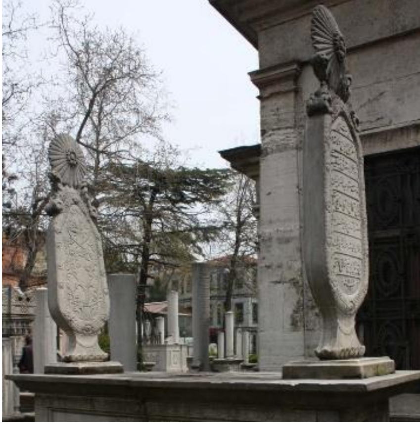
Şekil 16. İstanbul, Sur İçi Bölgesinde Güneş Motifli Mezar Taşı (Aydoğdu, 2011, s. 51).