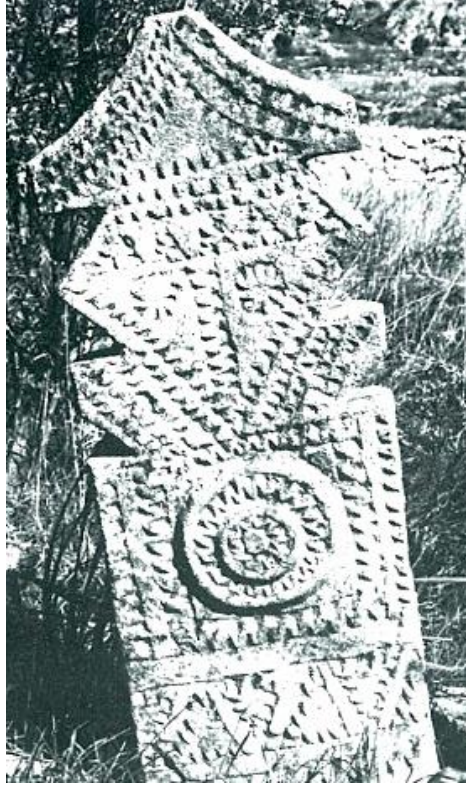
Şekil 10. Antalya, Güneş Motifli Mezar Taşı (Seyirci & Topbaş, 1996, s. 122).