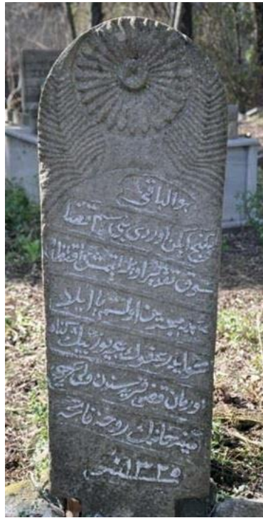
Şekil 13. Bursa, Mustafakemalpaşa İlçesinde Güneş Motifli Mezar Taşı (Budak, 2019, s. 170).