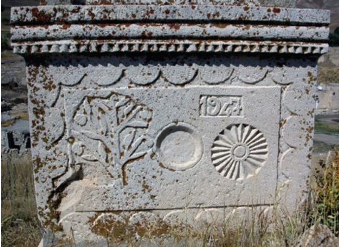
Şekil 7. Erzincan, Başköy İlçesi, Güneş Motifli Lahit (Çal, 2011, s. 221).