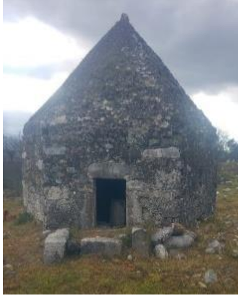
Şekil 5. Yerel Türbe Örneği, Muğla, Köyceğiz.

Anadolu'da Türkler tarafından kullanılan güneş sembolleri, Orta Asya Türk kültüründen gelen etkiyle oluşmuştur. Türkler, Orta Asya'dan 11. yüzyıldan itibaren göç ettikleri Anadolu'ya kültürlerini, dillerini ve dinlerini de taşımışlardır. Gazne ve Selçuklu sanatı arasında bir ilişki ve kültürel etkileşim olduğu, sanatsal öğelerin benzerliğinden anlaşılmaktadır. Gazne mimarî süslemesi ile Anadolu Selçuklu sanatının motifleri, oluşumları ve işleyişleri arasında ortak özellikler bulunmaktadır. Bununla birlikte, Anadolu Selçuklu tezyinatı daha detaylı ve gelişmiş motiflere sahiptir. Özellikle “Düğmeli Rumi” ve “Musul Mektebi” yapılarında bu etkileşim görülmektedir (Ögel, 1964, s. 204).