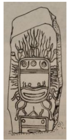
Şekil 3. (a) Okunyev Taş Oymasındaki Güneş Kadın Yüzü Tasviri (Çoruhlu, 2017, s. 39), (b) Tasmin Bölgesinden Okunyev veya Karasuk Devrine Ait Oymalı Ruh Tasvirli Dikilitaş, (c) Çamak Bozkırından Okunyev veya Karasuk Devrine Ait Koyun-Koç Şeklinde Dikilitaş (Çoruhlu, 2017, s. 47).