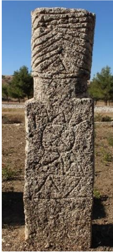
Şekil 11. Denizli, Kale İlçesinde Güneş İşlemeli Mezar Taşı (Beyazıt, 2020, s. 922).