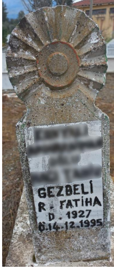
Şekil 8. Muğla, Güneş İşlemeli Mezar Taşı.