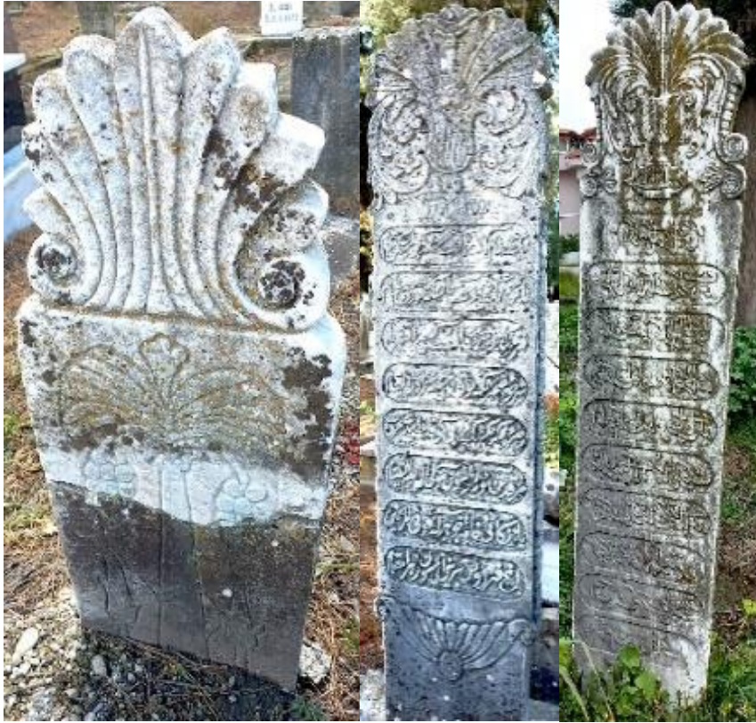
Şekil 17. Muğla, Güneş İşlemeli Mezar Taşları.