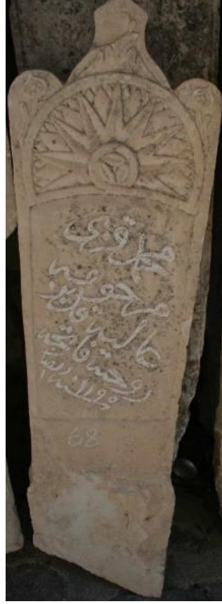
Şekil 12. İzmir, Çeşme İlçesinde Güneş Motifli Mezar Taşı (Biçici, 2020, s. 37).