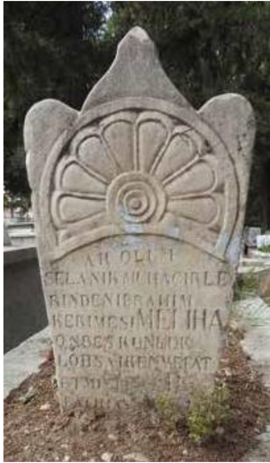
Şekil 19. İzmir, Kokluca Mezarlığında Güneş İşlemeli Mezar Taşı (Çağlıtütüncigil, 2021, s.