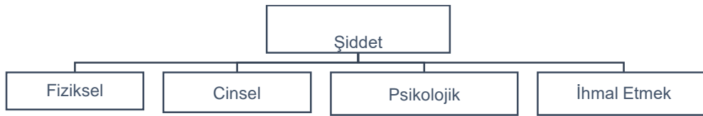
Şekil 2. Şiddetin Doğasına Göre Şiddet Türleri