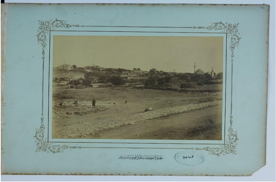
Ek. 1. Malkara Kasabası'nın Manzara-ı Umûmiyesi 108