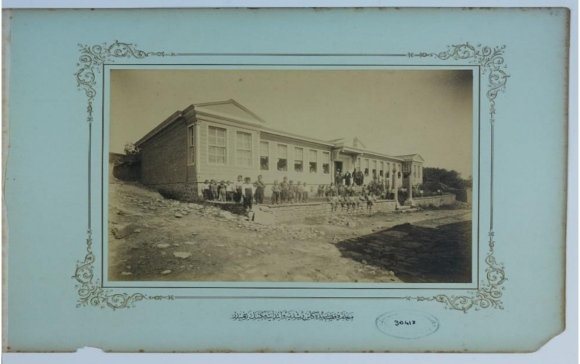
Ek. 2. Malkara Kasabası'nda Kâin Rüşdiye ve İptidaiye Mektebi'nin Resmi 109