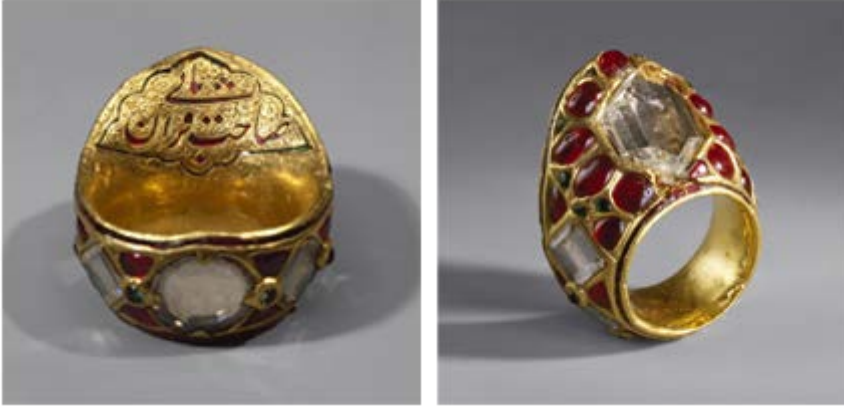
Resim 6: Şah Cihân'a ait bir zihgir. Dış elmas, yakut ve zümrütler ile bezenmiş olan zihgin iç yüzeyinde "Sahibkiran-ı Sani" yazmaktadır.