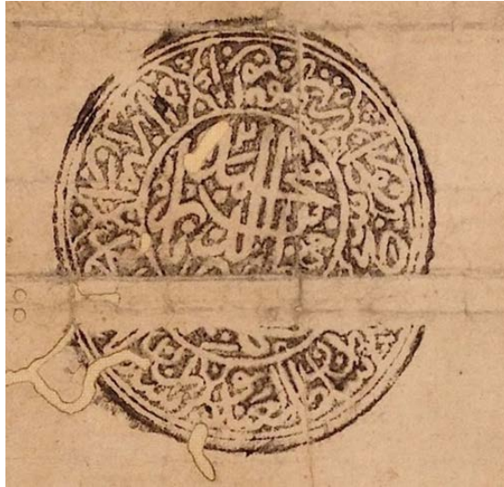
Resim 1: Bâbür Şah'a ait bir mühür. Ortada: Zahirüddin Muhammed Bâbür. Kenarda: İbn Ömer Şeyh ibn Sultan Ebu Said ibn Sultan Muhammed ibn Miran Şah ibn Emir Timur. (Gallop, 1999, s. 107).