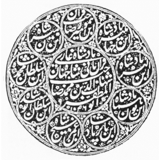
Resim 5: Şah Cihân'ın 1636 yılına ait mühürü. Mührün ortasındaki dairede; Ebu'l-Muzaffer Şehabeddin Muhammed Sâhibkran-ı Sâni Şah Cihân Padişah-ı Gazi yazılıdır. (Gallop, 1999, s. 118).