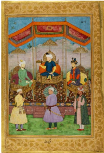
Resim 3: 1628'lerde sanatçı Govardhan tarafından çizilen bu minyatürde Emir Timur (ortada) Bâbü Şah (solda) ve oğlu Hümayun Şah birlikte tasvir edilmiştir.