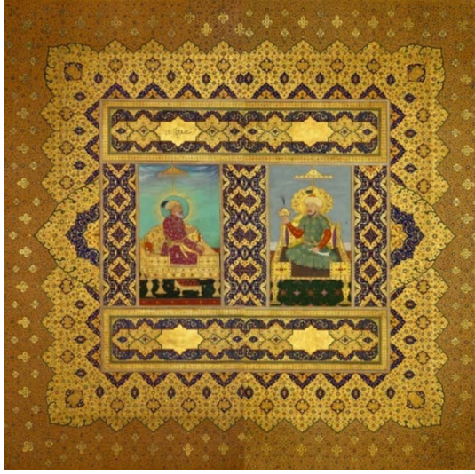
Resim 4: Abdul Hamid Lahori'nin Padishahname'sindeki bu minyatürde Emir Timur (sağda) ve Şah Cihân birlikte tasvir edilmiştir. (Beach ve Koch, 1997, s. 14).