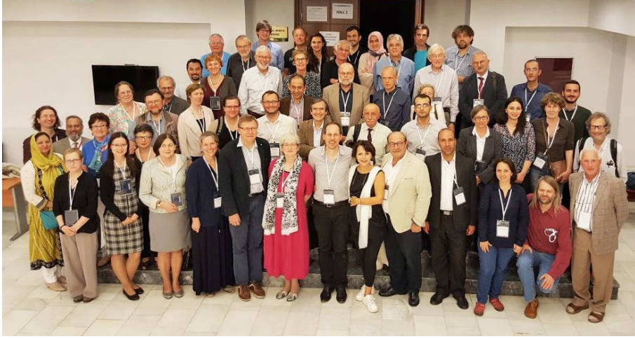
35. SIC Sempozyumu katılımcıları (İÜ Kongre ve Kültür Merkezi)