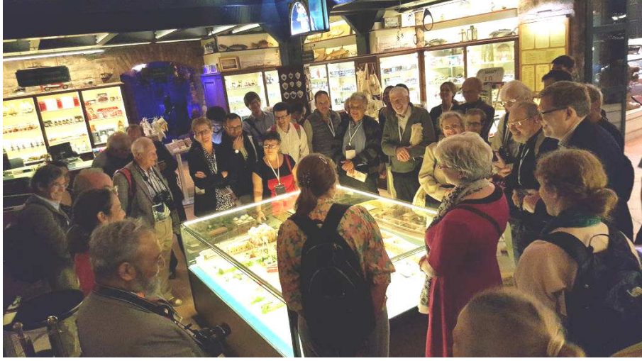
Rahmi M. Koç Sanayi Müzesi'nde

30 Eylül 2016 oturumların tamamlanmasının ardından, katılımcılardan gelen özel istek üzerine, öğle yemeği arasında İ.Ü. Astronomi ve Uzay Bilimleri Bölümü'nde yer alan İstanbul Üniversitesi Gözlemevi'ne kısa bir ziyaret gerçekleştirildi. Ardından Boğaziçi Üniversitesi Kandilli Rasathanesi'ne gidilerek astronomi ve sismoloji aletleri koleksiyonu ile gözlemevi gezildi. Kandilli'den Boğaz'a inilerek Kuleli Askerî Lisesi önünden tekneye binildi ve yemekli Boğaz Turu yapıldı. 1 Ekim 2016 Cumartesi günü ise Heybeliada'da