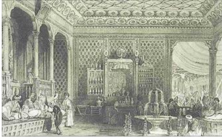
Thomas Allom'un bir İstanbul kahvehanesini temsil eden gravürü (R. Walsh, Constantinople and the Scenery of the Seven Churches of Asia Minor, London 1839, İv. 30)

Esnaf kahvehaneleri, yeniçeri, tulumbacı, âşık kahvehaneleri, semai kahvehaneleri, meddah kahvehaneleri adı ile ünlenen kahvehaneler İstanbul'un seçkin ve güzide semtlerinde hayatlarını devam ettirirken zamanla başka semtlerde de kahvehaneler açılmıştır. Sarafim Kırathanesi, Küllük Kırathanesi, Marmara Kırathanesi, Acemin Kahvesi, İhsan İkbâl Kırathanesi, Meserret Kırathanesi bunların başında gelen kahvehanelerdir (Sökmen, 2013:49).