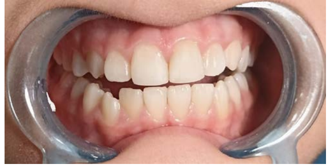
Resim 8. Maksiller santral dişlerin 3.aydaki klinik kontrollerine ait intraoral görüntü

3.aydaki klinik kontrolünde alınan radyografide herhangi bir patolojiye rastlanılmadı (Resim 9).