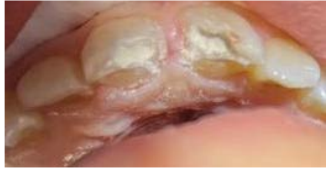
Resim 3. Maksiller santral dişlere Biodentin ile yapılan Cvek amputasyonunun intraoral görüntüsü

dokusuna baskı uygulanmadan yerleştirildi (Resim 3).