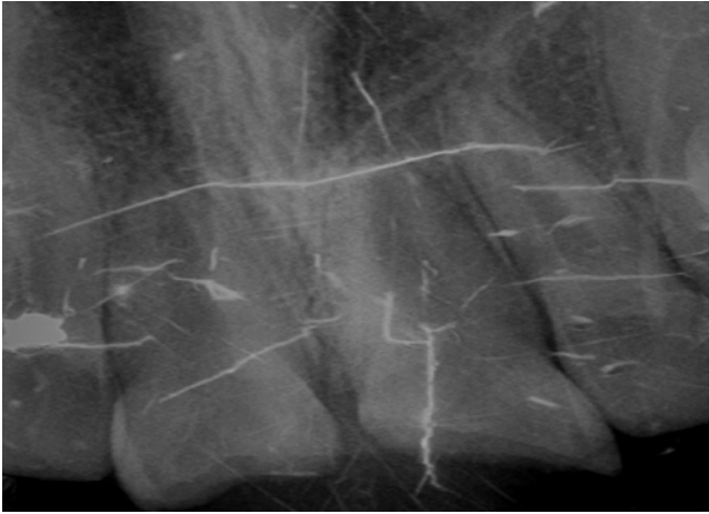
Resim 2. Maksiller santral dişlerin preoperatif radyografik film görüntüsü

Travmanın etkilediği bölgede, gingival doku, oral mukoza, periodontal yapılar ve destekleyici alveolar kemikte herhangi bir ek yaralanma bulgusuna rastlanmadı. Ancak, travmanın şiddetine bağlı olarak hafif seviyede perküsyon hassasiyeti belirlendi. Diğer yandan, soğuk testi uygulandığında dişlerden pozitif yanıt alındı (Endo-Frost; Roeko, Langenau, Almanya). Radyolojik incelemede, dişlerin apeks oluşumunun tamamlandığı ve periapikal bölgede herhangi bir patolojik bulgu olmadığı tespit edildi (Resim 2).