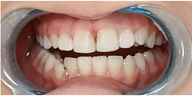
Resim 6. Maksiller santral dişlerin postoperatif intraoral görüntüsü

Her kompozit rezin tabakası, LED ışık kaynağı ile 20 saniye polimerize edildi. Restorasyonun sonlandırılmasında alüminyum oksit kaplı diskler (Sof-Lex, 3M - ESPE, St. Paul, MN, USA) ve kompozit bitirme lastikleri ile polisaj işlemleri tamamlandı (Resim 6).