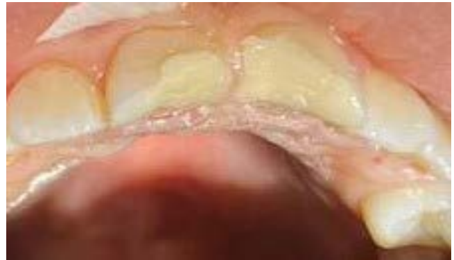
Resim 4. Maksiller santral dişlerin kavitelelerinin geçici restoratif materyal ile örtülmesi sonrası intraoral görüntüsü

Materyalin tam olarak sertleşmesi için 12 dakika beklenip sertleşme sürecinin ardından kavite yüksek viskoziteli bir cam iyonomer siman olan Riva Self Cure (SDI, Victoria, Avustralya) ile restorasyonu tamamlamak üzere kapatıldı (Resim 4).