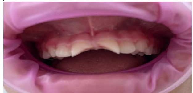
Resim 1. Maksiller santral dişlerin preoperatif intraoral görüntüsü

Hasta ve yasal vasisine, gerçekleştirilecek tüm prosedürler ve potansiyel riskler eksiksiz bir şekilde açıklandı. Olgunun sunumu ve ilgili görsellerin kullanılabilmesi için yasal vasisinden bilgilendirilmiş yazılı onay temin edildi. 11 yaşında olan kadın hasta, ev ortamında yaşadığı düşme sonrası meydana gelen travmatik dental yaralanma nedeniyle dişinde oluşan kırık şikayetiyle travmadan yaklaşık olarak 24 saat sonra kliniğimize başvurdu. Alınan detaylı anamnez sonucunda hastanın herhangi bir tıbbi ya da medikal öyküsüne rastlanmadı. Detaylı klinik muayene sonucunda, hastanın maksiller santral dişlerinde komplike kron kırığı olduğu ve bu dişlerin pulpa dokusunda yaklaşık 2 mm'lik bir ekspoz meydana geldiği gözlemlendi (Resim 1).