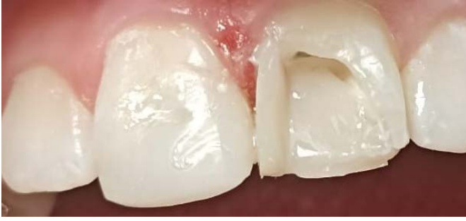
Resim 5. Maksiller santral dişlere uygulanan kompozit rezinin inkremental tekniğe göre uygulanması

mental teknik ile kompozit rezin (Filtek Ultimate, 3M™ ESPE™, ST Paul, ABD) kullanılarak restorasyon gerçekleştirildi (Resim 5).