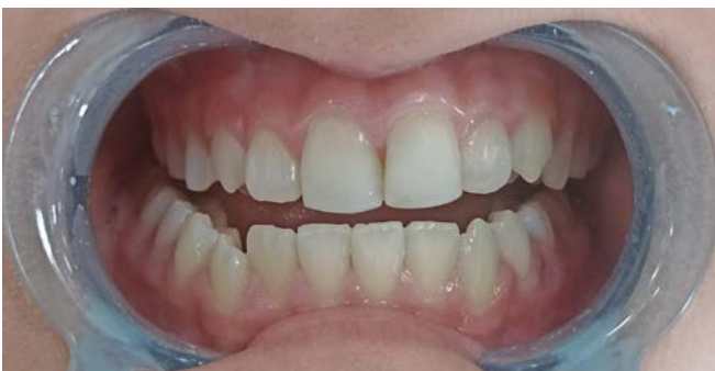
Resim 7. Maksiller santral dişlerin 1.aydaki klinik kontrollerine ait intraoral görüntü

1.ay (Resim 7) ve 3.aydaki (Resim 8) klinik kontrollerde diş, soğuk teste pozitif yanıt gösterdi.