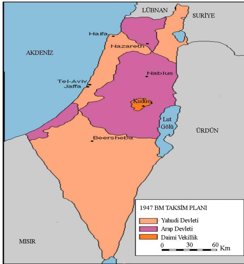
Harita 2. BM Taksim Planı (Mid East Maps, 2023)

Teşkil edilen Filistin Özel Komitesi, yaptığı inceleme sonucunda Birleşmiş Milletler Genel Kurulu’na azınlık raporu ve çoğunluk raporu olmak üzere iki belge sunmuştur. Azınlık raporunda, herhangi bir ülkeden bağımsız bir Filistin ülkesinin yaratılacağı, başkentinin Kudüs olacağı ve Arap-Yahudi devletlerinden oluşan bir bileşime sahip olacağı belirtilmiştir. Çoğunluk raporu ise Filistin topraklarının Arap Devleti, Yahudi Devleti ve Kudüs bölgesi olmak üzere üç ayrı bölgeye bölünmesini ve bu bölgelerin iki yıl içinde bağımsız olmasını önermiştir (Harita 2).