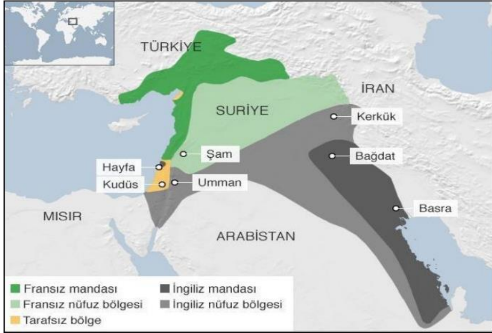
Harita 1. İngiltere ve Fransa arasındaki Sykes-Picot Anlaşması (Vatan Gazetesi, 2021)

1916 yılında David Lloyd George'un İngiltere Başbakanı olarak atanmasıyla, Filistin'de İngiliz varlığının tesis edilmesine daha fazla önem verilmeye başlanmış ve devam eden süreçte 2 Kasım 1917'de İngiltere Dışişleri Bakanı Arthur James Balfour tarafından Balfour Deklarasyonu yayımlanmıştır. Balfour, Uluslararası Siyonist Hareketi lideri Lord Rothschild'e bir mektup göndermiştir. Bu mektupta şu açıklamaya yer verilmiştir: "Majesteleri Hükümeti, Filistin'de Yahudi ırkı için bir ulusal yurt kurulmasına sempati ile bakmakta olup bu amaca ulaşılabilmesi için her türlü çabayı sarf edecektir." Balfour Deklarasyonunda İngiltere, Filistin'de bir Yahudi yurdu kurulması için çalışma sözü vermiştir. Bu deklarasyon siyasî Siyonizm'in kuruluş belgesi olarak değerlendirilmektedir (Goldschmidt & Davidson, 2018, s. 366).