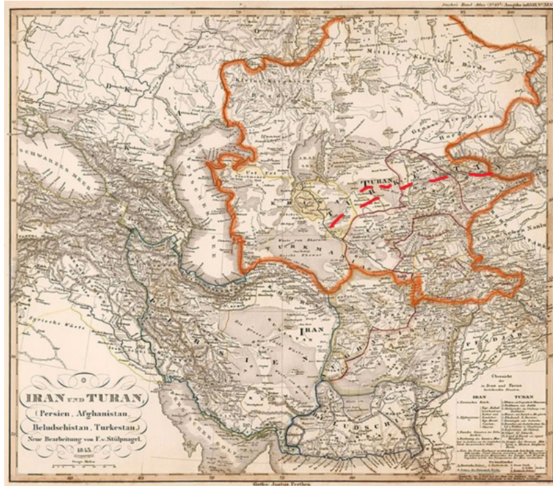
Harita 1. İran ve Turan Haritası.

II. Dünya savaşından sonra şekillenen iki kutuplu dünyanın Doğu Blokunu oluşturan SSCB'nin kendi iç dinamikleri sonucunda özellikle 1970'li yıllardan sonra zayıflaması ve nihayetinde Ekim 1991'de dağılması ile bağımsızlıklarını kazanan devlet veya toplumların bir kısmının Türklerden oluşması, birdenbire Kafkasya ve Türkistan'ın Anadolu Türklerinin odak merkezi haline gelmesine zemin hazırlamıştır. Özellikle söz konusu dönemde, tek bağımsız Türk devleti olan Türkiye Cumhuriyeti'nde bazı siyasetçilerin ve aydınların bağımsızlıklarını kazanan Türk Cumhuriyetlerini şaşkın bir şekilde karşılamaları dikkati çekmektedir. Bu süreçte SSCB'den bağımsız hale gelen Türk devletlerini tanımlamak için birtakım kavramalar yaygın olarak kullanılmıştır. Bunlar; Türkî Cumhuriyetler, Orta Asya Türk Cumhuriyetleri, Orta Asya Türkleri, Türk Cumhuriyetleri ve Dış Türkler gibi.