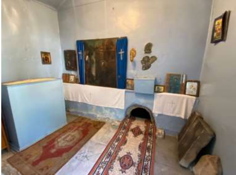
Görsel 9: İstanbul Balat Aya Taksiarhi Kilisesindeki Zuloapetra -Delikli Taş.