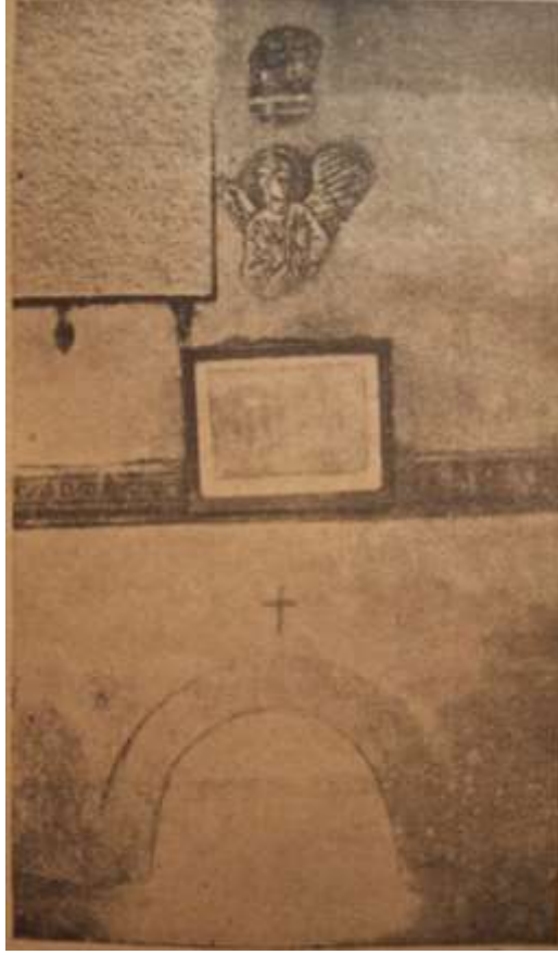
Görsel 7: İstanbul Balat Aya Taksiarhi Kilisesindeki Zulopetra -Delikli Taş (Kefalidu, T., 1943:7).