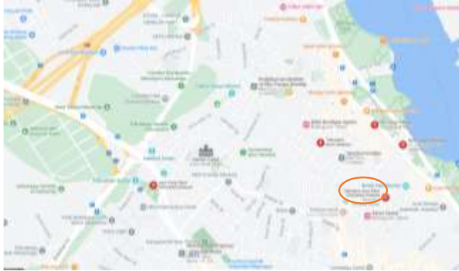
Görsel 2: İstanbul Balat Aya Taksiarhi Kilisesi

Aya Taksiarhis Kilisesi, İstanbul'un Fatih ilçesine bağlı Balat semtinde yer almaktadır (Görsel: 3). İstanbul'un tarihi semtlerinden olan Balat Haliç'in güney kıyısına konumlanmıştır. Tarihi Yarımada'yı çevreleyen surlarda bulunan yirmi kapıdan biri de eski adı "Palation" olan Balat Kapısı'dır (De Carbo gnano'dan aktaran Yılmaz, Ö.2018: 6). Fatih ilçesi Ayvansaray Mahallesi'nde 296 pafta 1880 ada 1 parselde, Ayan caddesi Tamburacı Sokak ile Aynalı Dükkân Sokağı'nın kesiştiği yerde, Ayios Stratis Rum Ortodoks ya da diğer adıyla Taksiarhes Kilisesi içinde tek örnek olarak iki farklı ayazma bulunmaktadır. Biri Aya Nikolaos Ayazması diğeri ise Zulopetra Ayazması'dır. Ayios Nikolaos Ayazması 10.11.1973 yılında tescillenmiştir. 7502 numaralı kararda kilise ile tescillenen sayılı ayazmalardandır (Ordu, M. 2021:74).