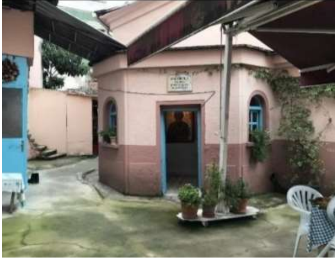
Görsel 5: İstanbul Balat Aya Taksiarhi Kilisesi'nde Ayios Nikolaos Ayazma görünümü,2020 (Ordu, M. 2021:77)