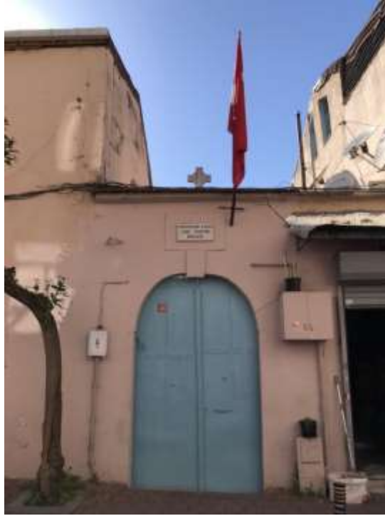
Görsel 3: İstanbul Balat Aya Taksiarhi Kilisesi ( https://kulturenvanteri.com/tr/yer/taksiarhes-rum-kilisesi-balat/#15.13/41.03073/28.947018- )