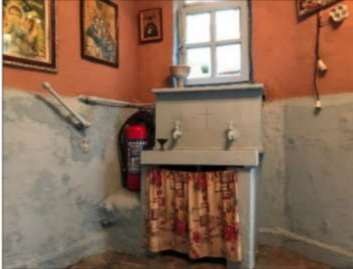
Görsel 11: İstanbul Balat Aya Taksiarhi Kilisesindeki Zulopetra Ayios Nikolaos Ayazması, su tekne ve haznesi (Ordu, M.,2020:77)