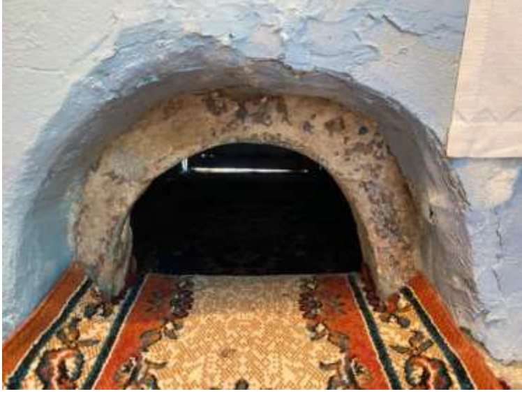
Görsel 8: İstanbul Balat Aya Taksiarhi Kilisesindeki Zulopetra -Delikli Taş.