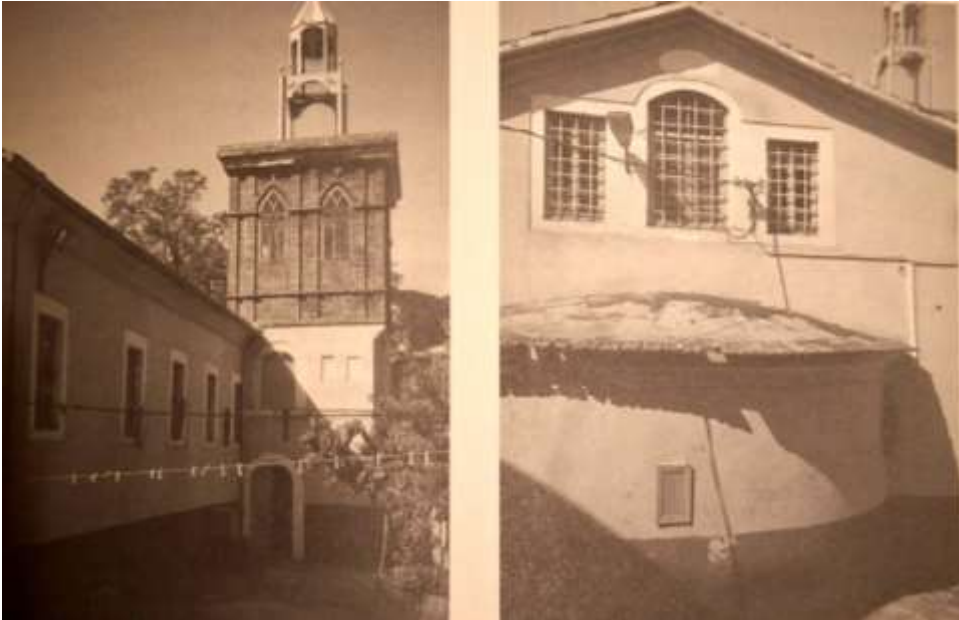
Görsel 6: İstanbul Balat Aya Taksiarhi Kilisesi (Karaca, Z. 2018:303).