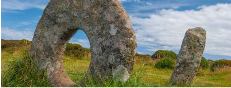
Görsel 1: Men-an-Tol: İngiltere, Madron, Cornwall

Diğer yandan ise delikli taşlar, kutsal veya şifa verici olarak tanımlanmaktadır. İngiltere'de Madron'a bağlı Cornwall bölgesinde sık ziyaret edilen Men-an-Tol olarak adlandırılan delikli taş bulunmaktadır. Efsaneye göre taştaki delikten geçen insanlar hastalıktan kurtulur. Çocuklar, üç kez çıplak geçirilerek tüberküloz ve raşitizmden iyileşirler. Yetişkinlerin romatizmadan kurtulmak için delikli taştan dokuz kez geçmeleri gerekir (Koç, 2022:96).