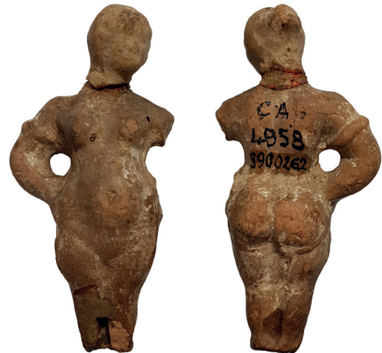
Fotoğraf 4. Ayakta, çıplak hamile kadın figürünü – Louvre Müzesi / Figurine of a standing, naked pregnant woman – Louvre Museum (Env/Inv. CA 4958 – H: 6,5 cm) – Photo: G.Şakar.

Bu tip kadın figürinlerinde çoğunlukla hamileliği gösteren özellikler belirtilmiş olmakla birlikte bazı örneklerin obez kadınları temsil ettikleri de önerilmektedir. D. Burr-Thompson, Atina Agorası’nda bulunan ve kontekst verileri üzerinden Klasik Dönem’in sonuna tarihlenen bu tipteki kadın figürinlerini “ obez bir kadının vücut hatlarına sahip, müşterilerini eğlendirmek için komik jest ve mimikler yapan karikatürize yaşlı hetairalar ” olarak yorumlamıştır (Burr-Thompson, 1954, s. 90-91, 106: Lev. 21). Gerçekten de Atina’daki erken örneklerde, vücut görünümü bir hamileden çok yaşlı ve obez bir kadına benzemektedir. Smyrna örneklerinin çoğunda görülen şişkin ve yuvarlak karın, dolgun ve büyük göğüsler, ellerin sırtı destekleyecek şekilde bele konmuş olması ve kasık bölgesinde belirtilmiş olan ve muhtemelen hamilelik sırasında oluşan çatlakları gösteren çizgiler (Foto. 4-5), Smyrna örneklerinin daha çok hamile kadınları betimlediklerini dolayısıyla tıpkı Baubo figürinleri gibi hamilelik ve doğurganlık ile ilişkilendirilebileceklerini göstermektedir.