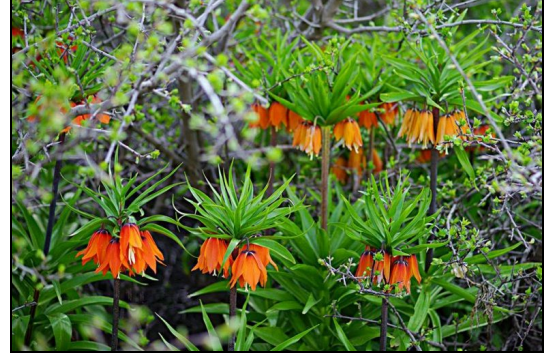
Şekil 2. Hasanova Köyü (Karlova)'nde görülen Fritillaria imperialis (Elçi 2015).

kaynak oluşturmaktadır (Şekil 2). İlin sahip olduğu yaylalar, Merkez ilçede Bingöl (Tavla) Yaylası, Şerafettin (Mürgemir) Yaylaları, Genç'te Çötele (Çotla) Yaylası, Karlova'da Hırhal ve Çavreş Yaylası, Kiğı'da Kiğı Yaylası, Meydan Yaylası, Seyit (Seydi) Kasım Yaylası ile Dağın Düzü Yaylaları, Yedisu'da Güngörsün Yaylası ve Adaklı'da Kârer Yaylası şeklinde sıralanabilir.