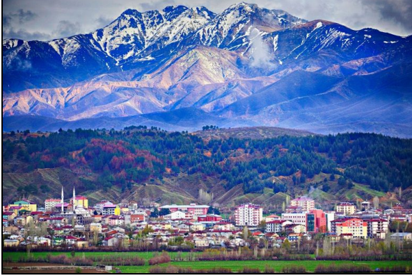
Şekil 5. Genç ilçe merkezinden bir görünüm (Elçi 2015).

bağlı 5 adet belde, 88 adet köy ve 15 adet mahalleye sahiptir. 2000 yılı genel nüfus sayımı verilerine göre kırsal nüfus 130 269, ilçe merkezleri nüfusu 123 470 olup, nüfusun % 51.34'ünün köylerde yaşadığı, 2013 yılı adrese dayalı nüfus kayıt sistemine göre ise kırsal nüfus 114 958, ilçe merkezleri nüfusu ise 150 556 olduğundan kırsal nüfusun % 43.29'a gerilediği görülmektedir (Çizelge 2) (TÜİK 2014). Kent merkezinden sonra nüfusu en fazla olan Genç ilçesi içerdiği doğal ve kültürel özellikler ile turizm potansiyeli açısından değerlendirilebilecek özelliklere sahiptir (Şekil 5).