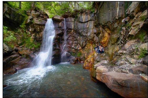
Şekil 3. Dallitepe Şelalesi (Cafran Bölgesi)'nden bir görünüm (Elçi 2015).

Bingöl'ün dağlık yapısı nedeniyle mağara ve şelale oluşumları da dikkat çekmektedir. Örneğin, Yayladere ilçesinin Kalkanlı Köyü yakınlarında bulunan Kalkanlı Köyü Mağaraları ile Karlova ilçesinin Kübik Köyü yakınlarındaki Kübik Mağarası'nın duvarları çeşitli figürler ile oyularak süslenmiştir. Merkeze bağlı Uzundere Köyündeki Çır Şelalesi ve Cafran Bölgesi'nde bulunan Dallitepe Şelalesi (Şekil 3), Karlova ilçesinde Çatak Köyündeki Aşağı Çatak ve Yukarı Çatak Şelaleleri doğa turizmi açısından önemli alanlardır. Bingöl merkez Oğuldere Köyü'nde bulunan ve çeşitli doğa olaylarının aşındırması sonucu oluşan Buban Bacaları, Solhan ilçesi Hazarşah Köyü sınırları içerisinde yer alan Yüzen Adalar (Şekil 4) ve Bingöl Dağları'nın Karlova ilçesinde yer alan Koğ (Kale/Kala) Tepesi'nde gerçekleştirilen Güneşin Doğuşu Festivali turistlerin görmek istedikleri alanlardır.