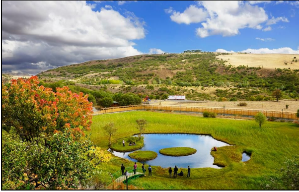
Şekil 4. Solhan Yüzen Adalar tabiat anıtından bir görünüm (Elçi 2015).