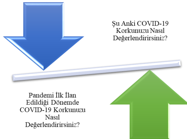
Şekil 1. Hemşirelerin pandemi ilk ilan edildiği dönemde ve şu anda hissettiği COVID-19 korku düzeyi

Hemşirelerin bireysel ve klinik özelliklerine göre COVID-19 Korkusu ve Merhamet Yorgunluğu Kısa Ölçeği'nin Karşılaştırılması Tablo 2'de gösterildi. Bu araştırmada; COVID-19 Korkusu Ölçeği toplam puan ortalaması 20.62±7.52 (7 -35 puan) olarak belirlenirken araştırma kapsamındaki hemşirelerin yaşadığı COVID-19 korkusunun orta düzeyde olduğu görüldü. Ayrıca araştırma sonuçlarımıza göre MY-KÖ, MY-KÖ İkincil Travma Alt Boyutu ve MY-KÖ Mesleki Tükenmişlik Alt Boyutu toplam puan ortalaması sırasıyla 62.93±27.63 (13–130 puan), 23.14±11.41 (5–50 puan) ve 39.78±17.66 (8–80 puan) olarak saptandı. Araştırma kapsamındaki hemşirelerin deneyimlediği merhamet yorgunluğunun orta düzeyin altında, yaşadıkları travmanın ve hissettikleri mesleki tükenmişliğin orta düzeyde olduğu belirlendi.