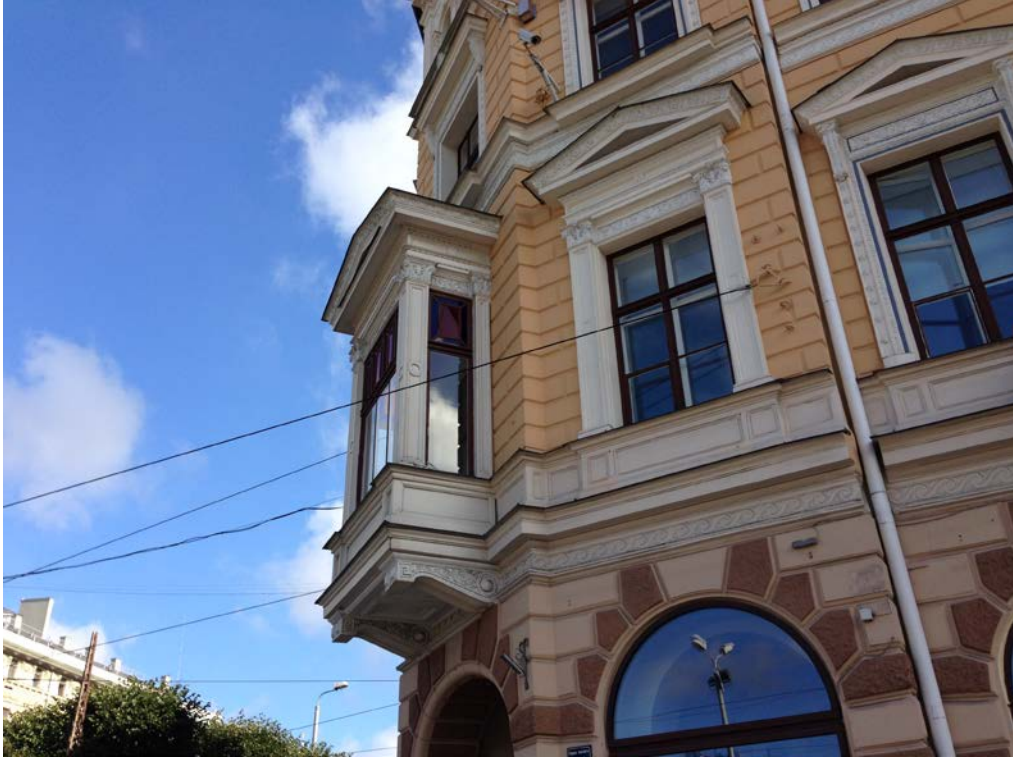
Fot.1: Cumba evrenselleşmiş mekan tasarımının önemli bir parçası (Letonya'nın başkenti Riga'da köşe parselde yer alan bir yapıdaki cumba) olmakla birlikte, farklı toplumlarda farklı kullanımlar ve algılar yaratabilir.