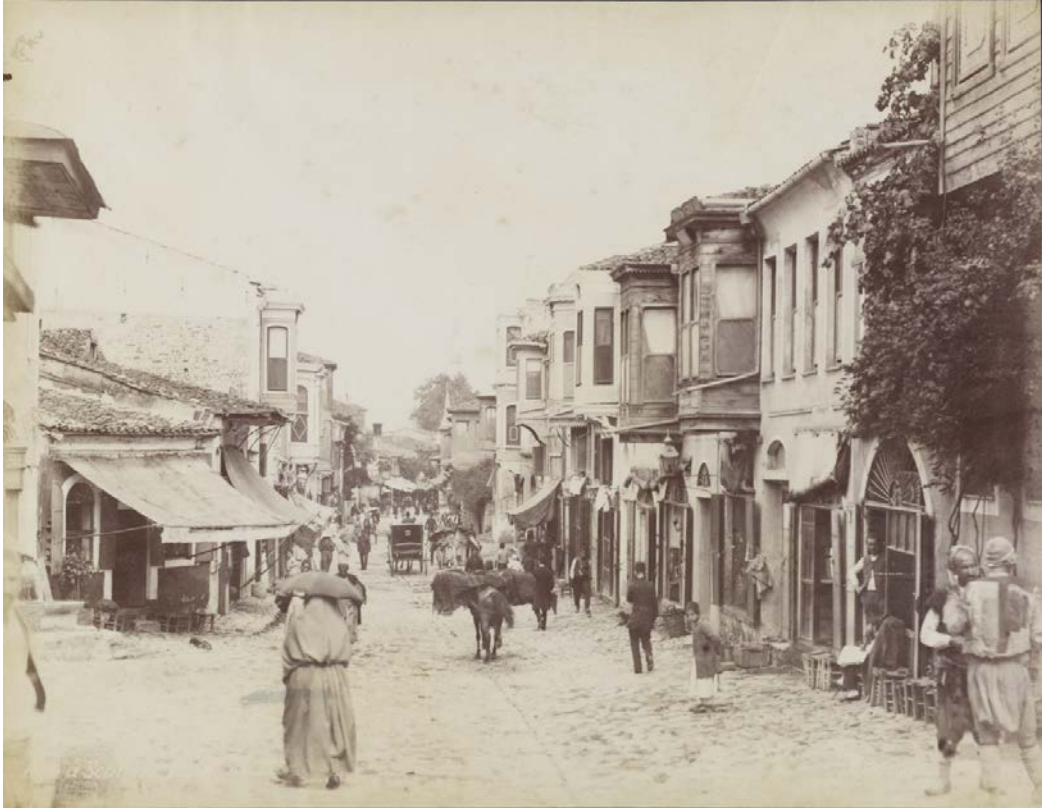
Fot.: 3 Berggren'e ait bir fotoğrafta 1871 yılında Üsküdar'da cumbalı evlerin sıralandığı bir sokak ( http://eski.istanbulium.net/post ).

Bu durumda cumba ya da şahnişinin ortaya çıkmasını sağlayan düşünsel süreç genelleşmiş kültürel bir tercih ile ilişkiliyse de; ev yaptıracak kişinin maddi durumuyla da doğrudan ilintili hale gelmektedir. İnşaat sırasında cumba uygulamalarını ön görülen ölçüler, yazılı kurallar ve vergi sistemi belirlemektedir. Bununla birlikte, özellikle ahşap konutlarda yapı cephesinden "çıkıntı" yapan öğeler olarak cumba ve saçak yasağı yangın için önlem alınmasına ilişkin kararlar bağlamında değerlendirilebilir. Bu tip kararların belgelerde birbirini izlemesi, alınan önlemlerin başarısızlığa uğradığını göstermektedir. Bilinen ilk cumba yasağı 29 Haziran 1559 tarihidir. Ancak bu yasağın 1539 yılına kadar geri çekilmesi mümkündür. 1559 tarihli yasağın 1539 tarihli yasağı emsal gösterir. Bununla birlikte, benzer yasaklamalar 1817 yılına kadar sürmüştür. Hem mimarlık hem de şehircilik açısından çok katı hükümler içeren ve bunları tekrarlamamanın ötesine gidemeyen mimari yapı talimatları, örme taş duvarlı, cephesinde cumbalar ve büyük çıkma saçaklar bulunmayan bir konut modeli çizmekten de (Yerasimos, 1999, s. 7); 19. yüzyılın ikinci yarısından sonra kesin bir yasaklama yerine, cumbanın yapılış biçimlerine ilişkin kurallara özellikle yangınlardan korunmak için bağlı kalınarak, genelde cumba inşasına devam edilmiştir.