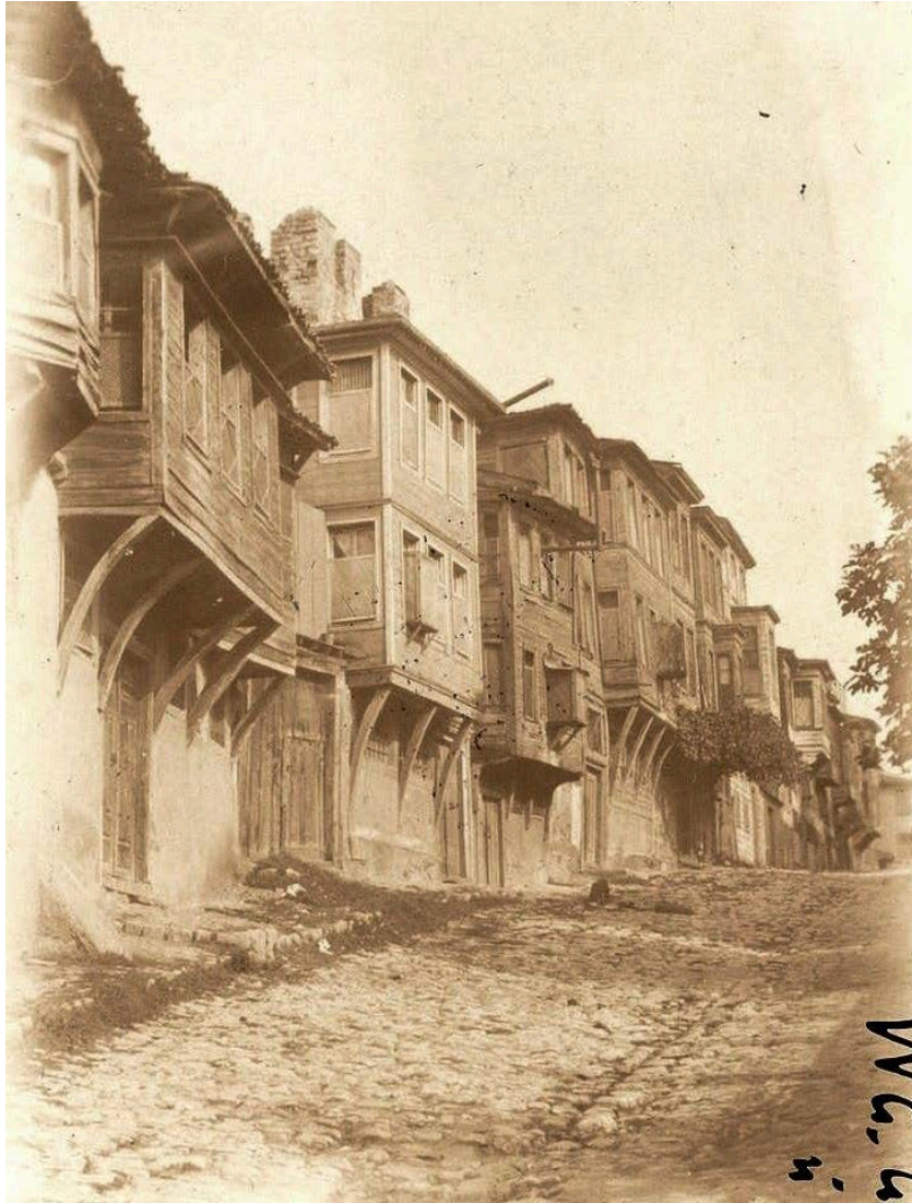
Fot. 2: Soğukçeşme Sokağı ( http://eski.istanbulium.net/post )

Bununla birlikte, 1859 yılına ait “Zokaklara Dair Nizâmnâme”nin 32. bendinde; şahnişin ve balkon gibi sokak üzerine yapılan çıkmalara çiçek saksıları veya sandıklar konulmasının yasak olduğu belirtilmiştir (Seyitdanlıoğlu, 2010, s. 128). Ayrıca, bu ve sonrasında 1863 yılında hazırlanan Turûk ve Ebniye Nizâmnâmesi’nde de; “şahnişin ve üzeri kapalı balkon” ifadesinin yer almasına rağmen “cumba” teriminin kullanılmadığı tespit edilmekle birlikte, nizâmnâmelerin çıktığı yıllarda yazılan arşiv belgelerinde “cumba” teriminin kullanıldığı görülmektedir. 1863 yılında Turûk ve Ebniye Nizâmnâmesi’nde, binanın sokak yüzündeki çıkıntılar ve çıkmalar için uyulması gerekli kurallar içinde her sokak genişliğine uygun olarak çıkmaların ölçüsü belirlenmiştir. “1 arşin 18 parmak”tan “18 parmak”a kadar dört ölçüde önerilen çıkma uzunlukları dikkat çekicidir (Seyitdanlıoğlu, 2010, s. 143). Ölçülerin, yapıların inşasından dolayı alınacak vergileri de belirlediği nizâmnâmeler, yapıların projeleri ve başvuru dilekçelerinin teslim edilmesini zorunlu tutmuştur. 1863 yılında vergi verecek kalfalar veya kalfası olmayan bina sahiplerinden inşa edecekleri binanın mevkisini, ne tür bir yapı olduğunu ve yapılacak her bir katın yüzey ölçüsünü, cumba ve şahnişinlerin uzunluklarını bildiren dilekçeyi Ebniye İdaresi’ne vermeleri istenmiştir (Ergin, 1995, s. 1689).