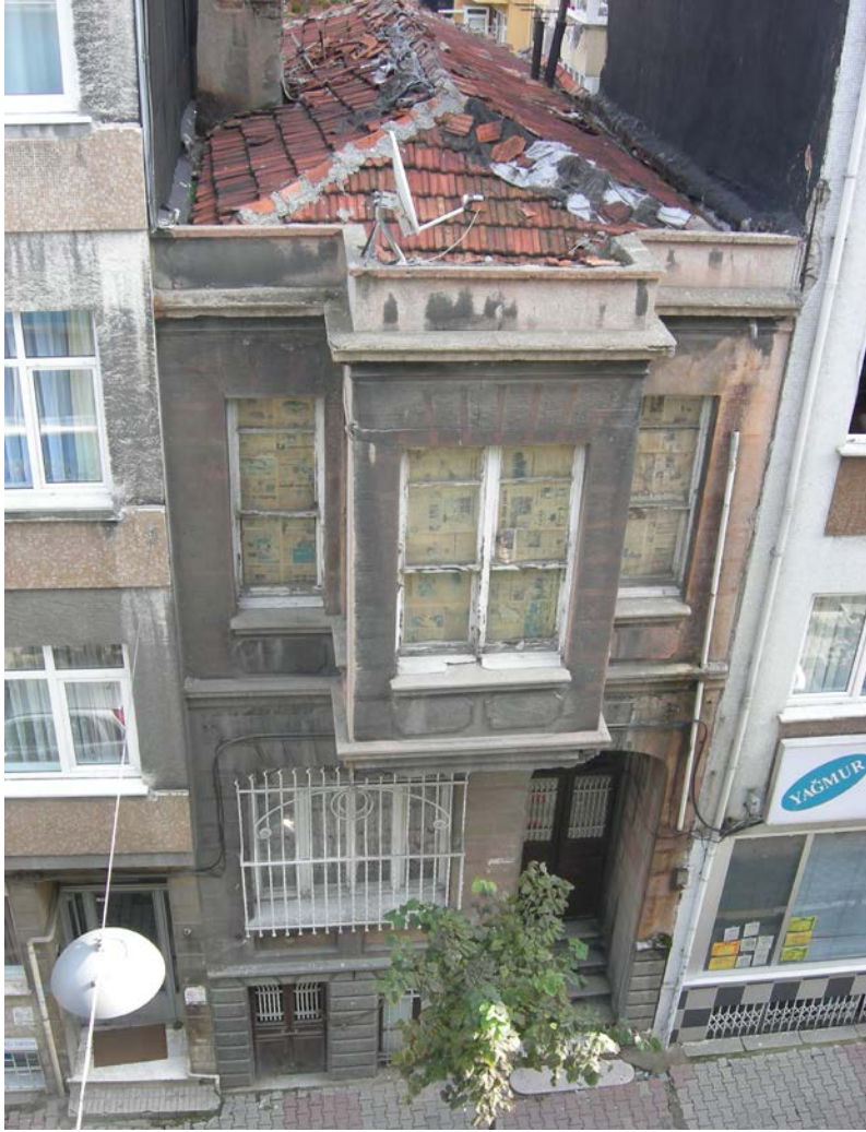
Fot.: 5 İstanbul Pangaltı Türkbey Sokak'ta cumbalı kâgir bu konut örneği günümüzde mevcut değildir

en güzel köşelerinden biri olarak tanımlar (Evin, 1999, s. 162). Cumbaların süslemeleri ile yapı cephesine basit geometrik bir “çıkma”dan daha fazla anlam katmış olduğu bu tariflerle anlaşılabilir. Abdülhak Şinasi Hisar, “Boğaziçi Yalıları” adlı eserinde cumbanın anlatımını daha da şiirselleştirir. Yazar, “Bir bina vücudundan bir kısmının böyle sokağa çıkmış ve uzanmış olması size bilmem ki dokunaklı gelmez mi? Ben bunda bir çocuk saffetini ve bir nebat hali gördüğüm için, şimdi hatırlaması bile rikkatime dokunuyor” (Hisar, 2006, s. 53) diyerek, yapıdan dışarıya çıkma yapan ögenin yapıdan ayrı bir öge değil, tam tersine yapının saf ve doğal bir parçası olması dolayısıyla etkilendiğini dile getirir.