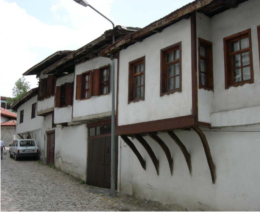
Fot.: 4 Safranbolu’da cumbalı ahşap karkas konut örneklerinden biri