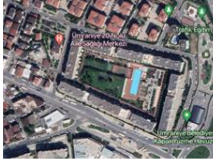
Resim 12: Evidya konutları, 2004, Çekmeköy (Url 9)