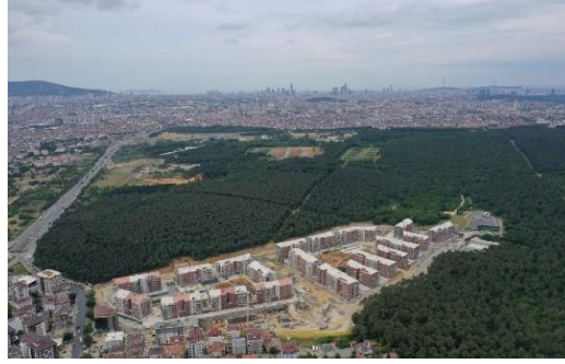
Resim 17: Çınar konutları, 2021, Çekmeköy (Url 14)

Şekil 16'da kamusal kimlikli spor alanının kentsel merkezde özelleştirilerek bir firmanın iki konut kulesi ve bir adet ofis kulesine dönüştürülmüş yaklaşık 241 bin m 2 'lik inşaat alanının uygulaması yer almaktadır. Kentsel ölçekte spor alanının dönüşümüne uygun örnekte yoğun bir yapılaşma noktasında yer alan karma yapının sınırlarında gerek fiziksel gerekse sosyal geçirimsizlik sorunları gözlemlenmektedir. Kentin en çok açık kullanılabilir alana gereksinimi olan bölgesinde yapı alanının önünde, yıkılarak yeniden yapılan bir koruma alanı da (Likör Fabrikası) mevcuttur.