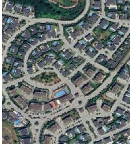
Resim 11: Ormanada villaları 2014, Zekeriyaköy (Url 8)

Şekil 10 görselinde Sarıyer Huzur Mahallesi sınırları içinde polis lojmanları olarak bilinen Emlak Konut GYO ortaklığında gerçekleşen projede, 55 bin m 2 'lik konut alanında 958 konut ile ayrıca ticari birimler, okul ve koru alanları yer almaktadır. Proje kentsel merkezde düşeyi sınırlı etkinlikte daha çok yatayda gelişen bloklardan oluşmaktadır. Hemen tüm kamusal işlevlerini kapayan sınırlarında karşılamakta projenin 2024 de yaşama geçmesi beklenmektedir. Kentsel merkezde Yeni Levent adı ile birlikte 'Country yaşam' sloganları ile öne çıkmıştır.