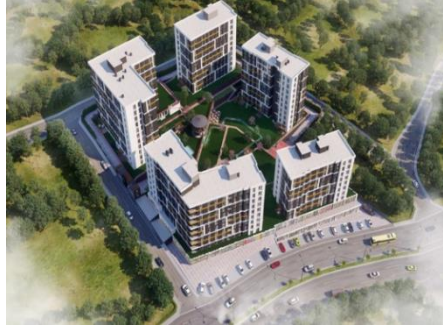
Resim 13: Sapphire Hill konutları, 2020, Pendik

Şekil 12'de yapı bloklarının bütünselliğinde içe kapanan, kesintisiz bir iç ve dolayısıyla kamusal mekâna sahip olan, çevresel ilişkisinde aralıklı bölümleri hemen hemen bulunmayan konut grubu uygulaması 9 katlı ve toplam 100 bin m 2 inşaat alanına sahiptir. Toplam 473 bağımsız bölüme sahip olan proje sosyal ortak yaşamı bütünüyle kendi içinde bisiklet yolları da dahil kurgulanmıştır.