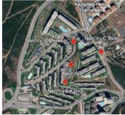
Resim 15: Narcity konutları 2007, Maltepe (Url 12)

Şekil 14'te ise lüks ve yüksek gelir gruplarına yönelik Şehrizar konakları yer almaktadır. Kentsel merkezde çevreye ilişkin görsel düzey olanakları kadar güvenli ve sosyal donatılarının içsel kullanımı dikkat çekmektedir. Yine Emlak Konut GYO ortaklığında 2014'de tamamlanan projede 208 bağımsız bölüm ve yaklaşık 180m 2 'den 650m 2 'ye kadar değişen çözümler bulunmaktadır.