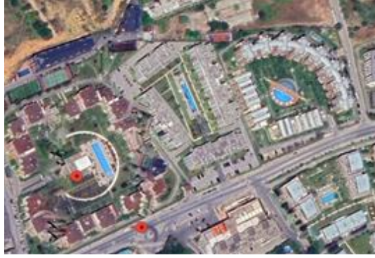
Resim 8: Kemerburgaz evleri, Göktürk, 2000'ler, Eyüp (Url 5)

Şekil 7'de ise Manzara adaları bir bankanın (İŞGYO) gayrimenkul yatırım ortaklığında gerçekleşen karma yerleşim birimi bulunmaktadır. Yaklaşık 315 bin m 2 'lik ofis ve konutlardan oluşan ve alışveriş merkezi de bulunan düşeyde etkin kuleleri ile kendi içinde kamusal alanlarını üreterek sosyal sınırlarını da oluşturan yapıllı çevre, yine kentsel merkeze yakın bir alanda bulunmaktadır.