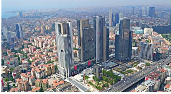
Resim 16: Torunlar center, 2012-2016, Şişli (Url 13)

önlemler nedeniyle toplu konut uygulamasının kamusal sınırlarda yer alan sosyal donatılarında gözeneklerin azaldığı görülmektedir.