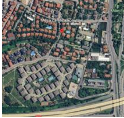
Resim 14: Şehrizar konakları, 2014, Üsküdar (Url 11)