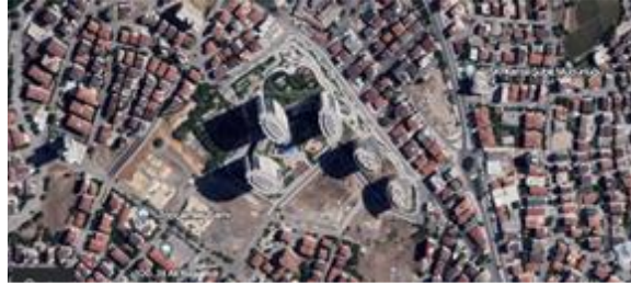
Resim 7: Manzara adaları, karma yapı (2015) Kartal (Url 4)

Şekil 6'da bulunan görselde İstanbul'un Ümraniye bölgesinden ayrılarak Ataşehir ilçesinde kurulan İstanbul Finans Merkezi (2016-2023) döneminin kentsel ölçekte önemli değişim süreçlerinden birisi olmuştur. 1,5 milyon m 2 'lik ofis alanları ağırlıklı yapılaşmasının yanı sıra alışveriş merkezi ve oteli de bulunmaktadır. Türkiye Varlık Fonu bu yapımın ortağıdır. Anadolu oto yolu'nun hemen diğer yanında 2009 yıllarında başlanan düşeyde etkin akıllı bina sloganları ile var edilen konut ağırlıklı ofis, otel ve kongre merkezlerinden oluşan Meridyen yerleşim birimi, aynı bölgede geniş alanlardaki uygulamalardan biri olmuştur. Kule ve tek bina eksenli yapılaşmaların