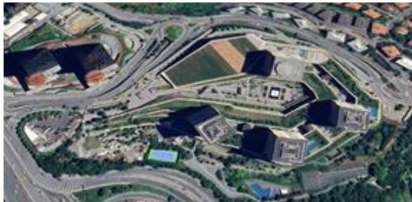
Resim 5: Avm, karma yapı, (2013) Zincirlikuyu (url 2)

Şekil 4'te yer alan yapı dokusunun kentsel merkeze yakın ve 2007 ve 2008 yıllarında tamamlanan alışveriş merkezi ve hemen yanında yapılan sitesi gecekondü yerleşim bölgesi