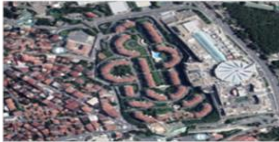
Resim 4: Avm, gecekondü, yerleşim, (2007) İstinye (url 1)