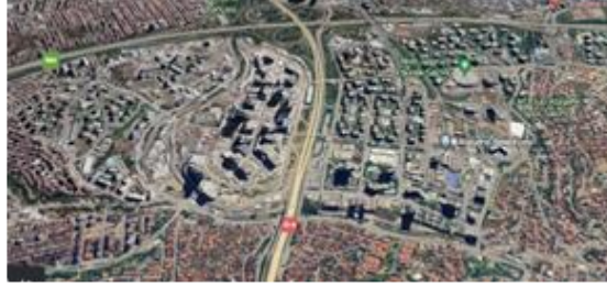
Resim 6: Meridyen, Finansent,(2009/2016) Ataşehir

Şekil 5'te bulunan zorlu avm binası, kamusalığın kentsel merkezde özelleştirilmesinin örneğidir. Yaklaşık 100 bin m 2 'yi geçen toplam inşaat alanı İstanbul'un en merkezi noktalarından birinde yeni merkezi iş alanlarının başlangıcında 2013'de açılmıştır. Düşeyde ve yatayda etkin mimarisi ile rezidans, otel, ofis, ticari ve gösteri alanlarından oluşan karma yapı gerek görsel gerekse getirdiği ek yükü açısından dramatik sonuçlara yol açması nedeni ile çokça tartışılmıştır.