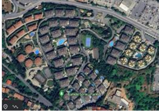
Resim 9: İstinye vadi Konakları, (2009-12) , Sarıyer (Url 6)

Şekil 8 ve 9'da birbirine benzeyen farklı konut yerleşimleri görülmektedir. Söz konusu projeler dönemin farklı yıllarında ortaya çıkan uygulamalarıdır. Şekil 8'de bulunan Mesa Kemerburgaz ve Yankı evleri az katlı ya da çok katlı grup ve müstakil konut örnekleri ile kapanan yerleşimlerin en karakteristik örneklerindedir. Sınırlarında arayüz oluşturması da söz konusu değildir. Kamusal mekânların kendi yerleşim alanlarında nerdeyse geçirimsiz çözümler