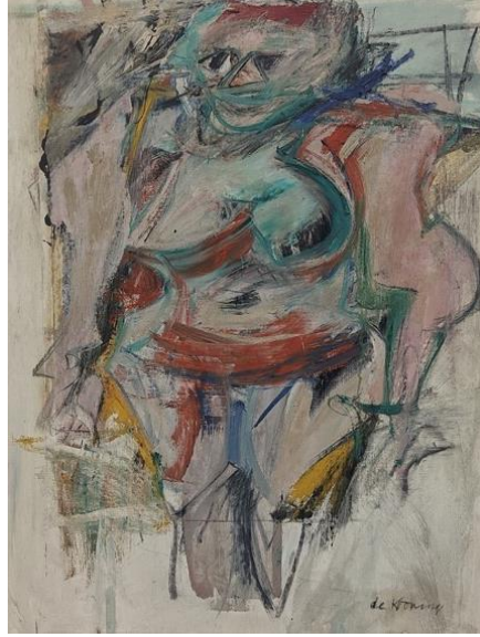
Resim 5: Woman Standing - Pink, 1954-5 Willem de Kooning

Tunalı'ya (2010, 55) göre, sanat yapıtlarının temelinde sanatçının algıladığı ve kavradığı gerçekliği yorumladığını ve bu yorumların sanat eserlerinde kendine özgü bir şekilde yansıtıldığını belirtir. Sanat eserleri, sanatçının gerçeklikle ilgili bilgisini ifade etme araçlarıdır.