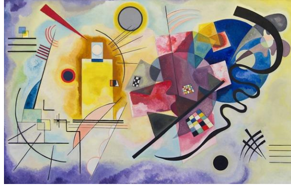
Resim 1: Vasili Kandinsky, Sarı, Kırmızı, Mavi, 1925, t.ü.y.b. 127x200 cm, Pompidou Merkezi, Paris.

biçim üzerinden, aksiyon üzerinden kendini ifade etmeyi amaçlamıştır. Buradaki soyut sanattan farklı olarak soyut dışavurumculuk daha fazla aksiyona, harekete ve enerjiye dalsa da içsel dünyanın daha fazla aksiyonla aktarılmasına hizmet eden bir yapıda olduğu söylenebilir.