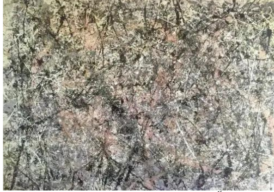
Resim 3: Numara-I, 1950 'Lavanta Kokusu', Tuval Üz. Yağlıboya, Enamel ve Alüminyum Boya, (221x299.7 cm), Washington De, Ulusal Sanat Galerisi

Örneğin, Jackson Pollock'un "Lavanta Kokusu" adlı 1950 tarihli eseri, hareket ve enerjiyi yansıtan bir eser olarak görülebilir. Ancak, aynı zamanda karmaşık ve anlaşılmaz bir biçimde de yorumlanabilir. Bu dışavurumcu çalışma, soyut akımın tanınan eserlerinden biridir. Boyalar damlatılmış, akıtılmış ve fırlatılmıştır. Ayrıca, derinlik oluşturmak için birçok biçimi üst üste kullanarak atmosferik bir deneyim yaratılmıştır. Sanatçı zaman zaman boya serpererek, resmin içinde eylemi, hareketi ve hareketi benimsemiştir. Resimlerini yaparken bir dans içinde gibidir ve vücudu resimlerin içine dahil etmiştir. Renk olarak, resimlerinde kontrastlar oluşturabilecek zıtlıklara sahiptir ve duygusal titreşimleri vardır. Sanatçı spontan birçok fırça darbesini kullanarak bu biçimleri amaçlı bir kompozisyona hizmet ederek izleyiciye sunmuştur. Sanatçının çalışmaları hikâye içermediğinden izleyiciler için farklı duygusal deneyimlere neden olabilir.