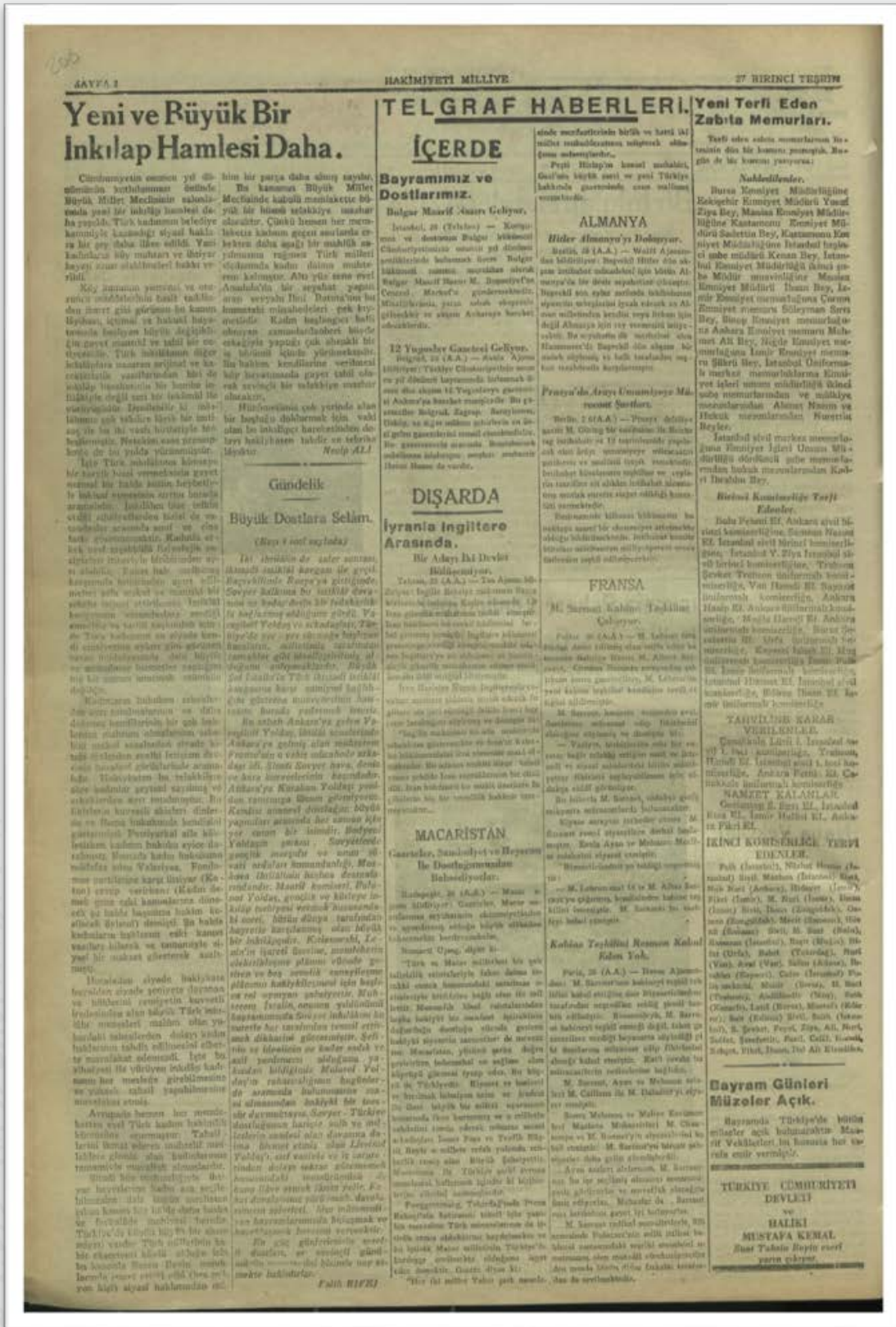
Ek.2: Hâkimiyeti Milliye, 27 Birinci Teşrin 1933.

Özkaya, O. (2023). Şark/Garp, Alaturka/Alafranga Tartışmaları Çerçevesinde Hâkimiyeti Milliye Sütunlarının Siyasal Yaşamdaki Kadın Kurucuları İnkılabı (1930-1934). Selçuk Türküyatı, (Cumhuriyet'in 100. Yılı Özel Sayısı): 473-497. Doi: 10.21563/sutad.1378469