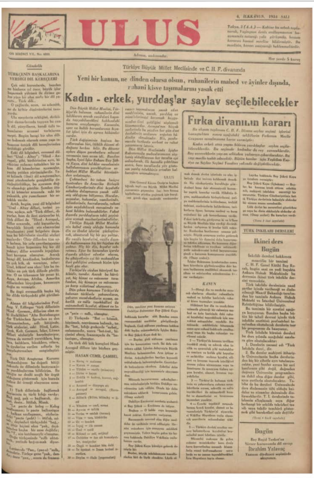
Ek.4: Ullus, 4 İlk Kanun 1934.

Özkaya, O. (2023). Şark/Garp, Alaturka/Alafaranga Tartışmaları Çerçevesinde Hâkimiyeti Milliye Sütunlarından Siyasal Yaşamdaki Kadın Hakları İnkılabı (1930-1934). Selçuk Türkiyat, (Cumhuriyet'in 100. Yılı Özel Sayısı): 473-497. Doi: 10.21563/sutad.1378469