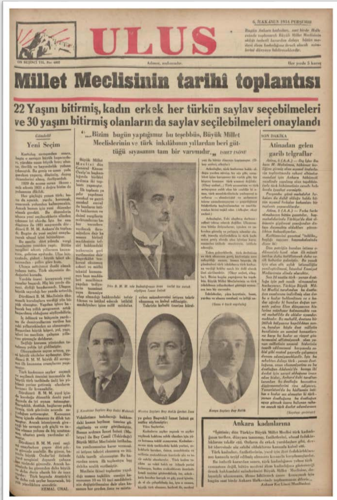
Ek.3: Ulus, 6 İlk Kanun 1934.

Özkaya, O. (2023). Şark/Garp, Alaturka/Alafranga Tartışmaları Çerçevesinde Hâkimiyeti Milliye Sütunlarından Siyasal Yaşamdaki Kadın Hakları İnkılabı (1930-1934). Selçuk Türkiyat , (Cumhuriyet'in 100. Yılı Özel Sayısı): 473-497. Doi: 10.21563/sutad.1378469