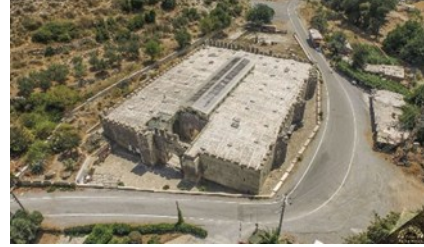
Şekil 13. Antalya Alara han [46].

I. Alaeddin Keykubat tarafından yaptırıldığı kitabesinden anlaşılan han Alara Çayı'na ve Alanya Kalesi'ne yakın konumlanmıştır. Kalenin çevresi de yerleşim alanına dönüşmüştür. Kitabesine göre 1231 yılında yaptırıldığı anlaşılan han 46x35 m. ölçülerinde dikdörtgen planlıdır. Kapalı avlulu han, sultan han plan şemasına benzemektedir. Ancak sultan hanlarında açık avlu ve etrafında kapalı konaklama bölümleri varken Alara Han'da odalar ve avlu iç içe tasarlanmıştır. Yapıdaki ana malzeme kesme taştır, bazı yamaca bakan bölümlerinde moloz taş kullanılmıştır. Dar bir koridor çevresinde eyvan ardından oda gelecek şekilde bir düzen oluşturulmuştur [45]. Günümüzde aktif işlevi bulunmayan hanın geçmiş dönemde eğlence merkezi olarak kullanıldığı bilinmektedir. Çağdaş müdahale uygulanan kervansarayın koridor kısmının üzerine örtü yapılmış, Şekil 13'te görülmekte olan metal strüktür üzerine polikarbon malzeme kaplanarak onarım işlemi gerçekleştirilmiştir.