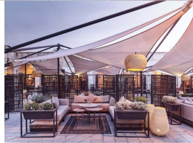
Şekil 10. Gaziantep Hışvahan [40].