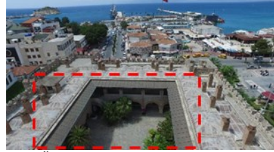
Şekil 6. Aydın Öküz Mehmet Paşa kervansarayı [24]

Kuzeyde 21.80, güneyde 21.47, doğuda 28.51 ve batıda 28.47 m.dir. Kervansaray girişinde revaklara ulaşmadan önce sağ ve solda tonozla örtülü girintili bölüm ve bu bölümlerin kemerle birbirine bağlandığı görülür [33]. Bu kervansarayda ahır bulunmamaktadır ve wc alanı binadan çıkıntı olarak, mazgal pencerelerle inşa edilmiştir. Ayrıca kervansarayın avlusunda sekizgen havuz bulunmaktadır [34]. Kervansaray günümüze otel işlevinde kullanılmaktadır. Şekil 6'daki görselde işaretlenmiş olan; avlusuna, yeni işlevindeki gerekliliklerden kaynaklı olabileceği düşünülen kısmi güneş kırıcılar eklenmiştir.