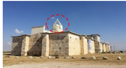
Şekil 7. Konya Zazadin han [36].

Selçuklu döneminde yaşamış Sadeddin Köpek bin Muhammed tarafından yaptırılan han Aksaray-Konya yolunda, Konya'ya 20 km. uzaklıkta bulunmaktadır. Sadeddin adının farklı tarzda söylemi olan Zazadin olarak da adlandırılmaktadır. Han I. Alaüddin Keykubat zamanında yapılmaya başlanmış ve Gıyaseddin Keyhüsrev zamanında yapımı tamamlanmıştır. Dış ve iç portalde olmak üzere toplam iki kitabesi olan hanın portalleri siyah ve beyaz mermerden inşa edilmiştir. Devşirme taş olan spolien taş çok yerde kullanılmış ve mescidinin giriş bölümünün üstünde bulunduğu görülmüştür. Hanın diğer yapısal özellikleri de kuzeydeki beden duvarının üç kademeli olması ve kışlık bölümdeki kubbenin planda asimetric olması olarak gösterilebilir [22]. Günümüzde müze olarak ziyaret imkanı bulunan yapıda zaman zaman organizasyonlar da yapılabilmektedir. Yapı kubbesinin restorasyon çalışmalarına başlandığında sekizgen kalıntıları ortaya çıkmıştır ve Şekil 7'de bahsedilen kubbe işaretlenmiştir. Restore edilirken çelik strüktürel taşıyıcı üzerine polikarbon malzemeye örtü yapılarak bütünleme işlemi uygulanmıştır.