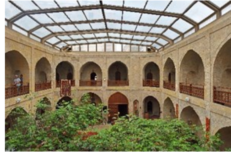
Şekil 9. Azerbaycan Kasım bey kervansarayı [39].

İki mertebeli kervansaray olarak da adlandırılan bu yapı günümüzde Mugam Kulüp/Mugam Restoran olarak da bilinmektedir. Muğam olarak kullanılan bu kelime Azerbaycan müziği olarak bilinir. Kasım Bey ve varislerine Şirvaşah Halilullah tarafından hediye edilen kervansaray 15. yüzyılda inşa edilmiştir. Deniz ticareti varlığından dolayı denize bakan cepheden giriş yapılıdır. Aynı aks üzerinde başka bir giriş daha vardır. İç planı kare, avlusu sekizgen planlıdır. Balkonlu odalarla çevrili avlusuyla iki kat şeklinde inşa edilmiştir. Odalardan balkona açılan ve avluya bakan revaklar sivri kemerlerle oluşturulmuştur. Kervansarayı korunma açısından güneydoğu cephesinde kuleleri bulunmaktadır [38]. Unesco Dünya Miras Listesi'nde yer alan yapı otel ve restoran olarak işlev görmektedir. Yapının avlusunda Şekil 9'da görüldüğü üzere açılır- kapanır olacak şekilde örtü sistemi eklenmiştir. Çelik strüktür üzerine cam örtü malzemesi kullanılarak ışık kırıcı işlev görmesi sağlanmıştır.