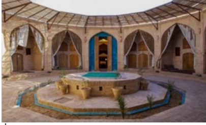
Şekil 11. İran Zein-o-din kervansarayı [41].

16.yüzyılda inşa edilen yapı Yezd şehrinde bulunmaktadır ve Afganistan sınırına yakın konumdadır. İran'da bulunan yuvarlak formu üç kervansaraydan biridir. Tarihi İpek Yolu üzerinde bulunan kervansaray İran Kültürel Miras ve Turizm Örgütü'nün mülkiyetindeyken üç kardeş tarafından restore edilmek istenmiştir. 12 yıllığına kiralanarak yapı 32 odalı misafir ağırlamak için yenilenen ve orijinal tarzına uygun tasarlanan bir yapı olarak hizmet vermektedir. UNESCO tarafından 2006 yılında en iyi yenilenen yapı olarak ödül verilmiştir. Yuvarlak biçimli dar bir koridor üzerinde konumlanan odalardan bazıları kapılarla, bazılarıysa perdeyle ayrılmıştır [41]. Günümüzde de otel olarak işlev gören yapının Şekil 11'de gösterilen resimde iç avlusuna güneş kırıcı olarak eklenmiş ahşap yüzeyli ve metal taşıyıcı yapı ögesi bulunduğu görülmektedir.