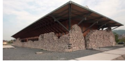
Şekil 3. Kocaeli Kazıklı kervansarayı [25]

16. yüzyıla tarihlendirilen kervansaray Kocaeli ili, Gölcük ilçesinde bulunmaktadır. Osmanlı döneminde cihatlar için kullanılmış olan kervansaray Kanuni döneminde inşa edilmiştir. Kazıklı olarak isimlendirilmesinin sebebi seyahatnameler, haritalar ve minyatürlerde Kazıklı Derbendi olarak geçen yapının bulunduğu mevkiden kaynaklı olduğu düşünülebilir [28]. Yapının restorasyonu yapılmadan önce elde edilen veriler yetersiz kalmıştır. 2008-2010 senelerin arasında yapı kalıntıları korunmuş, yapıya zarar vermeden yeni bir ek yapılması uygun görülmüştür (Şekil 3). Yapının mevcut ayakta kalabilen duvarların iç kısmından 2,5 metre uzaklıkta yeni bir strüktür oluşturulmuştur [29]. Fuaye, çok amaçlı salon mekanlarının bulunduğu kervansaray kültür merkezi (sosyal alan) olarak restore edilmiştir. Ahşap ve çelik strüktürle restore edilmiş kervansarayın üst örtüsü ahşaptır.