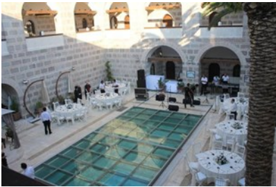
Şekil 5. İzmir Kanuni kervansarayı [35]

İzmir kentini Çeşme ilçesinde, deniz kıyısına yakın konumlanmış olan kervansaray kitabesine göre 1528 yılında Kanuni Sultan Süleyman tarafından yaptırılmıştır. Yapı kare planlı olup 18,40 x 18,60 m. ölçülerinde avluya sahiptir. Kervansaraya güneybatı cephesinden yapının dışına taşan bir eyvanla girilmekte ve iki sıra revaklarla çevrili avluya ulaşılmaktadır. Kitabesi eyvanın üzerinde bulunmaktadır. Revaklı bölümlerden geriye kalan alanlarda ahır ve merdiven bulunmaktadır. Revaklardan ulaşılabilen oda sayısı on iki olmakla beraber üzerleri tonozla örtülüdür [32]. Günümüzde otel olarak işlev gören kervansarayın avlusu da restoran olarak kullanılmaktadır. Daha sonra işlev ihtiyacından kaynaklı Şekil 5'te görülmekte olan avluya havuz eklenmiştir. Yapıya ayrıca metal servis merdiveni ve avludan üst kata ulaşım için metal seyyar asansör uygulanmıştır.