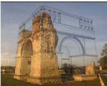
Şekil 2. Çağdaş reintegrasyon [27]

Kent silüetinin oluşmasında önemli bir yeri olan bazı yapılar vardır. Ancak bu yapıları restore etmek, özgün hali kadar etki yaratmayacak durumda olabilmektedir. Örneğin yedi Dünya Harikasından biri olan Halikarnas Mozolesi geçmişte bulunduğu konumuyla Bodrum'un silüetini önemli ölçüde etkilemektedir. Ancak kalıntıların büyük bir bölümü British Museum'da yer almaktadır ve replikası da yapılmamıştır. Bu yapının rekonstrüksiyonunun yapılmasından Şekil 2'de gösterildiği gibi restitüe edilebilecek kadarını, bulunduğu konum ve ölçülerde gün ışığı almayacak ortamda ışık ve gölgelerle resmetmek suretiyle çağdaş sunum tekniği vasıtasıyla yapıyı yaşatmaya devam edilmesinde yardımcı olacaktır. Benzer örnekleri Augustus Forumu, Sezar Formu ve Kolezyum'da görülebilmektedir [26].