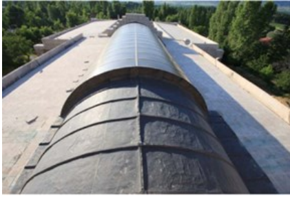
Şekil 8. Tokat Mahperi Hatun kervansarayı [37].

Kitabesine göre Sultan Melike Mahperi Hatun tarafından 1238-39 yıllarında yaptırılan kervansaray Amasya-Tokat yolu üzerinde inşa edilmiştir. Yazlık ve kışlık bölüm olarak yaptırılan kervansarayı kışlık bölümü ölçüleri 19.50x28 m, yazlık bölümü ise 33x34 m'dir. Yazlık bölümü avluyu çevreleyen revaklar ve revakla sıralanmış odalardan, kışlık bölümü iki sıra paye ile üç bölüm olarak inşa edilmiştir. Pandantif örtülü kervansaray kesme taştan yapılmıştır ve planı dikdörtgendir. Gösterişli bir giriş kapısı olan kervansarayı söz konusu kapısı Anadolu Selçuklu dönemi kervansaray yapılarındaki kapıları andırmaktadır. Günümüze beden duvarları ve portali sağlam gelmiş olan kervansarayı çatısı tümüyle yıkılmıştır. Restore edilen çatısının kışlık bölümdeki avlunun üzerine tekabül eden bölümü hafif malzeme olması açısından polikarbonat malzeme ile kemerli eyvan üzerine tekabül eden bölümü ise kurşun malzemeyle kaplanmıştır ve Şekil 8'da bu malzeme farkını görmek mümkündür [37]. Yapı günümüzde kafe, restoran olarak işlevlendirilmiştir.