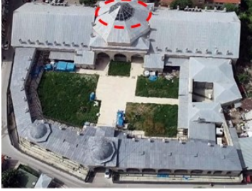
Şekil 4. Edirne Ekmekçizade Ahmet Paşa kervansarayı [22]

görmüştür [31]. Karma tipteki bu kervansaray Vakıflar Müdürlüğü'nün mülkiyetinde olup, günümüzde şehir tiyatrosu ve sergi alanı olarak işlev görmektedir. Alüminyum strüktür malzemesiyle cam kaplama malzemesi kullanılarak zarar görmüş çatısı onarılmıştır.