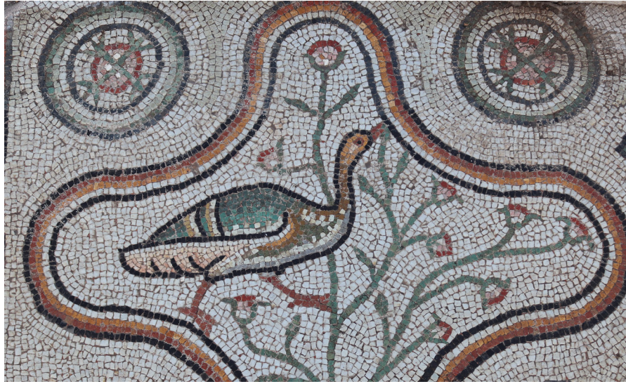
Resim 13 Khora Kilisesi Orta Nefindeki Kuğu Figürlü Panonun Köşelerinde Bulunan Haçvari Motifli Rozetler (Hadrianopolis Kazı Arşivi).