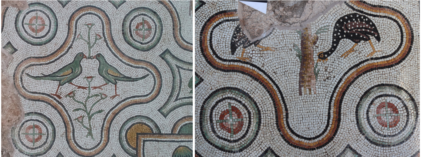
Resim 8 Khora Kilisesi Orta Nefindeki Beç Tavuğu Figürlü Panonun Köşelerinde Bulunan Haçvari Motifli Rozetler (Hadrianopolis Kazı Arşivi).

merkezini oluşturan düğümlü madalyonların içinde, haçvari motifli rozetler işlenmiştir (Res. 9). Stilistik açıdan neredeyse birebir benzer özellikteki haçvari motifli rozetleri, Erken Bizans Dönemi'ne tarihlenen birçok zemin mozağında görebilmek mümkündür. Dıbsi Faraj'da, surların dışındaki kilisenin (Eglise Hors-les-murs) 429 tarihli güney nef zemin mozağında, Misis-Mopsuhestia