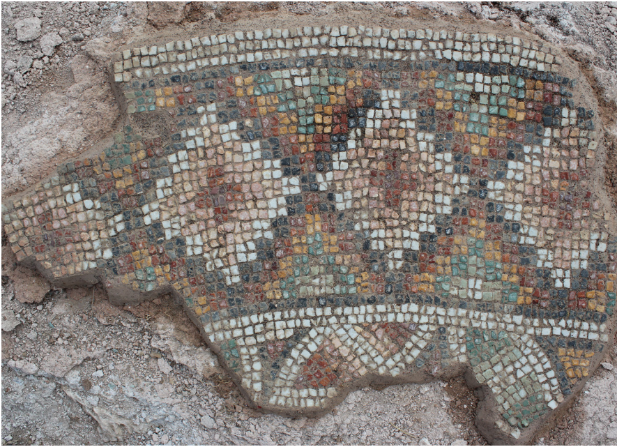
Resim 17 Kuzeybatı Nekropol Kilisesi Bema Mozağindeki Haç/Artı Motifine Benzer Geometrik Motifler.