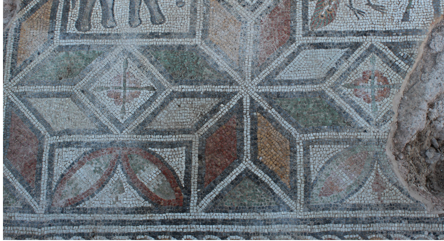
Resim 10 Khora Kilisesi Güney Nefindeki Haçvari Motifli Rozetler (Hadrianopolis Kazı Arşivi).

Rozetlerdeki haçvari motifin ikinci tipi, biçim ve ölçü bakımından birinci tipe oldukça benzerdir. İkinci tipteki farklar; kolların tomurcuk şeklinde sonlanması, kolların birinci tipe kıyasla hafif kıvrımlı yapılması ve kollarının tessellatum tabakasından hafif derinde yer alması şeklinde sıralanabilir. Bu tipteki haçvari motifli rozetler hem kuzey hem de güney nefteki hayvan figürlü panoların kenarlarında yer alan rhombusların içinde işlenmiştir (Res. 10). Bu tipi özel kılan en önemli özellik, kolların zemin mozaiği yüzeyinden hafif derinde yapılmış olmasıdır (Res. 11). Erken Hıristiyanlık ve Bizans Dönemi'ne ait