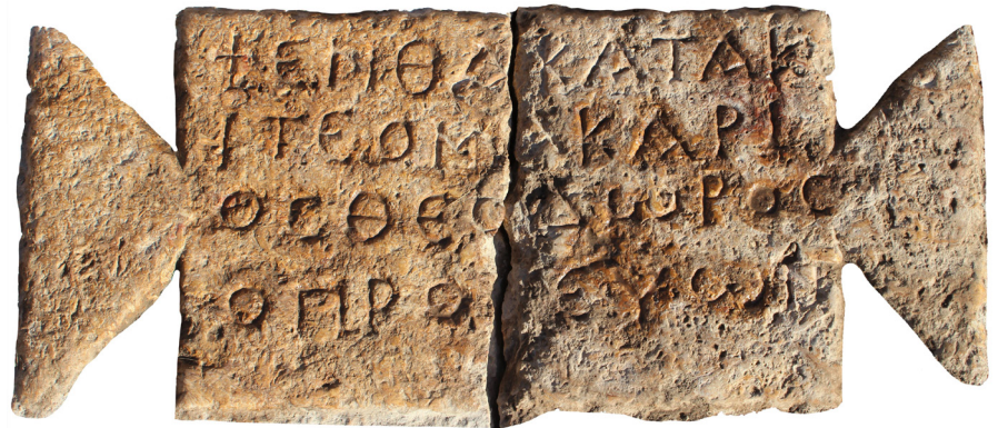
Resim 6 Kuzeybatı Nekropol Kilisesi'ndeki Rahip Theodoros Mezarının Yazıtı.

tanımlanabilir (Gökalp 2017: 146). 427'deki yasağa rağmen, 5. yüzyıl ortası ile 6. yüzyıl ilk çeyreği arasında tarihlenen, Khora Kilisesi zemin mozağında