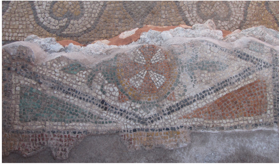
Resim 4 Dört Nehir Kilisesi Güneydoğu Kapı Eşiği Mozağindeki Malta Haçı Motifi.

Hadrianopolis zemin mozaikleri içerisinde en dikkat çekici haç motifi, Dört Nehir Kilisesi'nin güneydoğu kapısı zeminindeki mozaik panoda yer almaktadır (Res. 4). Kilisenin ikinci inşa evresi zeminini süsleyen bu mozaik