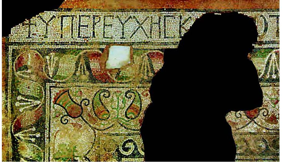
Resim 5 Khora Kilisesi Orta Nef Mozaik Yazıtındaki Latin Haçı Motifi (Patacı - Laffı 2019: fig. 104).

Nekropol Kilisesi'nde de bir Latin haçı motifi bulunur, ancak bu zemin mozağında değil, Rahip Theodoros'a ait bir mezarın, kapak taşındaki yazıtın başlangıç kısmında işlenmiştir (Res. 6). Monokrom koyu gri renkli olan haç, kollarının küçük çubuklar şeklinde sonlanmasıyla Potent Haç olarak da