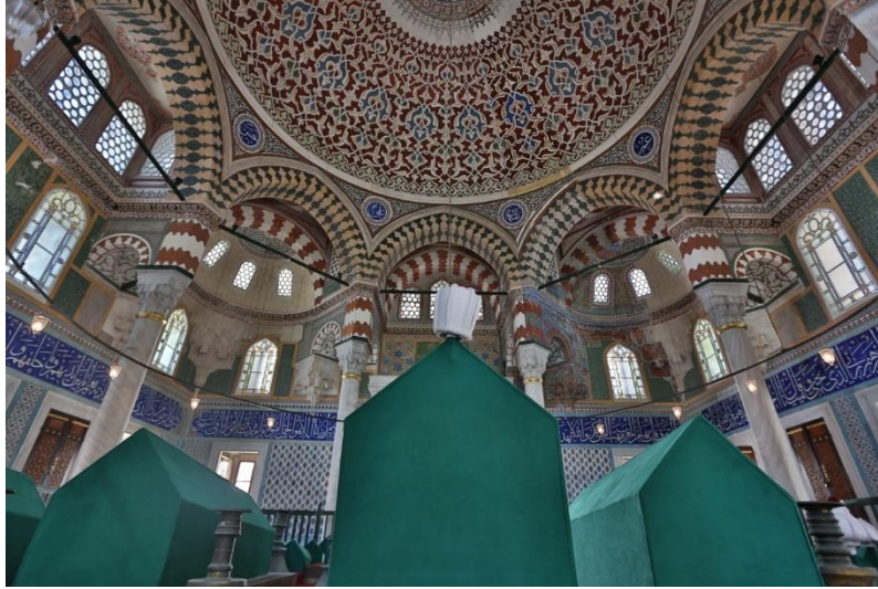
Görsel 4. II. Selim Türbesi'nin içinden görünümü.

Aynı dönemde hat levhalarının yanı sıra yine Kazasker Mustafa İzzet Efendi tarafından kubbenin merkezine Kur'an-ı Kerim'deki Nur Suresinin 35.ayetinin bir bölümü yazılmıştır (Görsel 3). Söz konusu ayet mealen “Allah göklerin ve yerin Nûr'udur. O'nun nûru, içinde ışık bulunan bir kandil yuvasına benzer. O ışık bir cam içindedir, cam ise, sanki inci gibi parlayan bir yıldızdır; bu ne yalnız doğuda ve ne de yalnız batıda bulunan bereketli zeytin ağacından yakılır” şeklindedir.