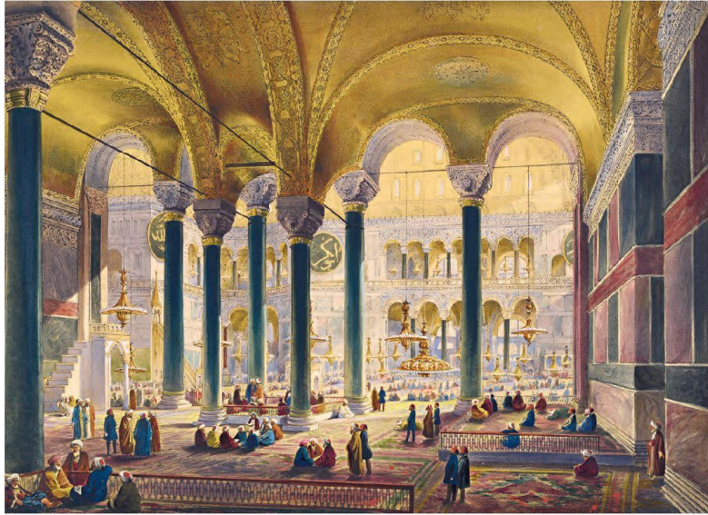
Görsel 2. Abdülmecid Dönemi Ayasofya Cuma Cami İçi.

Ayasofya'nın dışına eklenerek külliyesini oluşturan yapıların yanında caminin içine birçok dekoratif öğe de eklenmiştir. IV. Murat döneminde Ayasofya'ya mermerden yeni kürsü yaptırılır. Sultan III. Ahmed zamanında ise yeni bir hünkâr mahfili yaptırılır. Kitap okumayı çok seven I. Mahmud zamanında ise yine caminin içinde -güney kısmına- bir kütüphane eklenmiştir.