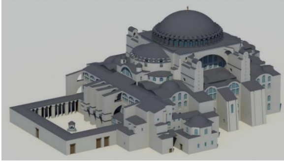
Görsel 6. Solda Hagia Sophia Kilisesi Canlandırması.

Konstantinopolis'te bir kilise olarak inşa edilen Ayasofya'nın değişimi, bir Hristiyan mabedinin bir Müslüman mabedine dönüşümü olarak, yapıda Hristiyan değerlerinden ziyade Müslüman değerlerinin okunmasıyla gerçekleşmiştir. Bu bağlamda yapıda yapılan tüm düzenlemeler yapıyı iyileştirme, onarma ve İslam medeniyet tasavvuru değerlerini açığa çıkarma şeklinde olmuştur.