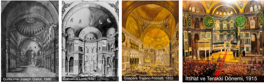
Görsel 5. Osmanlı Dönemi Farklı Dönemlerindeki Ayasofya Mozaiklerini Gösteren Çizimler Soldan itibaren; Guillaume-Joseph Grelot,1680/ Cornelius Loos, 1701/ Gaspare Trajano Fossati, 1852/ İttihat ve Terakki Dönemi, 1915.

mozaiklerinin çoğu, 19.yüzyıla kadar kaldıktan sonra badanalananak örtülmüştür. Apsis yarım kubbesinde yer alan Meryem ve Çocuk İsa mozaiği ise hiçbir zaman örtülmemiştir (Kleinbauer vd., 2004). Söz konusu mozağin bırakılma sebebi olarak Kâbe'deki tüm put ve suretleri yok eden Hz. Muhammed'in Hz. Meryem'e hürmetinden dolayı Meryem ve Çocuk İsa suretini korumuş olduğu iddiası (King, 2016) gösterilir. Buna karşın bir diğer görüş ise fethin ilk döneminden itibaren mozaiklerin üzerinin kireçle örtüldüğü üzerinedir. Pandantiflerdeki meleklerin de kanatları korunup yüzleri silinmiştir. Fetihden sonra değişik zamanlarda yapılan restorasyonlarda da tonozların üstündeki süslemeler, geometrik ve figürsüz desenler yeniden yapılmıştır.