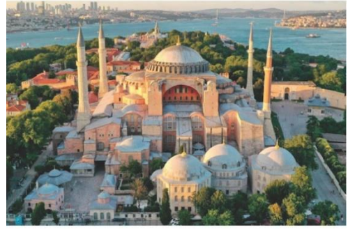
Görsel 7. Sağda Ayasofya Külliyesi.

İslam Medeniyet Tasavvuru'nun en baş değeri olan 'tevhit' kavramı gereği mabette yapılan her düzenleme hep bu değerle örtüşmektedir. Yani külliye bazında bakıldığında tüm kompleksin yapılarından bezeme unsurlarına kadar hep bir bütünün parçası olduğu görülmektedir. Bu durum yapıya biçimsel olarak denge, uyum ve sadelik katarken, soyut anlamda İslam Medeniyet Tasavvurunun manasını yansıttığı görülür. Böylece yapısal formundan bezemelerine kadar her bir değerın dışı vurumu olarak yapıya müdahaleler yapılmıştır.