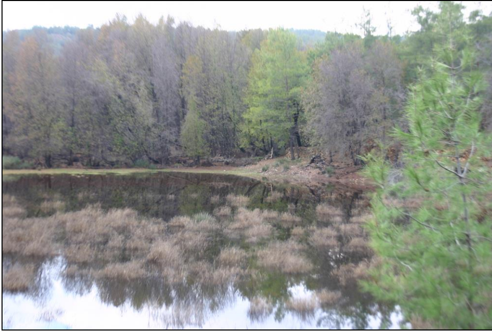
Çalışma alanından bir görünüm (fotoğrafta sığla ve kızılçam orman parçaları ile gölcük ekosistemleri görülmektedir.)

Alanın içerdiği üç farklı parça peyzaj özelliği ve doğal hayat karakterleri (sığla ormanı-su basar ekosistemi, kızılçam ormanı ekosistemi, gölcük sistemleri, narenciye tarım alanları, kaya/kayaçlardan çıkan kaynak suları, makro mantar, bitki, kuş ve memeli hayvan çeşitliliği gibi) bakımından ekolojik anlamda büyük önem arz etmektedir. Özetle çalışma alanının sağlıklı bir doğal yapı arz ettiği ve çevresindeki doğal olmayan tehditlere rağmen doğallığını korumaya devam ettirdiği gözlenmiştir.