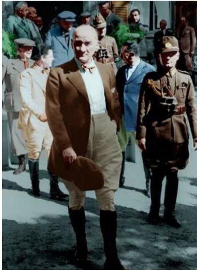
Görsel 3. Atatürk Ege manevralarında (1937) Figure 3. Atatürk in the Aegean maneuvers (1937)

“Açık yakalı beyaz gölekler giyerdi. Kafamda iki klasik fotoğraf var. Birincisi Savarona’nın güvertesinde açık yakalı beyaz bir gömlek ve üstünde örgü, kolsuz süveter, ikincisi traktör üzerinde, altında golf pantolonu ve üstünde açık renk ceket. Bir de ceketsiz, yani yalnız gömlekle çiftlikteki halini hatırlıyorum” (Özgentürk, 2018).