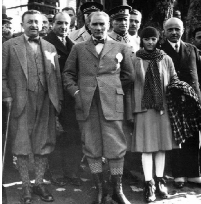
Görsel 2. Mustafa Kemal Atatürk Baltacı Çiftliği'nde. (Yalova, 03.09.1929)