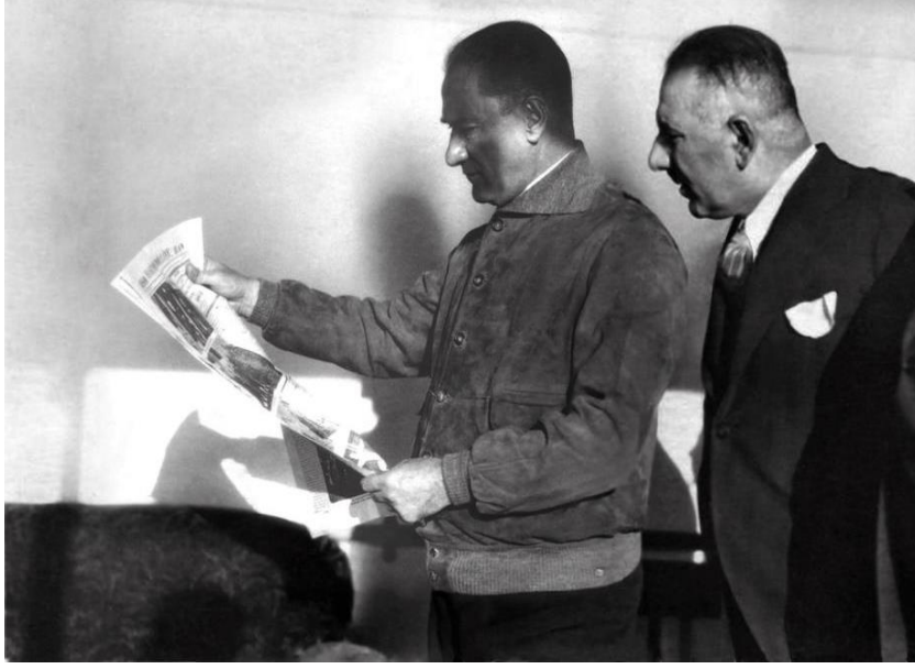
Görsel 5. Atatürk Ege Vapuru’nda, Trabzon’a seyahati sırasında Hakimiyet-i Milliye Gazetesi’ni okurken (27.11.1930)

Figure 5. Mustafa Kemal Atatürk is reading Hakimiyet-i Milliye Newspaper while traveling to Trabzon on the Aegean Ferry. (27.11.1930)