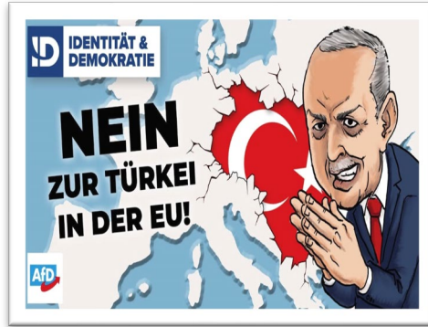
Şekil 3: AB'de Türkiye'ye Hayır!

Türk kimliğinin Avrupa'nın kültürel yapısına yönelik Avrupalı olmayan bir tehdit olarak algılanması bağlamında, aynı grup ya da ülkeden AP milletvekillerinin bölündüğü bazı söylemler tespit edilmiştir (Erdoğan, 2022). Öncelikle, Avrupa Komisyonu, Almanya, Bulgaristan ve Hollanda'dan bazı AP üyeleri Türkiye'nin AB adaylığı konusunda tam olarak aynı görüşü paylaşmamaktadır. Bazı AP üyeleri Türkiye'nin kültür, tarih, medeniyet ve en önemlisi İslam açısından AB üyeliğinden dışlanmasını savunurken, hatta bu bağlamda Türkiye'den "İslami diktatörlük" olarak bahsederken, aynı grup veya ülkelerden diğer AP üyeleri Türkiye'yi daha fazla reform ve dolayısıyla daha fazla fasıl için teşvik etmektedir. 2007-2015 döneminde AP milletvekillerinin Türk kimliği algısı, Avrupa demokratik değerlerine meydan okuyarak Avrupa popülist tarzlarında olduğu gibi sert güç stratejileri ve Avrupa şüpheli söylemlerle sıklıkla safsatalar ve iç içe geçmişlikler kullanarak söylem konularına, ötekileştirmeye ve Türkiye'yi olumsuz anlamda temsil etmeye daha fazla yönelmiştir (Erdoğan, 2022).