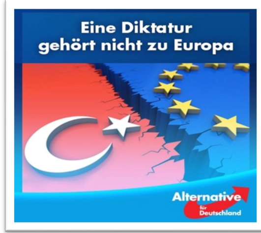
Şekil 1: Diktatör Biri Avrupa'ya Ait Değildir 5

demokratik olmayan uygulamalara işaret etmiştir (Yılmaz, 2016; Balcı & Cicioğlu, 2019, s. 10). Dolayısıyla Avrupalı popülist sağ partiler Türkiye'nin AB üyeliğine (yeni bir hakikat biçimi olarak) karşı çıkarken, öncelikle AB'nin hegemonik söylemi içinde/ aracılığıyla işleyen ana akım partilerin meşruiyetini hedef almakta ve sağ pratiklerin normalleştirildiği ve yeni (çoğulculuk karşıtı, aşırı milliyetçi ve yabancı düşmanı) öznelerin üretildiği yeni bir AB söylemi için çabalamaktadırlar.