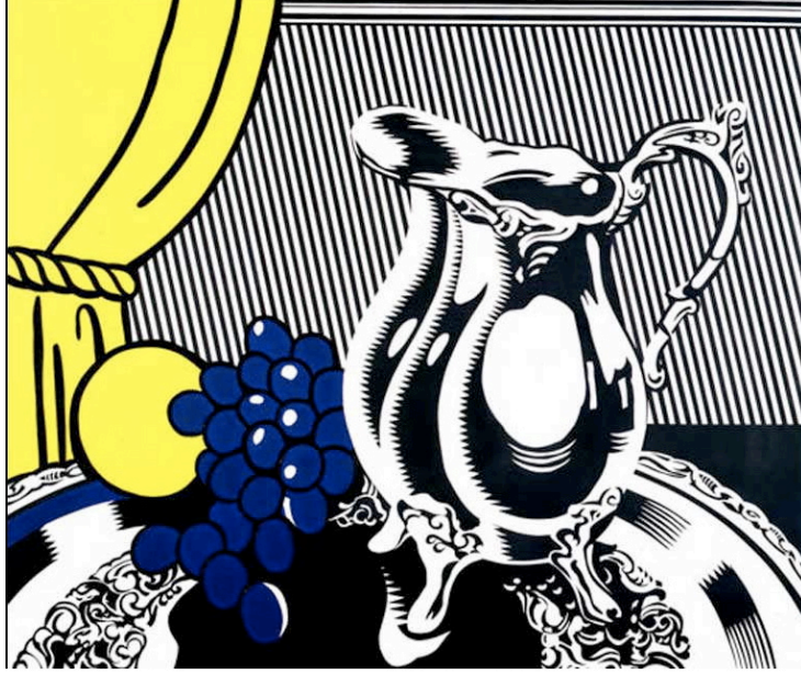
Resim 3, Roy Lichtenstein, Gümüş Sürahi Natürmortu 10