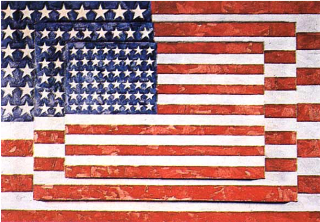
Resim 8, Jasper Johns, “Three Flags”, 1958, Whitney Museum of American Art, 587cmx404cm, New York 15