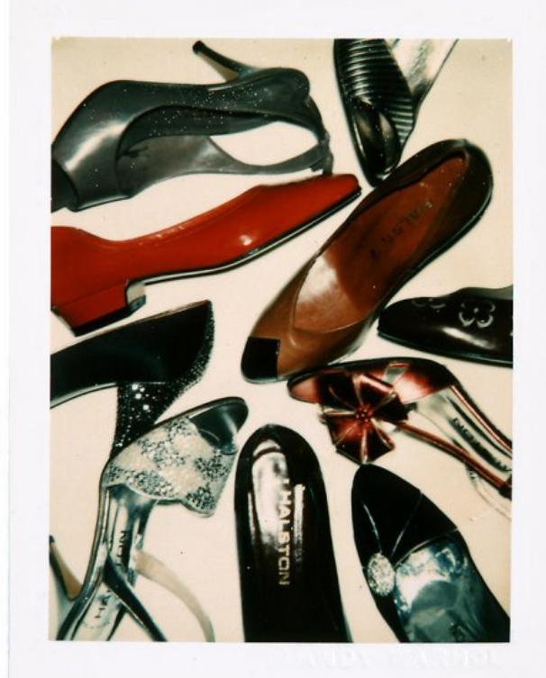
Resim 2, Andy Warhol, Polaroid Natürmort Örnekleri 9