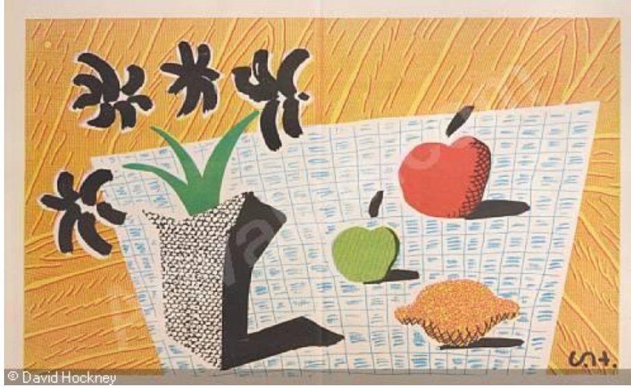
Resim 7, David Hockney, “Still Life”, 1965, 3 renk taşbaskı, 76,2 cm x 55,88 cm 14