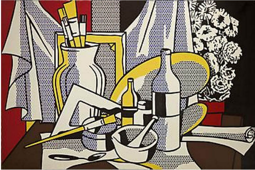
Roy Lichtenstein - "Still Life with Palette", 1972 Oil and Magna on canvas - 60 x 96 inches